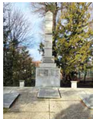
Fot. Maryna Link

W zbiorowej mogile przy ul. 30 Stycznia znajdują się szczątki prawie 500 osób, żołnierzy Armii Czerwonej (również narodowości polskiej), poległych w 1945 r. na terenie całego powiatu tczewskiego. W marcu ub. roku Rada Miejska w Tczewie podjęła uchwałę – apel o podjęcie działań związanych z przeniesieniem mogiły na cmentarz wojenny. Zgodnie z obowiązującymi przepisami, groby wojenne