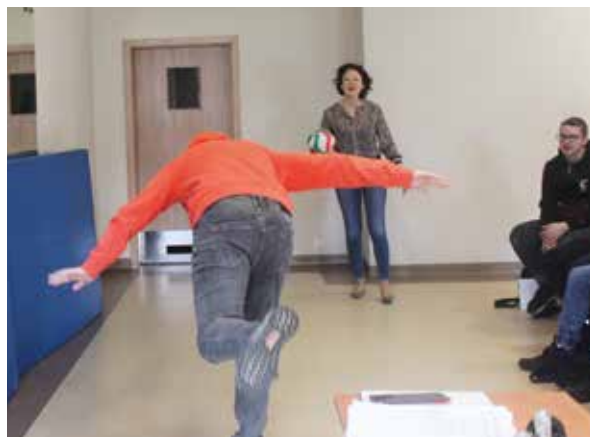
Materiały prasowe Straży Miejskiej w Tczewie

Podczas spotkania skupiono się przede wszystkim na odpowiedzialności, jaka wynika z bycia kierowcą oraz wpływu alkoholu na organizm młodego człowieka. Warsztaty mają na celu uwarściwienie młodych ludzi i przyszłych kierowców na problem jazdy pod wpływem alkoholu i innych używek. Tego typu prelekcje, opierające się na wspólnej konwersacji cieszą się dużym zainteresowaniem, a czynny udział młodzieży utwierdza