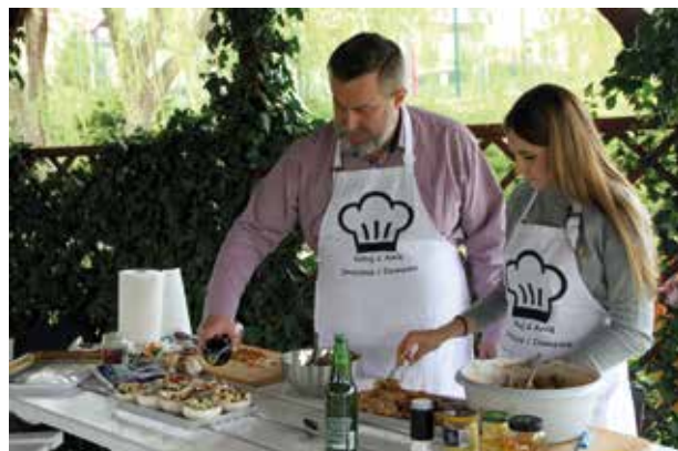
Fot. Małgorzata Mykowska

Maj to u nas tradycyjne rozpoczęcie sezonu grillowego,