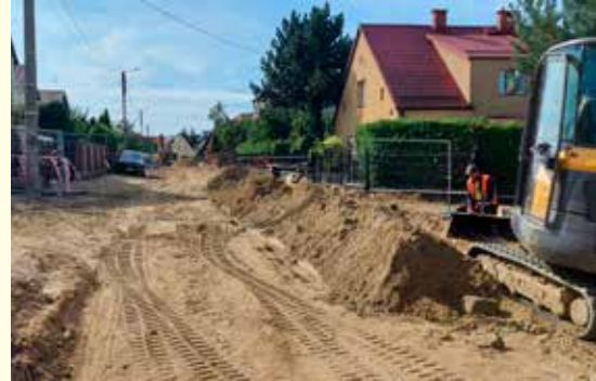
Materiały prasowe ZUK

Trwa przebudowa ul. Zygmunta Starego na os. Prątnica. Wartość zadania to 6,1 mln zł. Inwestycja jest dofinansowana w ramach Rządowego Funduszu Inwestycji Strategicznych, w wysokości 5 mln zł. Wykonawcą robót jest firma B&W Usługi Ogólnobudowlane z Pruszczu Gd. Termin zakończenia prac – listopad br.