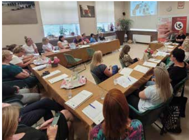
Uczestnicy seminarium w siedzibie CKZ Nauka

Tczewskie Centrum Kształcenia Zawodowego NAUKA otrzymała w zarząd platformę HomeCare, z zasobami edukacyjnymi dla samodzielnego uczenia się i rozwijania kompetencji i umiejętności w zakresie opieki nad osobą starszą w domu. Posiada ona dwa obszary szkoleniowe – związane z opieką nad osobą starszą oraz z inteligencją emocjonalną opiekuna nieformalnego. Platforma – adresowana praktycznie do wszystkich mieszkańców i organizacji Tczewa i regionu tczewskiego, jest dostępna w polskiej wersji językowej. Szczegółowe informacje można uzyskać pod adresem: www.opiekadomowa.homecareproject.eu , bezpośrednio w Nauce oraz na jej stronach internetowych i na facebooku.