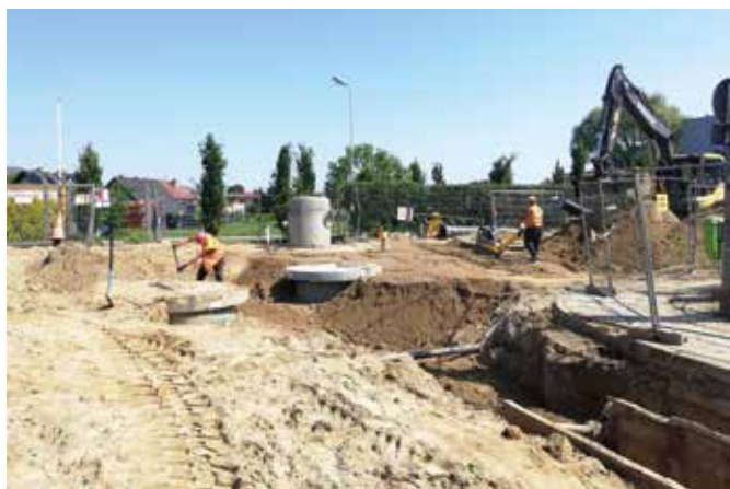
Prace przy ul. Zygmunta Starego

Wszystkie wymienione inwestycje, z ramienia Gminy Miejskiej Tczew, prowadzi Zakład Usług Komunalnych.