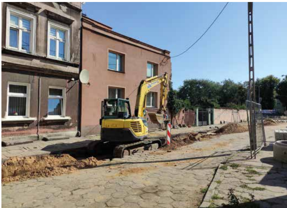
Remontowana ul. Królowej Jadwigi

Zakres inwestycji to przebudowa ul. Zygmunta Starego (blisko 400 m), fragmentu ul. Królowej Marysienki (46 m), przebudowa ścieżki rowerowej w obrębie drogi wojewódzkiej 224, remont nawierzchni odcinka ul. Stefana Batorego (ok 58 m), a także budowa lub przebudowa sieci kanalizacji deszczowej, sanitarnej, wodociągowej, elektroenergetycznej, a także montaż oświetlenia drogowego.