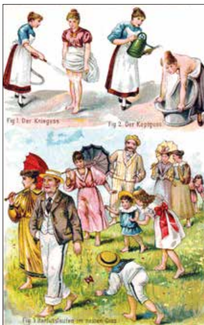
Ilustracja z 1894 obrazująca leczenie metodą księdza Kneippa