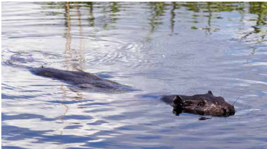
Bóbr europejski ( Castor fiber ) – największy gryzoń Eurazji

Rozległe parki o dużej różnorodności drzew i roślin zielnych sprzyjają osiedlaniu się w nich kolejnych gatunków ptaków: dzięciołów, kowalika, rudzika, pełzaczy, pokrzewek. Obecność starych, dziuplastych drzew sprzyja występowaniu puszczyka. Ssaki związane z parkami to wiewiórki, jeże, krety, ryjówki, czasem kuny i korzystające z naturalnych dziupli nietoperze. W naszym parku część żerujących tam nietoperzy zakłada swoje letnie kryjówki pod dachami okolicznych domów, a nawet bloków mieszkalnych. Wszystko zależy jednak od obfitości pokarmu w miejscach żerowania. Np. nasze tczewskie puszczyki bardzo lubią stare dziuplaste wierzby w pobliżu