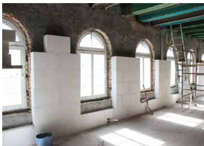
Fot. Jacek Cherek

Zadanie, na zlecenie Gminy Miejskiej Tczew, wykonuje wyłonione w przetargu Przedsiębiorstwo Budownictwa Elektroenergetycznego ELBUD Gdańsk S.A. Koszt inwestycji to 7 mln zł. Obecnie w bibliotece prowadzone są następujące prace: przygotowanie warstw izolacyjnych pod posadzki parteru i piwnic, zbrojenie posadzek parteru i piwnic, betonowanie posadzek, prace termomodernizacyjne ścian zewnętrznych od środka, układanie instalacji sanitarnych, elektrycznych i teletechnicznych.