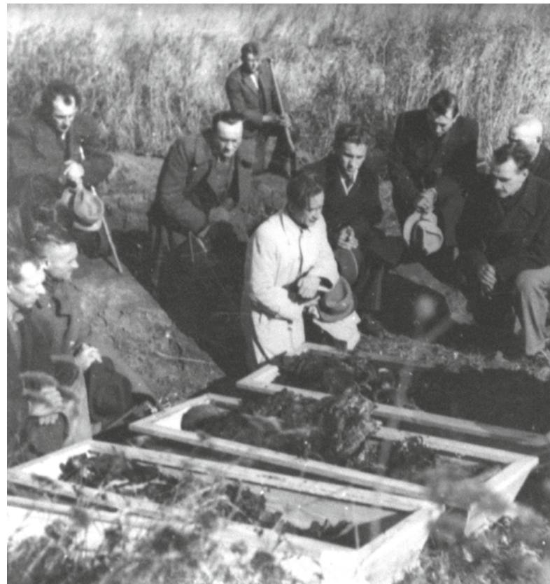
Ekshumacja pomordowanych na terenie przy prochowni