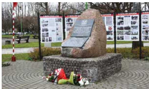
Materiały prasowe Starostwa Powiatowego w Tczewie

Przez 60 lat, do 2011 r. jednostka saperów (od 1994 r. 16. Tczewski Batalion Saperów) stacjonowała w Tczewie, po czym została przeniesiona do Niska w woj. podkarpackim. Uroczystości związane z upamiętnieniem święta saperów odbyły się w Parku Kopernika w Tczewie, gdzie znajduje się tablica z nazwiskami saperów, którzy zginęli pod-