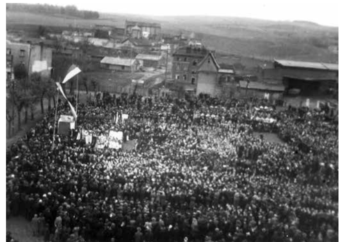
Pogrzeb ekshumowanych mieszkańców 1 listopada 1945 roku.