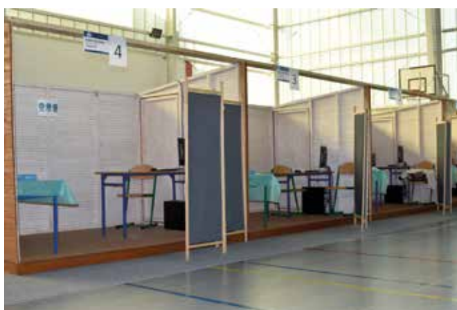
Materiały prasowe Starostwa Powiatowego w Tczewie

Ważne! W punkcie bezpośrednia rejestracja nie będzie możliwa. Rejestracji można dokonać dzwoniąc na całodobową i bezpłatną infolinię