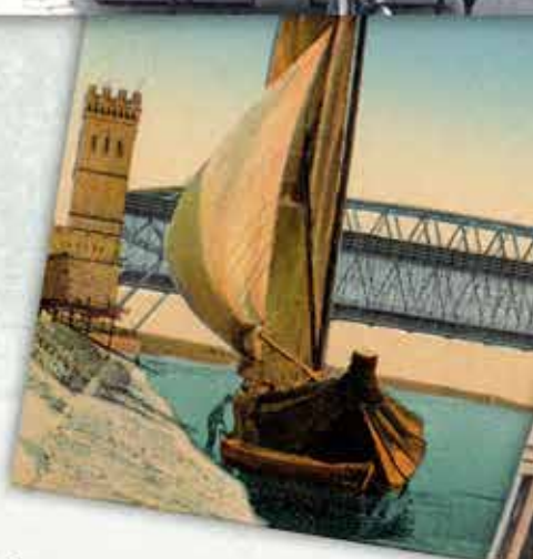
Wielomlebrücke mit Segelschiff