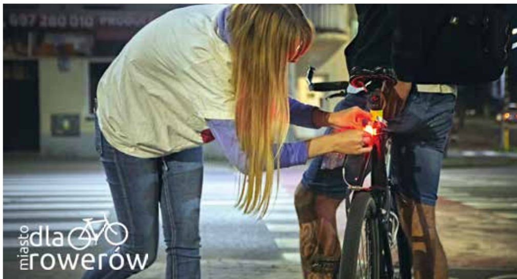
W ramach akcji „Bądź jak Superbohater. Bądź widoczny” rozdawano oświetlenie rowerowe

Na przełomie marca i kwietnia zapraszamy do wspólnego przeglądu ścieżek i dróg rowerowych. Zbiorowy głos mieszkańców Tczewa wesprze zespół w monitorowaniu ewentualnych defektów na ścieżkach rowerowych, co przyspieszy proces napraw i zmian. Liczymy na zaangażowanie mieszkańców. Usterki i potrzeby można zgłaszać na bieżąco drogą mailową, przez stronę facebooko-