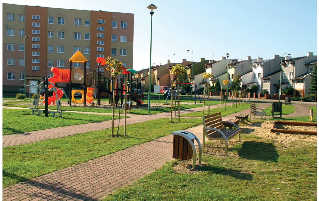
Budżet Obywatelski Tczewa realizujemy od 2014 roku. W tym czasie powstało ponad 100 nowych inwestycji

Wzory kart do głosowania w wersji papierowej i elektronicznej są dostępne na www.bo.tczew.pl . Można je również otrzymać w Urzędzie Miejskim.