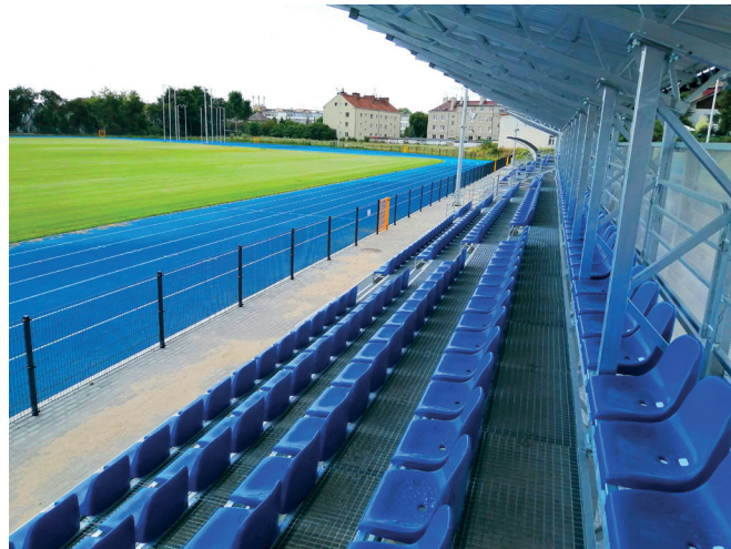
Kończy się realizacja II etapu budowy stadionu lekkoatletycznego. Trybuny pomieszczą 500 kubiców