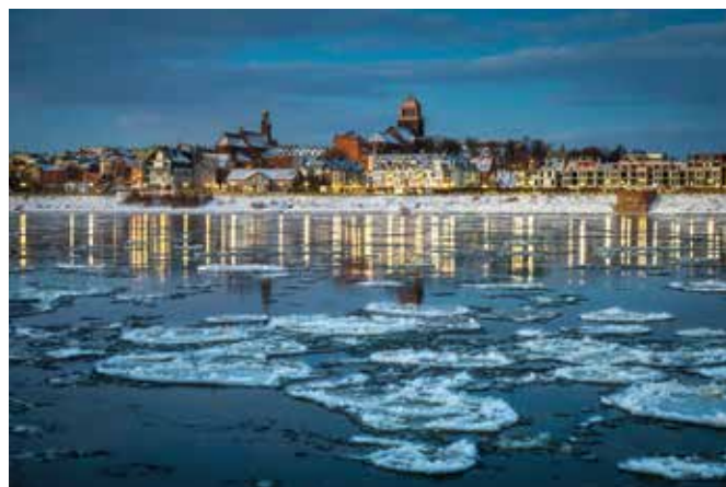
Luty – III nagroda