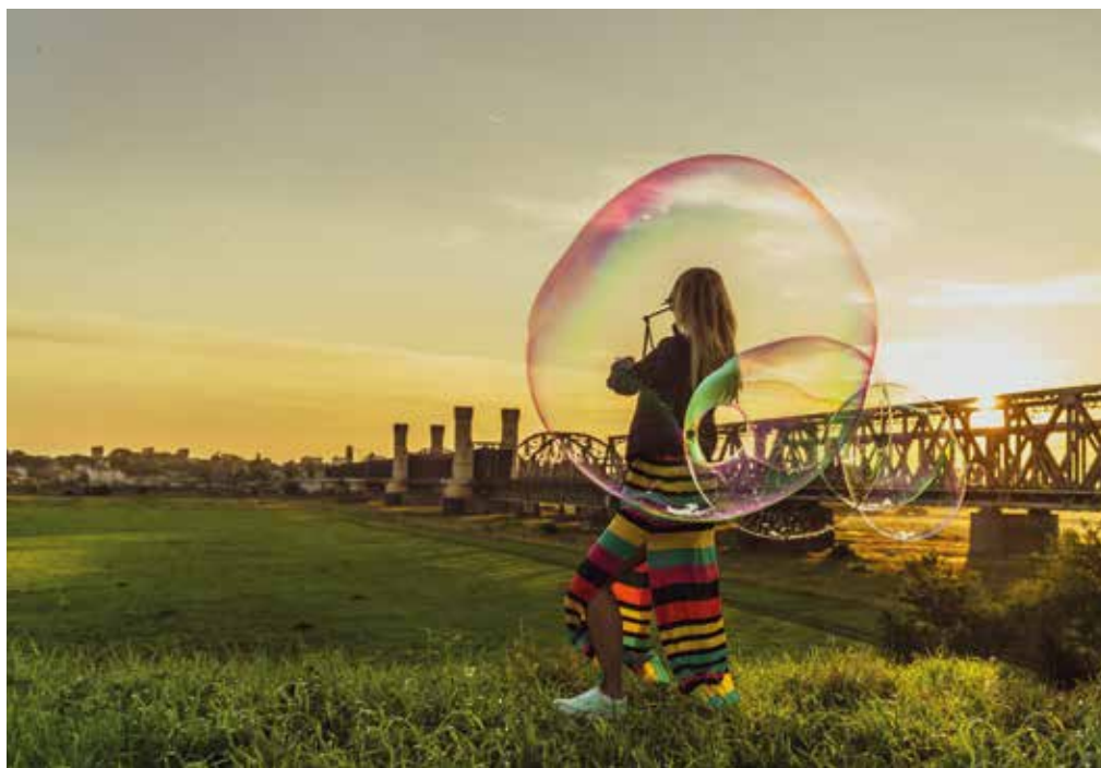
Czerwiec – I nagroda

Wyróżnienia (po 200 zł) otrzymały wszystkie pozostałe osoby, których zdjęcia znalazły się w kalendarzu: