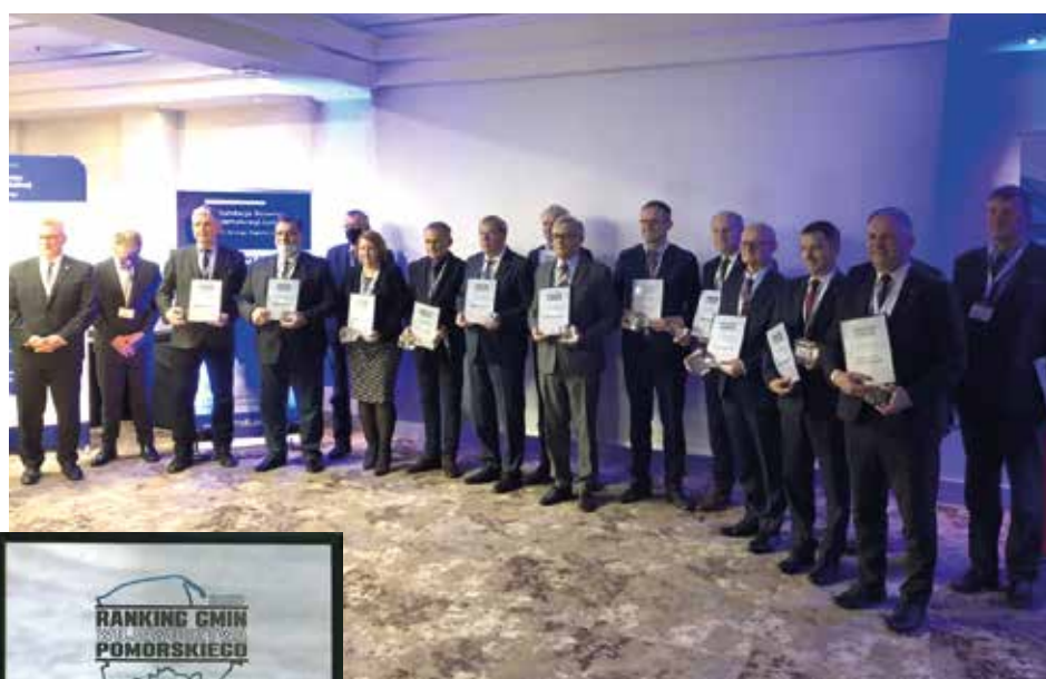
Materiały prasowe Fundacji Rozwoju Demokracji Lokalnej

Wyniki zostały ogłoszone podczas gali 18 listopada, która odbyła się w Gdańsku. W rankingu zorganizowanym przez Fundację Rozwoju Demokracji Lokalnej oceniano 119 pomorskich samorządów.