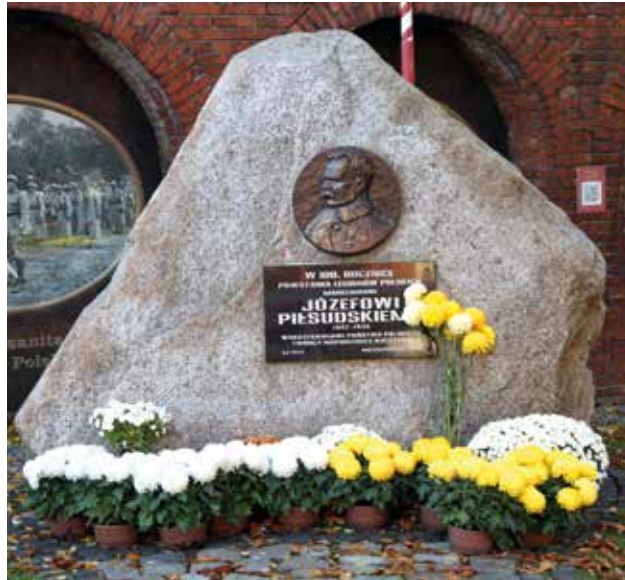
Kwiatami udekorowane zostały tczewskie miejsca pamięci oraz skwery i ulice

Dlatego miasto Tczew, podobnie jak wiele innych samorządów, wsparło lokalnych handlowców kupując od nich kwiaty przeznaczone do sprzedaży o okresie Wszystkich Świętych i Zaduszek. Zakupionych zostało kilkaset doniczek z chryzantemami.