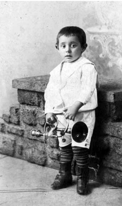
Kilkuletni Alfred Eisenstaedt Zdjęcie wykonane w zakładzie Th. Lange na ówczesnej Berlinerstrasse 16/17 (dzisiaj ul. Krótka)