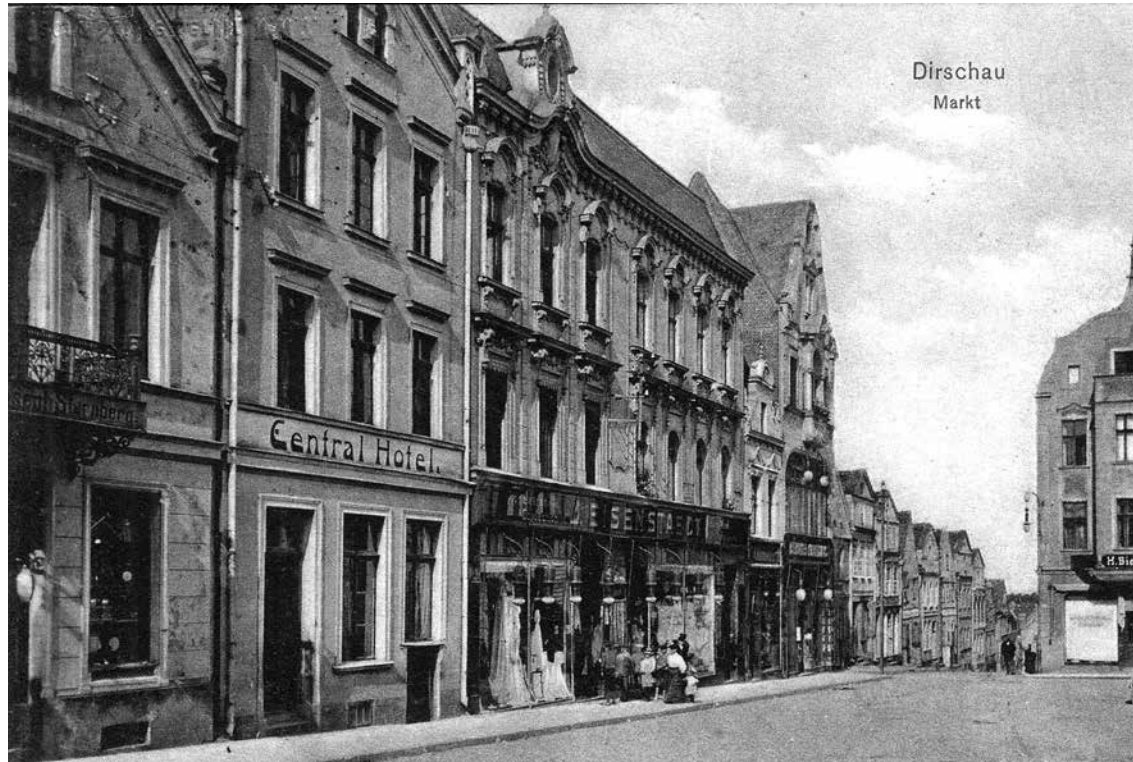
Sklep rodziny Eisenstaedt na tczewskim rynku, początek XX wieku

Nazywany był ojcem fotózurnalizmu, ale o sobie mówił, że jest facetem, który po pro- stu lubi robić zdjęcia. Alfred Eisenstaedt, którego nazwisko jest dobrze znane wszystkim miłośni- kom fotografowania, urodził się w Tczewie 6 grudnia 1898 r.