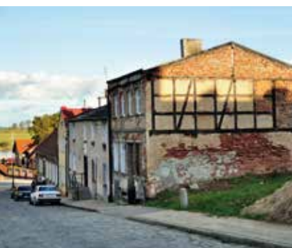
Ulica Podgórna dawniej