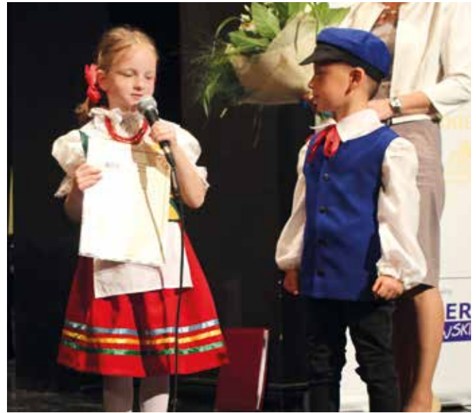
Życzenia dla jubilata przekazały m.in. dzieci z Przedszkola nr 8