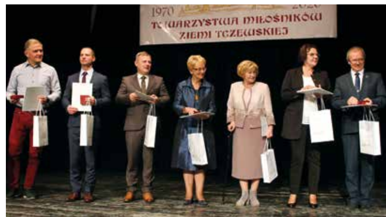
Gala zgromadziła wielu sympatyków i członków stowarzyszenia