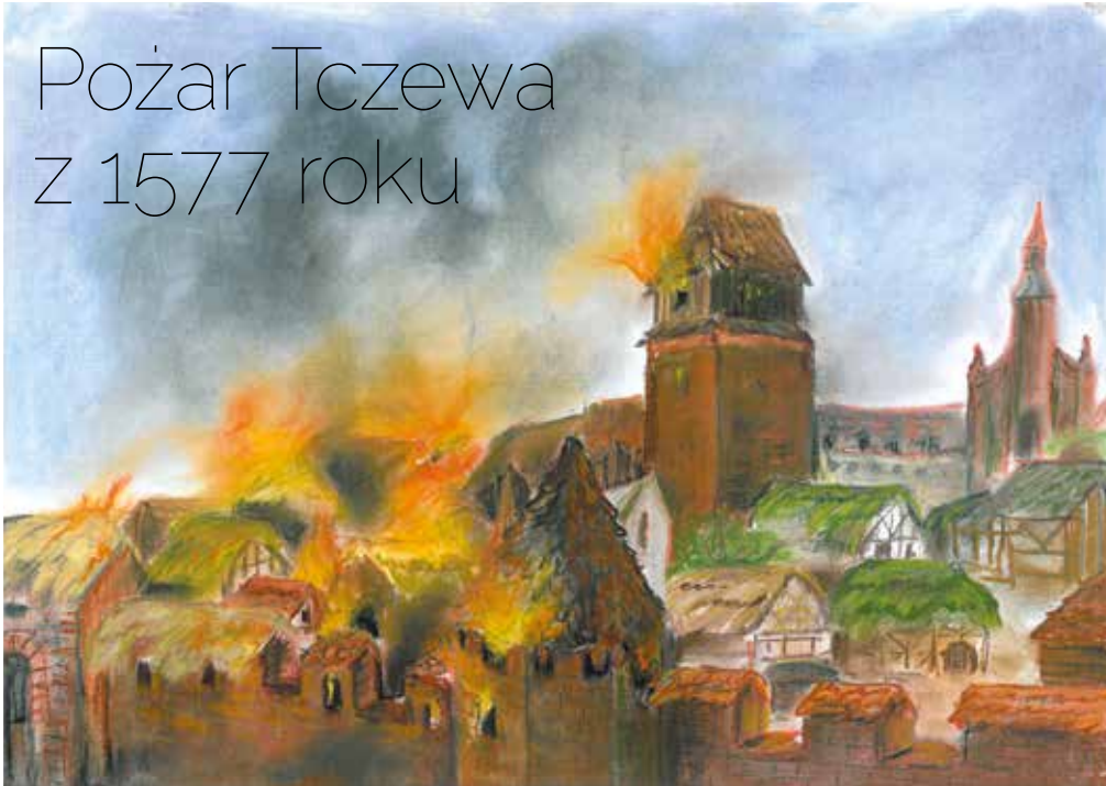
Obraz współczesny, autor: Barbara Moryl-Fećkaw