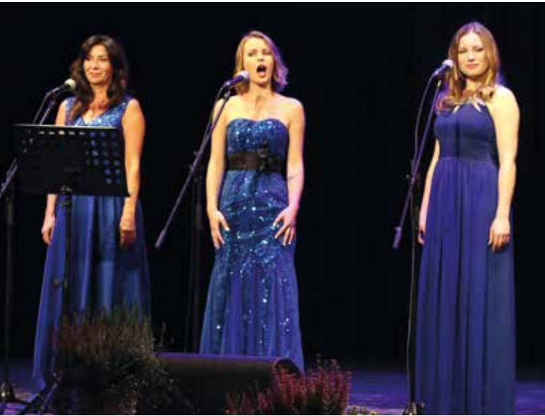
Występ sopranistek z zespołu Bellcanti