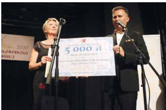
Prezydent Tczewa obdarował Towarzystwo czekiem na 5 tys. zł

– TMZT w ciągu półwiecza swojej działalności zrzeszało