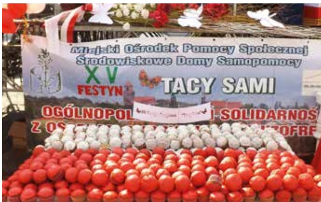
Materiały prasowe MOPS-u

Realizacją zadań w Miejskim Ośrodku Pomocy Społecznej oraz jego placówkach zajmuje się 119 osób. Do końca września 2020 roku działania MOPS uwzględniając realizację programów rządowych skierowane były do 15 601 mieszkańców naszego miasta.