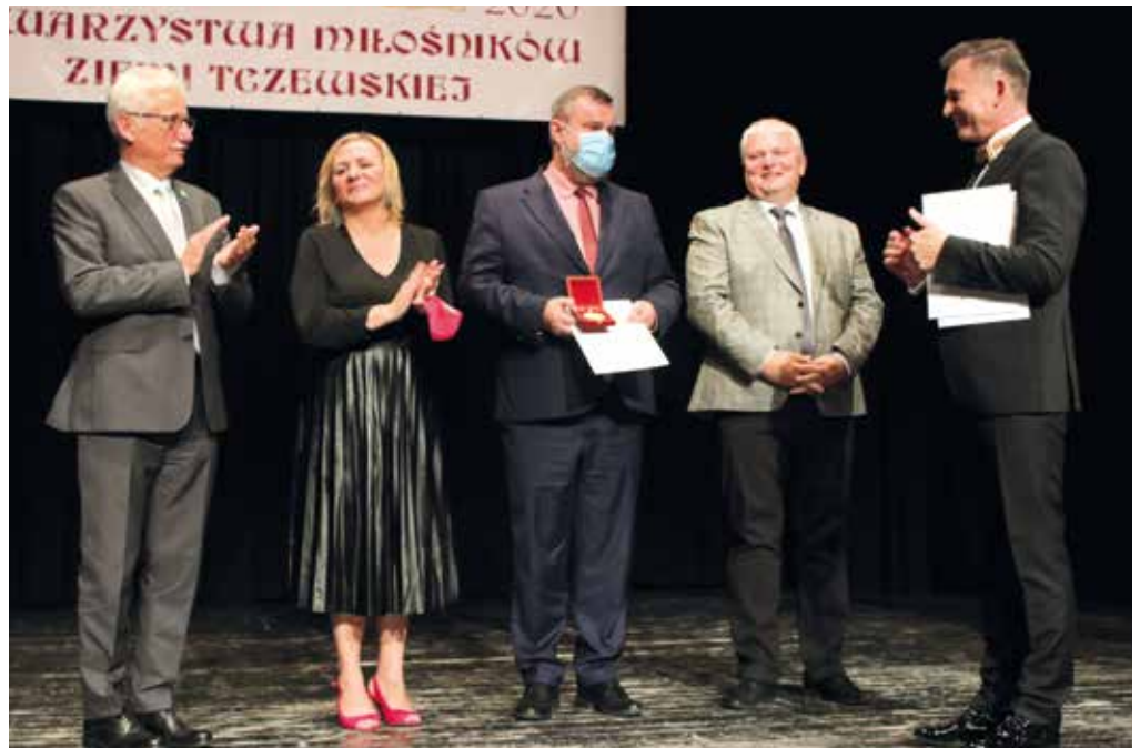
Podziękowania dla samorządowców ze wspieranie stowarzyszenia

Towarzystwo Miłośników Ziemi Tczewskiej świętowało jubileusz 50-lecia. Uroczystości odbyły się 25 września w Centrum Kultury i Sztuki.