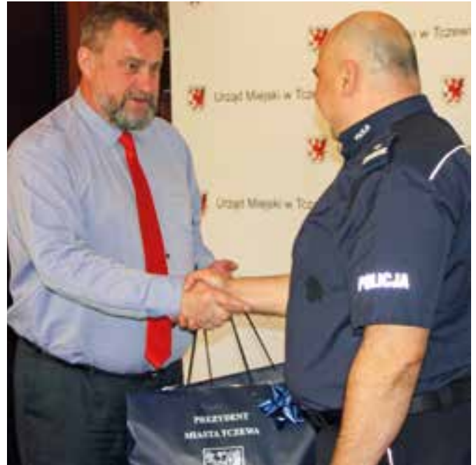
Prezydent Tczewa przekazał powiatowemu komendantowi policji odblaski przeznaczone dla pierwszoklasistów

policjanci czy strażnicy miejscy, jest bardzo ważne dla ich bezpieczeństwa.