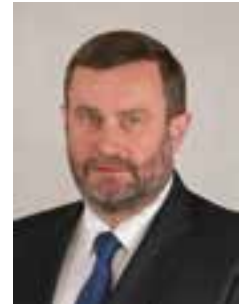
Mirosław Pobłocki Prezydent Tczewa:

Od 2012 roku trwa właściwa, podzielona na wiele etapów, odbudowa Mostu Tczewskiego, która ma sprawić, że obiekt będzie wyglądał tak jak przed wybuchem wojny. W 2019 roku minęło od początku remontu 7 lat, wydano łącznie ok. 70 mln zł, a most nie został odbudowany nawet w połowie. Starostwo cyklicznie co kilka lat prosi sąsiednie samorządy oraz Ministerstwo Infrastruktury o pomoc w finansowaniu kolejnych etapów. Przy bardzo optymistycznym założeniu pełna odbudowa Mostu Tczewskiego mogłaby zostać zakończona dopiero w 2028 roku, czyli 17 lat po jego zamknięciu.