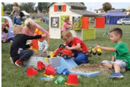
Dzieci doskonale się bawiły w „strefie malucha”