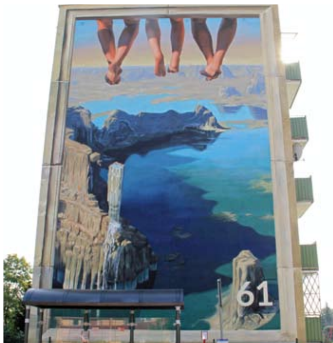
Mural przy ul. Armii Krajowej 61

Artysta został nagrodzony przez prezydenta Tczewa Mirosława Pobłockiego , nagrodą w wysokości 2 tys. zł. J.