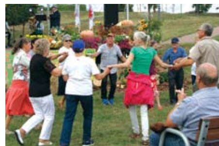
Przy muzyce nogi same rwały się do tańca