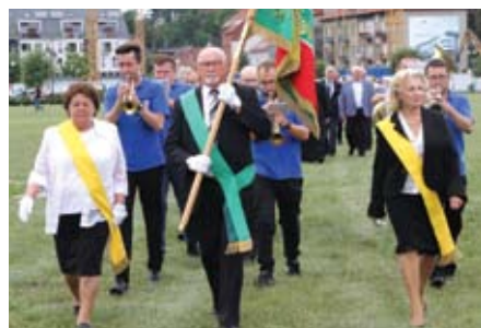
Impreza rozpoczęła się przemarszem