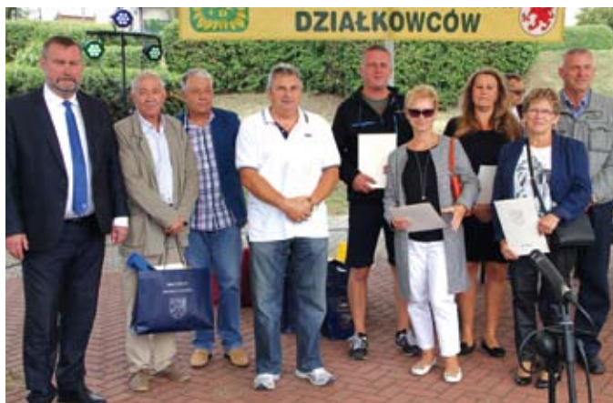
Prezydent Tczewa z nagrodzonymi działkowcami

– Cieszę się, że dożynki działkowe stały się imprezą ogólnomięską, tym bardziej, że znaczną