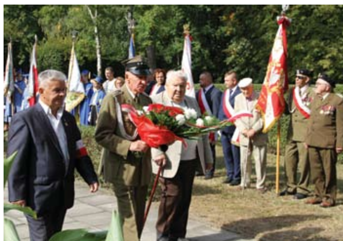
Kwiaty pod pomnikiem złożyli m.in. kombatancki

17 września 1939 r. o świcie, łamiąc polsko-sowiecki pakt o nieagresji, bez wypowiedzenia wojny, Armia Czerwona wkroczyła na teren Polski. Atak na Polskę był realizacją tajnych