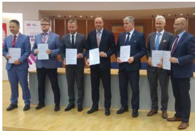
MATERIAŁY PRASOWE URZĘDU MARSZAŁKOWSKIEGO W OJ. POMORSKIEGO

Pojazdy komunikacji publicznej zostaną oznakowane kodami QR. Na razie system nie będzie posiadać modułu sprzedaży biletów. Testy będą prowadzić specjalnie przeszkolone osoby. Testerzy zostaną podzieleni na trzy grupy. Pierwsza będzie miała do realizacji wyznaczone scenariusze podróży np. z przesiadkami pomiędzy konkretnymi pojazdami czy na konkretnej trasie. Zadaniem drugiej będzie sprawdzenie, jak system zachowywać się będzie przy