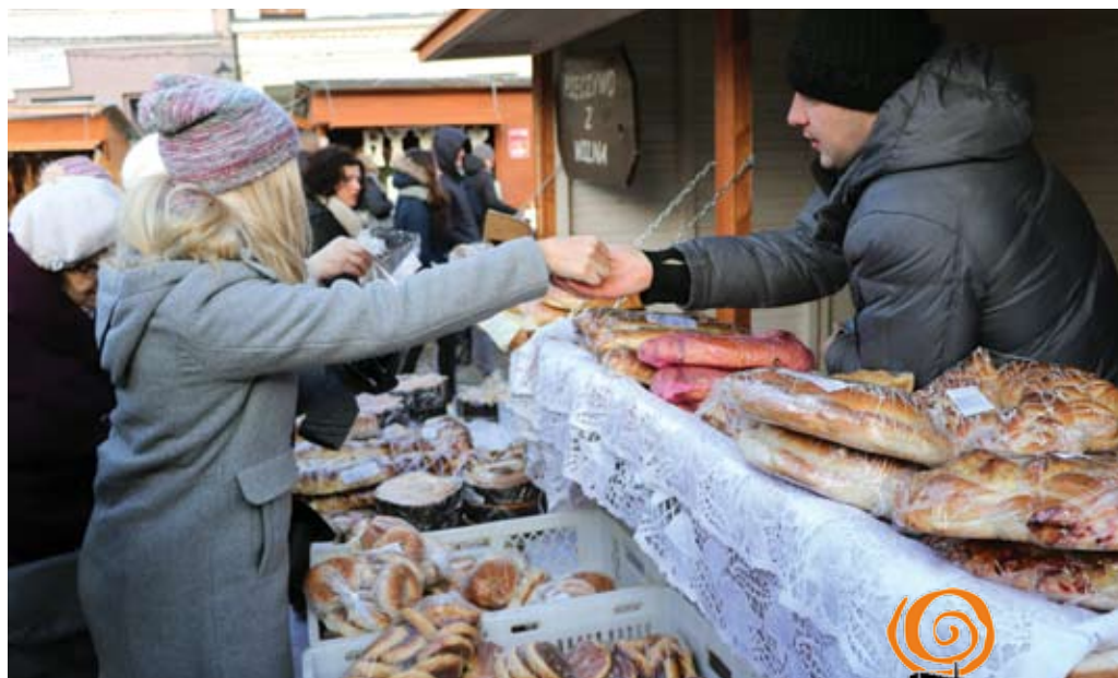
Jarmark Bożonarodzeniowy 2017

Każdy, kto chce zostać Wystawcą, powinien zapoznać się z regulaminem wydarzenia i wypełnić formularz dostępny na: www.pchlitarg.tczew.pl . Rekrutację prowadzi Fabryka Sztuk od 5 października do 4 listopada. W przypadku dużej ilości zgłoszeń zostanie dokonany wybór propozycji naj-