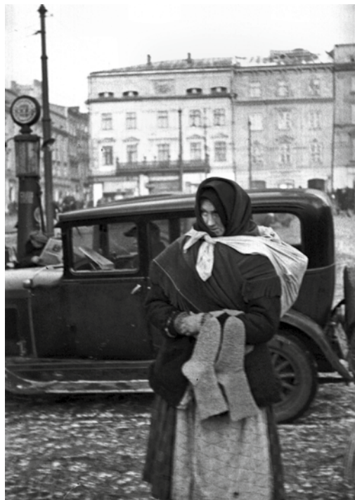
Kobieta sprzedająca skarpety, 1931 r.

Zanim Rzymianie w II w. n.e. zaczęli szyc skarpety z tkanin, ich funkcję pełniły paski skór czy tkanin lub sfilcowane włosy