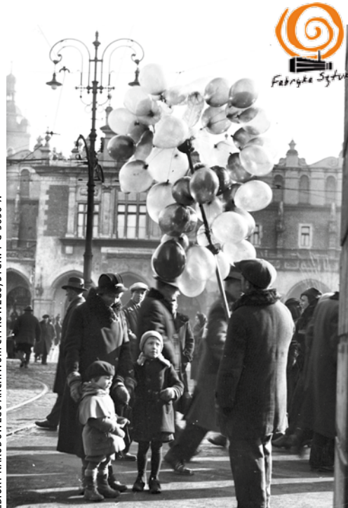
Uliczny sprzedawca baloników, 1934 r.

zwierząt. Takie praskarpety owijano wokół stopy. W średniowieczu szyte skarpety były popularne wśród duchowieństwa i symbolizowały czystość. Około 1000 r. w Egipcie zaczęto dziergać skarpety na drutach. Produkcję skarpet usprawniło wynalezienie w XVI