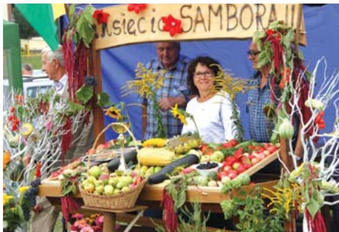
Każdy z ogrodów przygotował własne stoisko

Na chętnych czekała bezpłatna grochówka oraz kawa i herbata, dla dzieci była wata cukrowa. Na działkowym festynie nie zabrakło muzyki. Oprócz orkiestry TOR-