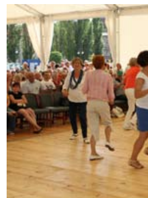
Gdańska Orkiestra Ogrodów do tańca