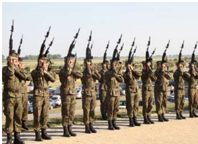
Żołnierze 22. Bazy Lotnictwa Taktycznego z Malborka oddali salwę honorową