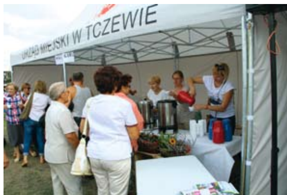
Przy stoisku Urzędu Miejskiego czekała kawa, herbata i pączki