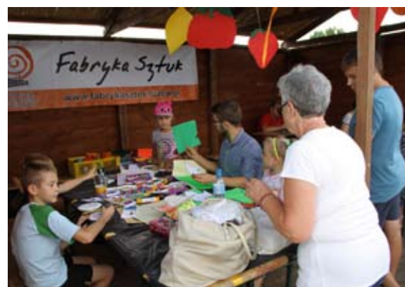
Warsztaty artystyczne z Fabryką Sztuk