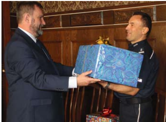
Prezydent Tczewa przekazał odblaski dla pierwszoklasistów zastępcy komendanta policji

Co roku na początku września, tczeńska policja wspólnie ze strażą miejską i inspektoratem