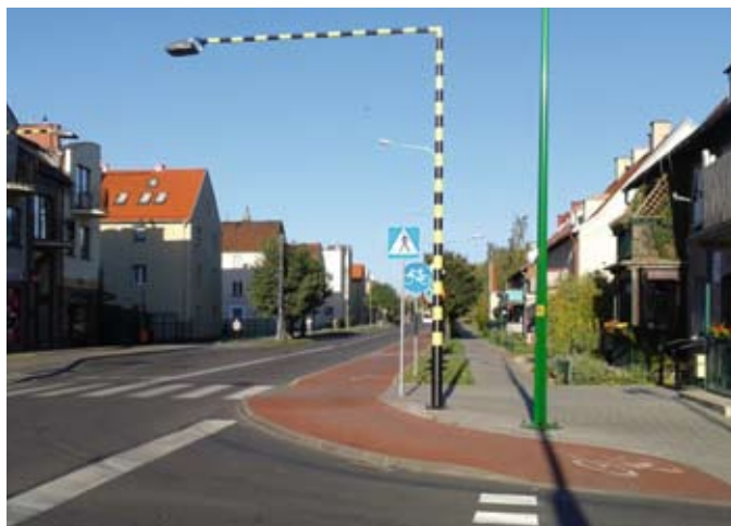
W konkursie pochwaliliśmy się m.in. ścieżkami rowerowymi, które powstały w ciągu ostatnich dwóch lat.

Gminy uczestniczące w konkursie pytano m.in. o infrastrukturę ułatwiającą przemieszczanie się rowerzystom (drogi i szlaki rowerowe, stojaki na rowery, tablice informacyjne), współpracę z organizacjami pozarządowymi i innymi organizatorami imprez dla rowerzystów. Pytano również o działania promocyjne zachę-