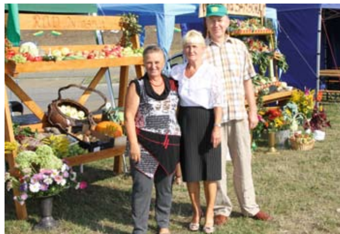
Działkowcy dumnie prezentowali swoje stoiska