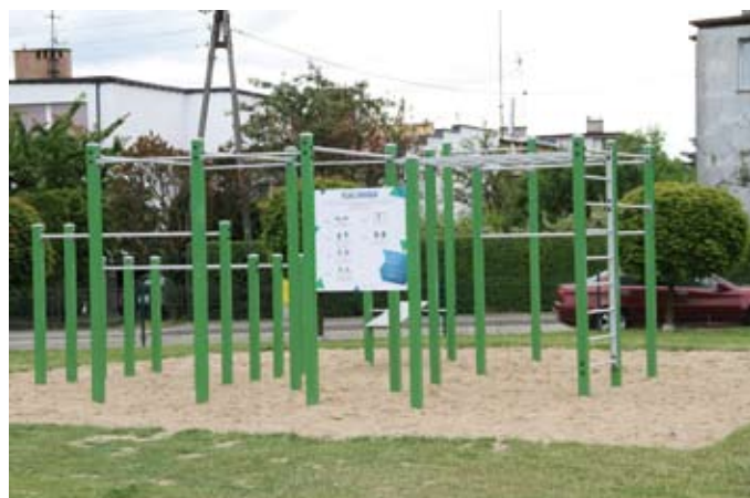
Nowe urządzenia do rekreacji na os. Górki