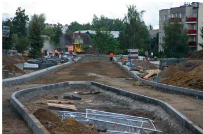
Prace przy budowie tzw. ul. Nowosuchostrzyckiej potrwać do końca października

Koszt inwestycji to 3,8 mln zł. Inwestycja uzyskała dofinansowanie w ramach Narodowego Programu Przebudowy Dróg Lokalnych – Etap II Bezpieczeństwo – Dostępność – Rozwój (Edycja 2015).