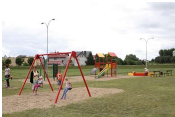
Jeden z siedmiu nowych placów zabaw – na niecce czyżykowskiej