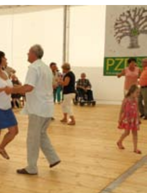
wa porwała działkowców