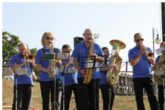
Działkowców z całej Polski witała orkiestra dęta „Torpeda”

Premier Ewa Kopacz w towarzystwie prezydenta Tczewa zwiedziła stoiska tczewskich ogrodów działkowych. Działkowcy chętnie