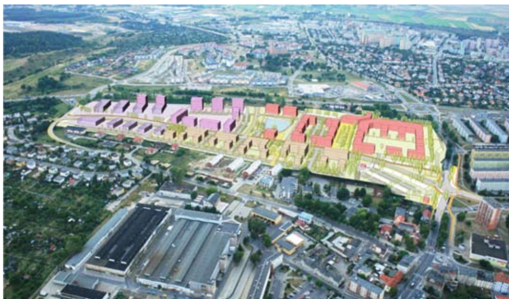
Autorem wizualizacji jest ARCA Biuro Projektów Urbanistyki i Architektury z Gliwic

– funkcje usługowo-przemysłowe (funkcje usługowe, przemysł high-tech, nieuciążliwe funkcje przemysłowe, w formie parków