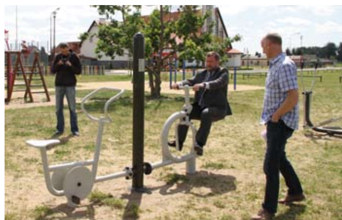
Siłownią pod chmurką na Os. Staszica wypróbował już prezydent Tczewa M. Pobłocki