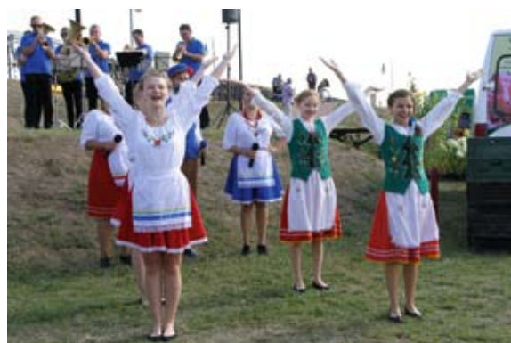
Dziewczęta z zespołu „Frantówka” pokazały, jak się tańczy po kociewsku