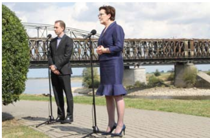
Premier Ewa Kopacz zapewniła o swoim poparciu dla odbudowy Mostu Tczewskiego