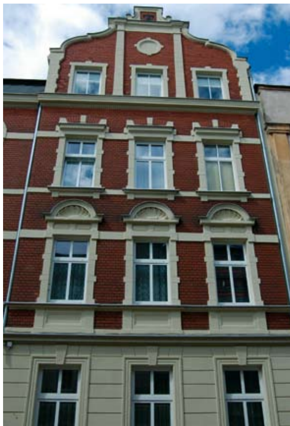
Jedna z nagrodzonych elewacji – przy ul. Kopernika 7