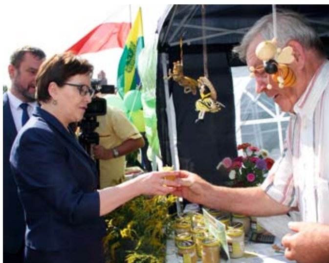
Premier Ewa Kopacz chętnie oglądała dożynkowe stoiska, np. to z produktami z pasieki