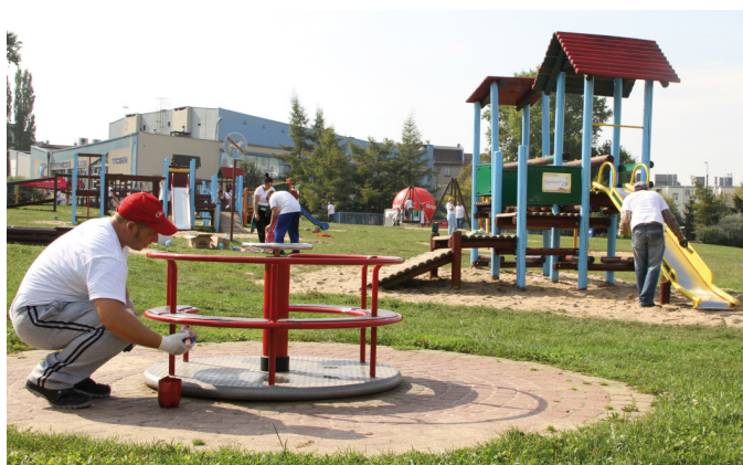
36 pracowników ZEC odnowiło plac zabaw

– Dzięki programowi WDLZ mamy szansę wspierać lokalną społeczność poprzez realizację projektów dedykowanych mieszkańcom oraz środowisku lokalnemu. W tej edycji naszym celem jest również promocja sportu i aktywnego wypoczynku – stąd na-