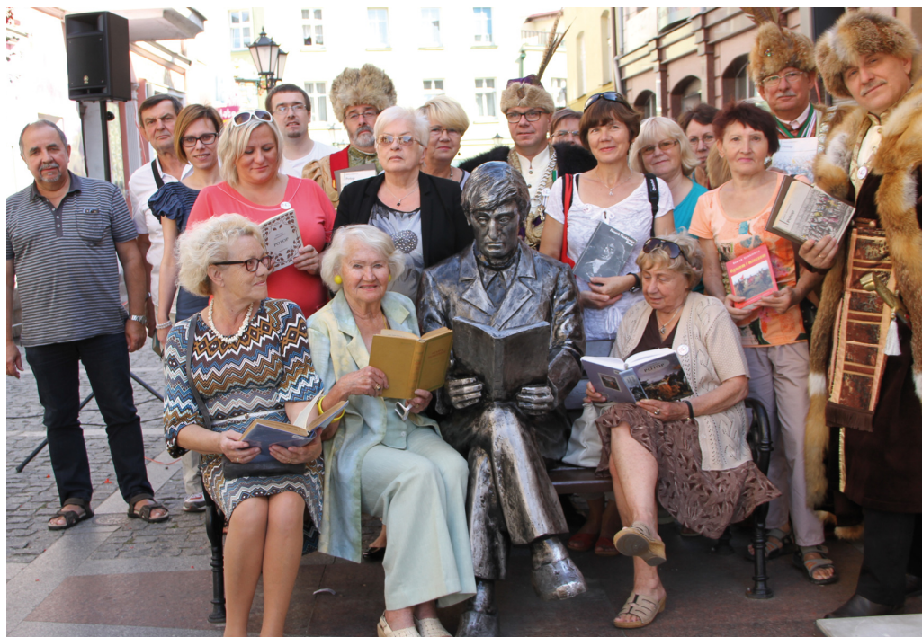
Miłośnicy Trylogii pozwali do wspólnego zdjęcia

Na zakończenie, swój ulubiony fragment Trylogii mogli poczy-