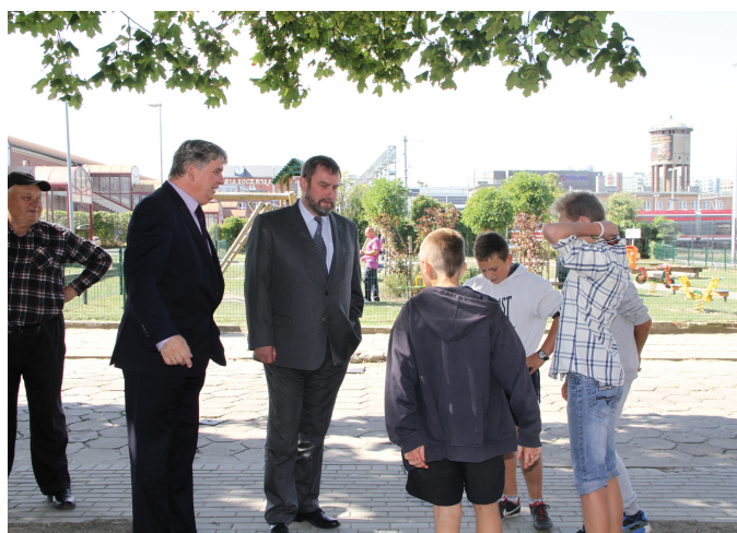
Mieszkańcy Zatorza czekają już na kolejny budżet obywatelski i rozmawiają z prezydentem Tczewa o swoich nowych pomysłach

2 siłownie powstały również na os. Górki (rejon skweru 750-lecia oraz ul. Malczewskiego i Stanisławskiego) i na Suchostrzy-