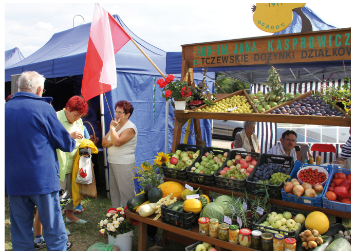
Każdy z ogrodów chwalił się swoimi plonami