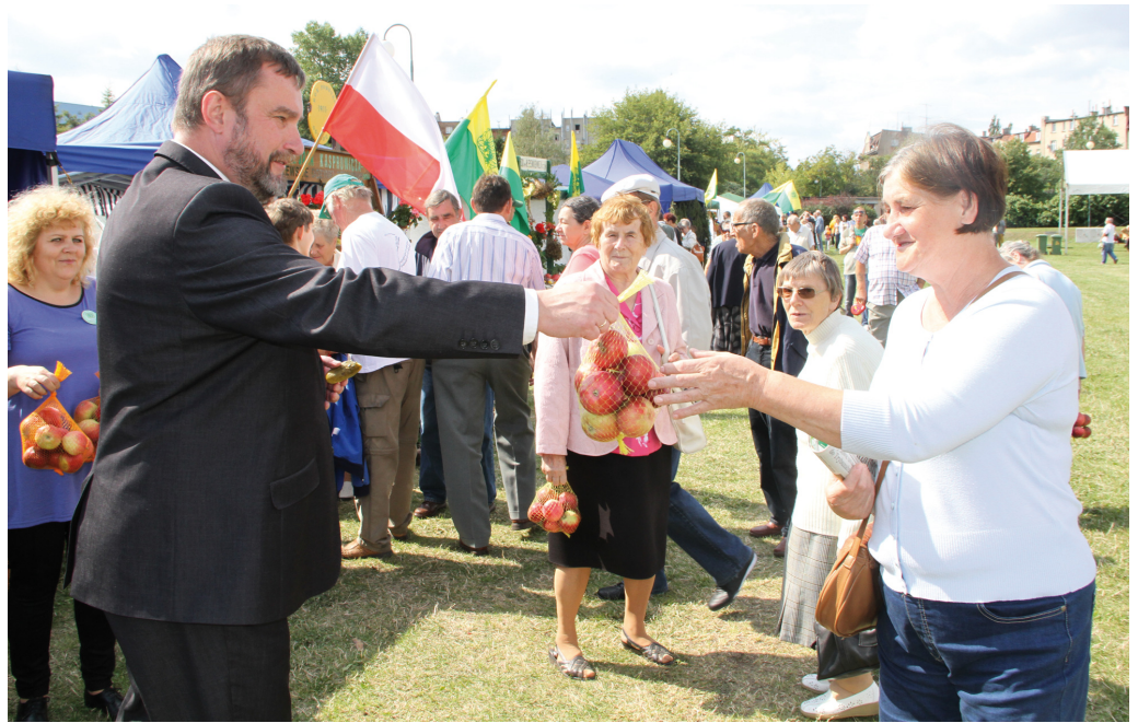
Prezydent Tczewa częstował jabłkami – podczas dożynek rozdaliśmy tonę tych owoców

Dożynki były okazją do wręczenia podziękowań i gratulacji