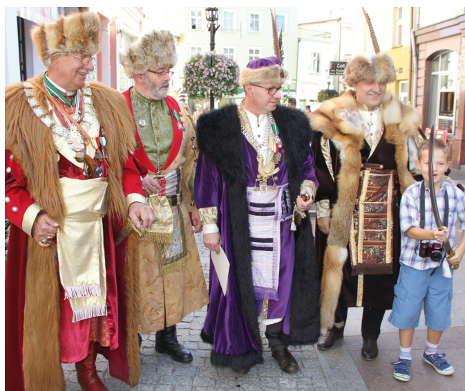
Członkowie Bractwa Kurkowego przyszli w historycznych strojach

tać chętni. Każdy, kto przyszedł z książką, otrzymał pieczęć Narodowego Czytania, którą specjalnie na tę okazję otrzymaliśmy od Prezydenta RP.