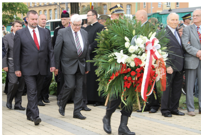
Kwiaty pod obeliskiem złożyli m.in. samorządowcy

Na zakończenie uroczystości, delegacje złożyły kwiaty pod obeliskiem poświęconym Bohaterom żołnierzom 2. Batalionu Strzelców, obrońcom mostu na Wiśle, polskim celnikom i kolejarzom z Szymankowa.