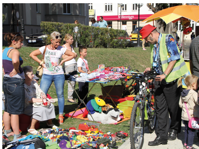
Wystawcy i klienci już pytają o kolejną edycję targowiska

„Wrześniowe Targowisko” zorganizowane zostało przez Urząd Miejski w odpowiedzi na potrzeby mieszkańców, którzy zgłaszali chęć udziału w imprezach podobnych do czerwcowego „Pchlego Targu”. Tymrazem wystawcy rozłożyli swoje stoiska w nicoce przy ul. Łaziennej. Impreza odbyła się w pierwszą sobotę po rozpoczęciu roku szkolnego, aby młodzież miała jeszcze szansę kupić lub sprzedać podręczniki. Handlowano też innymi książkami, płytami, grammi komputerowymi, używaną