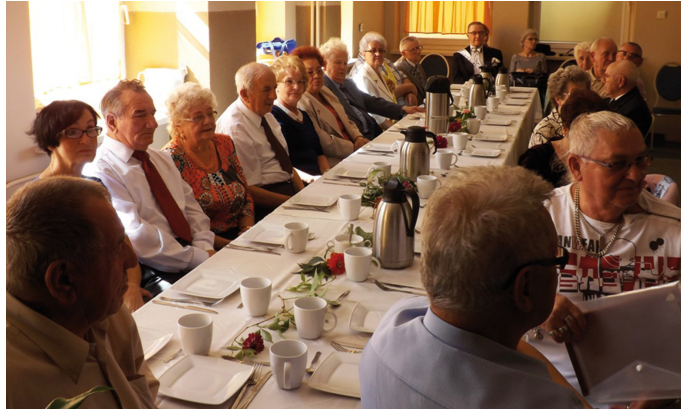
Seniorzy zaprosili na spotkanie m.in. prezydenta Tczewa