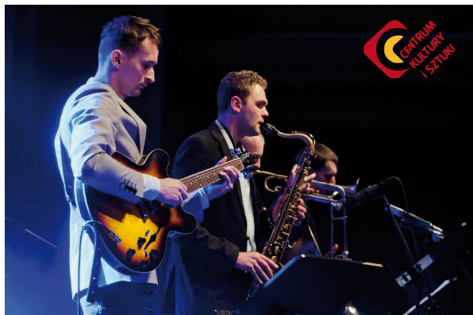
Generation Next podczas ubiegłorocznego festiwalu Jazz nad Odrą