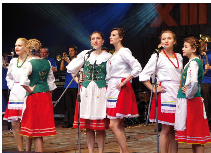
„Piejo kury, piejo” – w wykonaniu Kociewsko-Kaszubskiej Orkiestry Dętej „Torpeda” i Zespołu Pieśni i Tańca „Frantówka”

Ponieważ w tegorocznej edycji konkursu wzięło udział sześć zespołów, a organizatorzy przygoto-