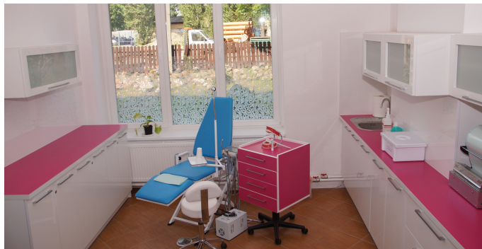
Pracownia do nauki w zawodzie asystentka stomatologiczna

Medyczne Studium Zawodowe ma już trzy lata. Funkcjonuje na prawach i obowiązkach szkół publicznych. Organizując je, tczewskie CKZ „Nauka”, skorzystało z uprawnień nadanych przez Ministra Zdrowia. Jak każda szkoła zobowiązana do kierowania się zasadami szkoły publicznej, CKZ „Nauka” i jej szkoły medyczne