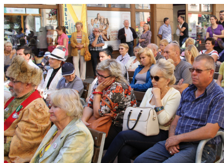
Tczewianie z zainteresowaniem słuchali fragmentów „Potopu”