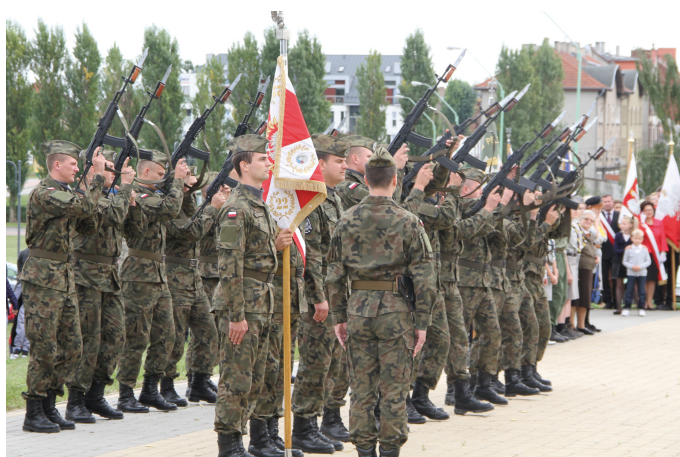
Żołnierze Kompanii Reprezentacyjnej 22. Bazy Lotnictwa Taktycznego w Malborku oddali salwę honorową