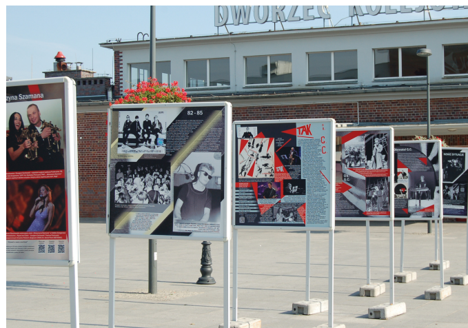
Wystawę na tczewskim „węźle” można oglądać do końca września