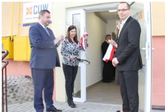
Centrum Usług Wspólnych mieści się przy ul. Kołłątaja 9

Oddziałami Integracyjnymi im. płk. Stanisława Dąbka w Tczewie, – Szkoła Podstawowa nr 11 im. Mikołaja Kopernika w Tczewie, – Szkoła Podstawowa nr 12 im. Bronisława Malinowskiego w Tczewie, – Gimnazjum nr 1 im. gen. Jana Henryka Dąbrowskiego w