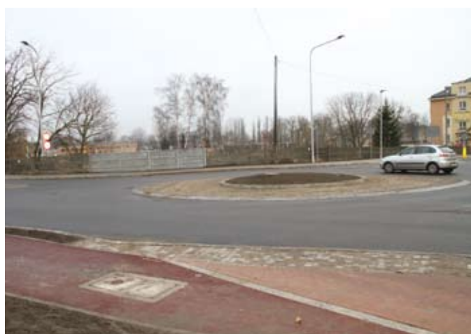
Rondo to początek dużej inwestycji związanej z rozbudową węzła transportowego