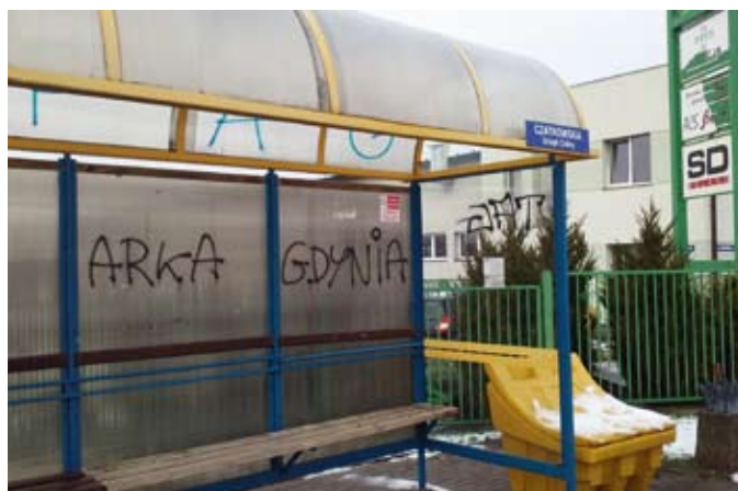
Wiaty przystankowe przy ul. Czatkowskiej

Naprawa jednej wiaty przystankowej sporo kosztuje. Wymiana tylnej ściany takiej wiaty to wydatek rzędu od 800 do 1200 zł. W przypadku bocznej ściany mowa