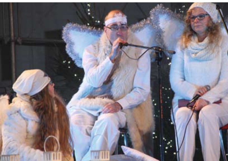
Nietypowe jasełka w wykonaniu podopiecznych środowiskowych domów samopomocy