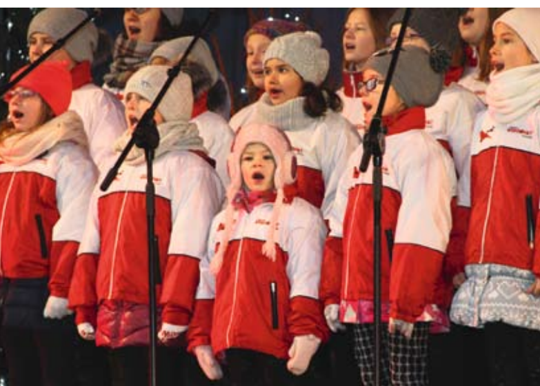
Jak co roku wystąpił Chór Biedronki