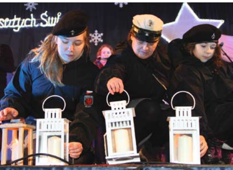
Betlejemskie Świecielnko Pokoju