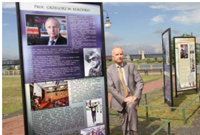
Prof. Grzegorz Kołodko podczas otwarcia wystawy „Tczew – zapamiętani i znani” na Bulwarze Nadwiślańskim (czerwiec 2016 r.)

Profesor Grzegorz Kołodko urodził się w Tczewie. Tutaj ukończył szkołę podstawową i średnią. Od 1989 roku jest profesorem zwyczajnym. W latach 80-tych był doradcą prezesa NBP, pracował w Światowym Instytucie Badań Rozwoju Gospodarczego ONZ w Helsinkach. Jako profesor nauk ekonomicznych jest autorem