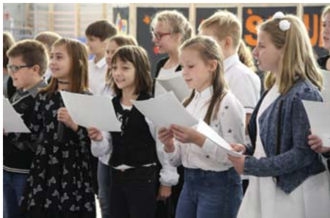
W Szkolnym Budżecie Obywatelskim wzięli udział uczniowie wszystkich samorządowych szkół podstawowych

Wśród pomysłów przegłosowanych przez dzieci i młodzież są m.in. rozbudowa szkolnej sceny teatralnej, zakup sprzętu na-