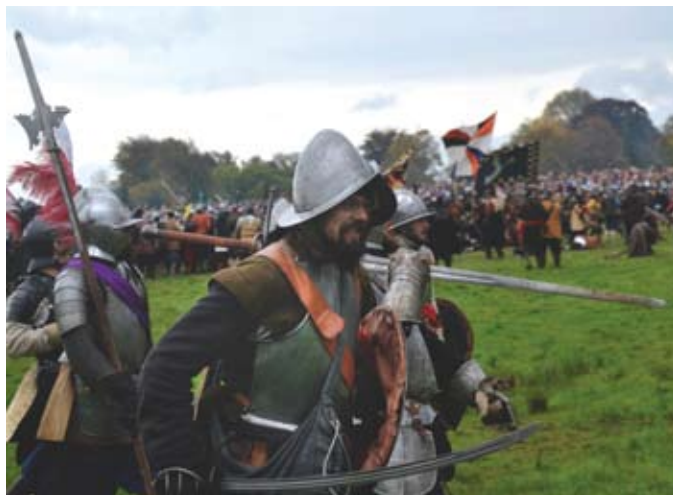
Rekonstruktorzy podczas inscenizacji

– Inscenizacja bitwy, obozowisko, kramy kupieckie, warsztaty dawnego rzemiosła, strzelanie z łuku, muzyka z epoki, przemarsze z pochodniami, turniej szabli. To tylko niektóre atrakcje. Do Tczewa przyje-