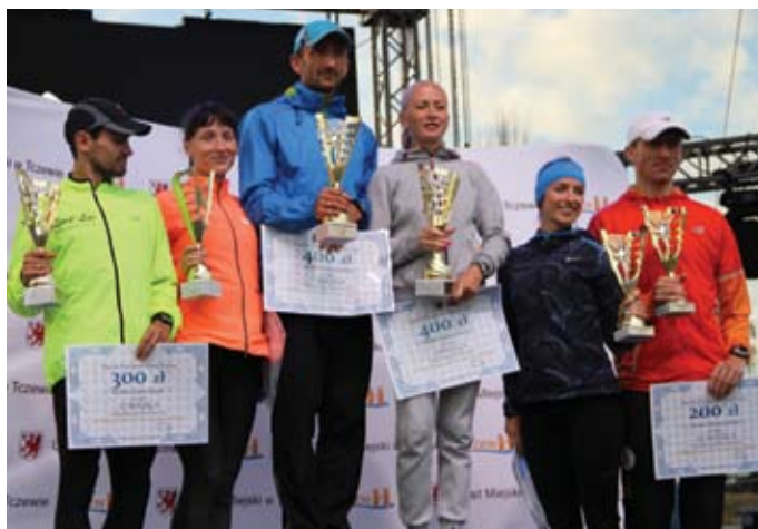
Nagrody dla najlepszych zawodników ufundował prezydent Tczewa

Na uczestników biegu czekały pakiety startowe z materiałami promocyjnymi miasta Tczewa, niepowtarzalną koszulką, natomiast po dobiegnięciu do mety czekał wyjątkowy medal w kształcie budynku Urzędu Miasta wraz z herbem Tczewa oraz woda ufundowana przez firmę Wojar w Tczewie. Najlepsi w kategoriach wiekowych otrzymali pamiątkowe puchary, zwycięscy w kategoriach generalnych kobiet i mężczyzn otrzymali nagrody finansowe ufundowane przez prezydenta Tczewa