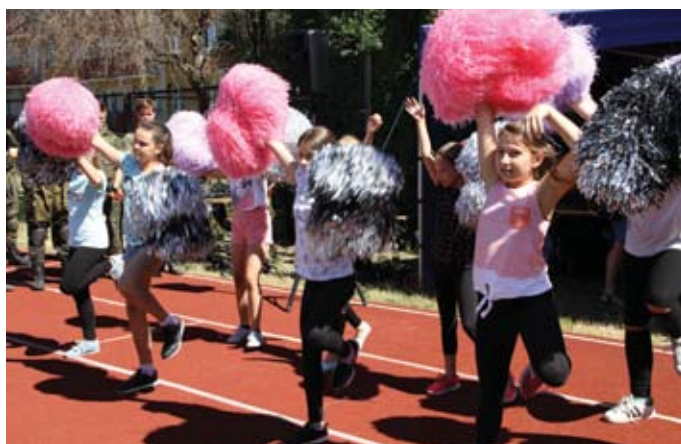
Wśród atrakcji był występ uczniów Szkoły Podstawowej nr 12