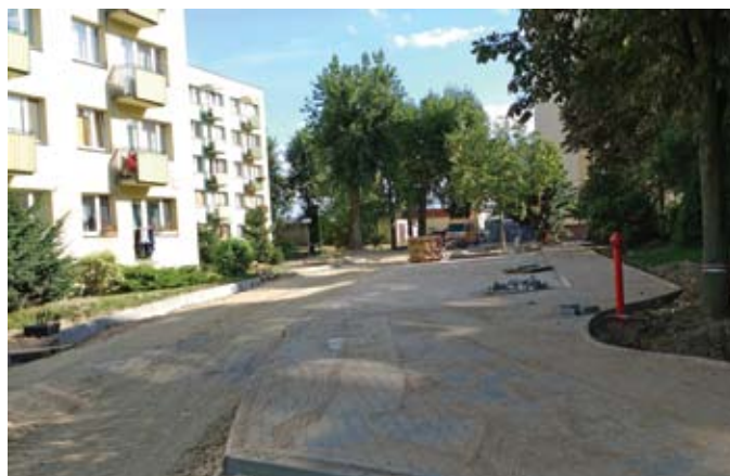
Remont ul. Orzeszkowej – termin realizacji to październik br.

Trwa zagospodarowywanie niecki czyżkowskiej, gdzie powstanie m.in. infrastruktura na potrzeby rolkarzy, deskorolkarzy, miłośników ekstremalnej