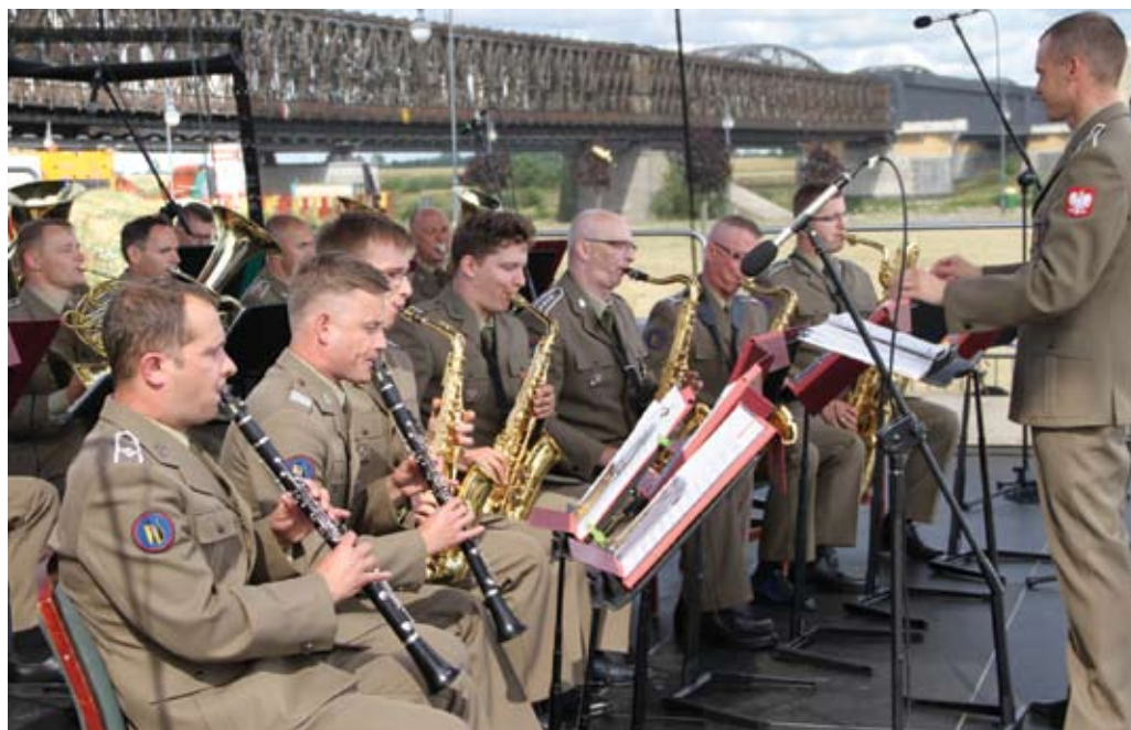
Wojskowa Orkiestra Dęta z Elbląga

Tczewskie Sobótki to także wiele innych atrakcji, a wśród nich koncerty Dawida Kwiatkowskiego oraz zespołu Braicia, występ kabaretu KaŁa-MaSz z udziałem wykonawców znanych z serialu „Ranczo”. Na Bulwarze Nadwiślańskim nie zabrakło atrakcji adresowanych