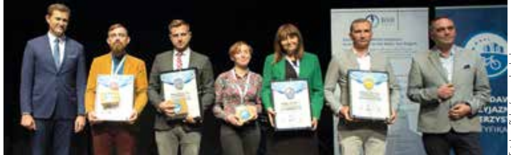
Certyfikat został wręczony podczas uroczystej gali wieńczącej X Kongres Mobilności Aktywnej w Gdańsku

O certyfikat „Pracodawca Przyjaznego Rowerzystom” mogą starać się firmy, które promują jazdę na rowerze wśród pracowników poprzez tworzenie własnej kultury