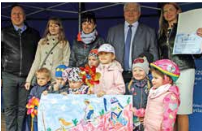
Laureaci konkursu z Akademii Przedszkolaka

Rozstrzygnięty został konkurs plastyczny dla przedszkoli i świetlic środowiskowych „Bezpiecznie jeżdżę rowerem”. Zwyciężyła „Akademia Przedszkolaka”.