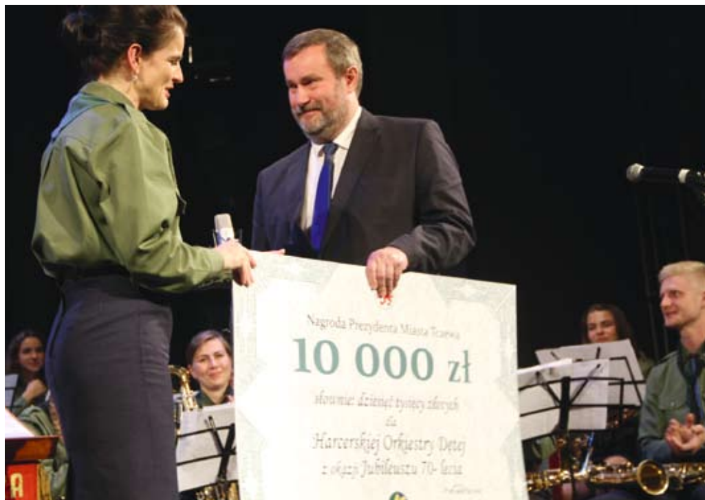
Prezydent Tczewa Mirosław Poblócki wręczył szefowej orkiestry symboliczny czek na 10 tys. zł

Po koncercie przyszedł czas na podziękowania, gratulacje, życzenia. Jednym z urodzinowych prezentów był wręczony przez prezydenta Mirosława Poblóckiego , czek na 10 tys. zł. Pieniądże zostaną przeznaczone na zakup nowych instrumentów.