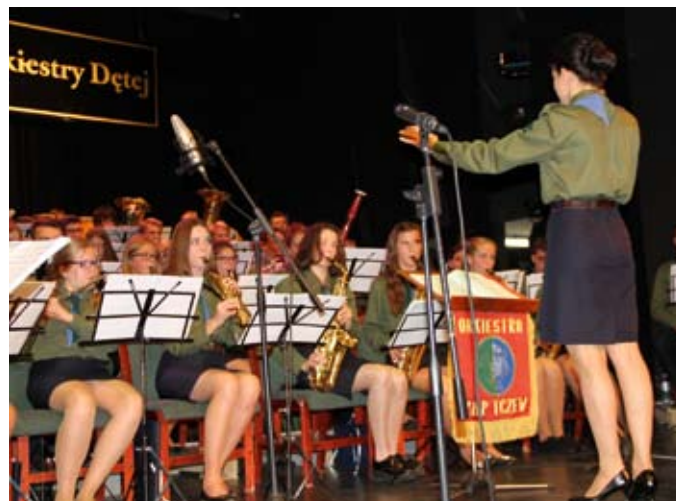
Orkiestra zaprezentowała m.in. utwory ze swojej nowej płyty „Kręć się, kręć...”