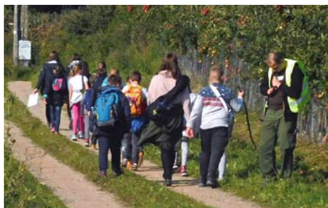
Tczewscy harcerze na szlaku

Tradycyjnie podczas wieczornego kominika zostały wyświetlone filmy drużyn ukazujące ich prężne działanie w minione wakacje. Zdjęcia wraz z muzyką przywołały wspomnienia obozów, wędrówek, ognisk oraz gier i zabaw. Ukazano również rejs naszych harcerzy żaglowcem „Pogoria” oraz wjazd wędrowników, czyli harcerzy w wieku 16-21 lat, na ogólnopolski zlot „Wędrownicza Watra”.