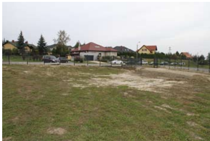
Na Os. Witosa wykonano ogrodzenie terenu, na którym niebawem znajdować się będzie świetlica i biblioteka