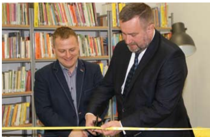
Symboliczne przecięcie wstęgi przez prezydenta Mirosława Półlockiego i dyrektora MBP Krzysztofa Korde