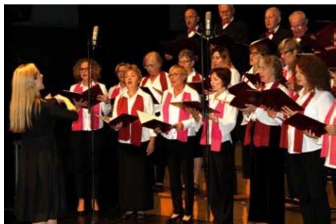
Dla studentów zaśpiewał Chór Passionata

Tczewski Uniwersytet Trzeciego Wieku w Tczewie prowadzi działalność pożytku publicznego. – Swoją działalność opieramy na symbolicznych składkach uiszczanych przez studentów oraz nieocenionej pomocy udzielanej nam ze środków budżetowych Gminy Miejskiej w Tczewie jak i środków z budżetu Powiatu Tczewskiego, w formie dofinansowań do zadań publicz-