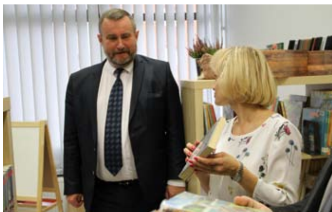
Biblioteka dziecięca przy ul. Wyzwolenia ma ponad tysiąc czytelników

Prezydent wraz z dyrektorem biblioteki przecięli wstęgę symbolicznie udostępniając bibliotekę po remoncie.