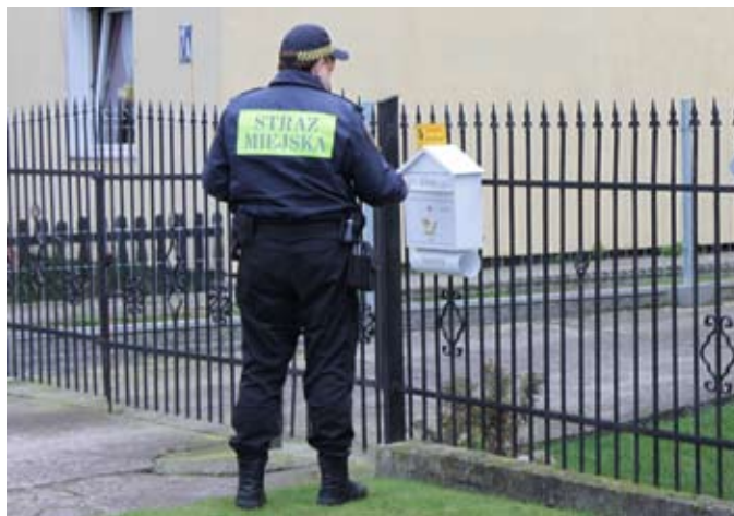
STRAŻ MIEJSKA W TCZEWIE