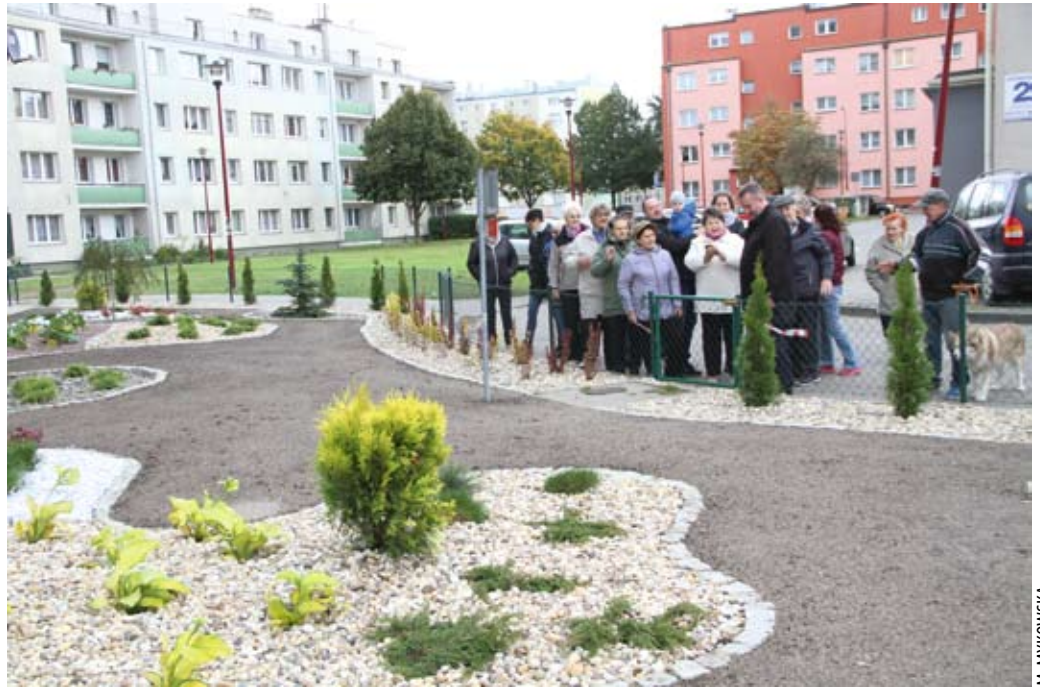
Mieszkańcy z dumą pokazywali prezydentowi nowe otoczenie swoich bloków