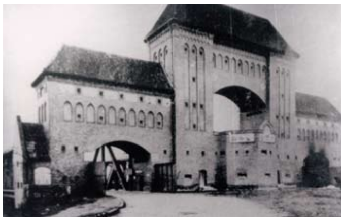
Wspólny portal dla obu mostów wybudowany po przedłużeniu obu mostów na początku XX wieku