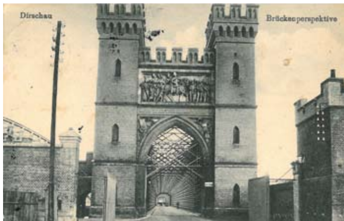
Portal zachodni obecnego mostu drogowego