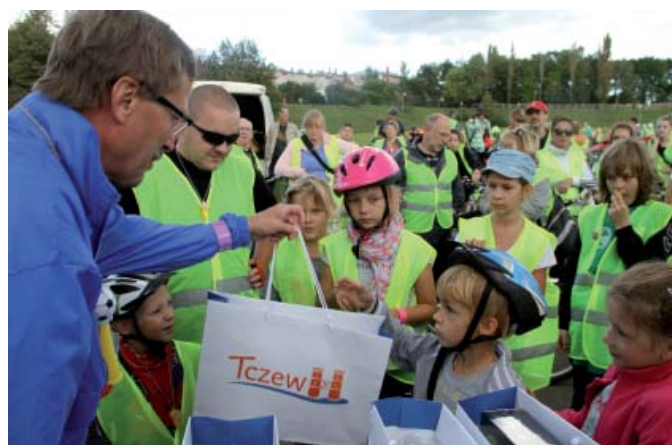
Na rowerzystów czekały nagrody i upominki

Na mecie zorganizowano konkurs z atrakcyjnymi na-