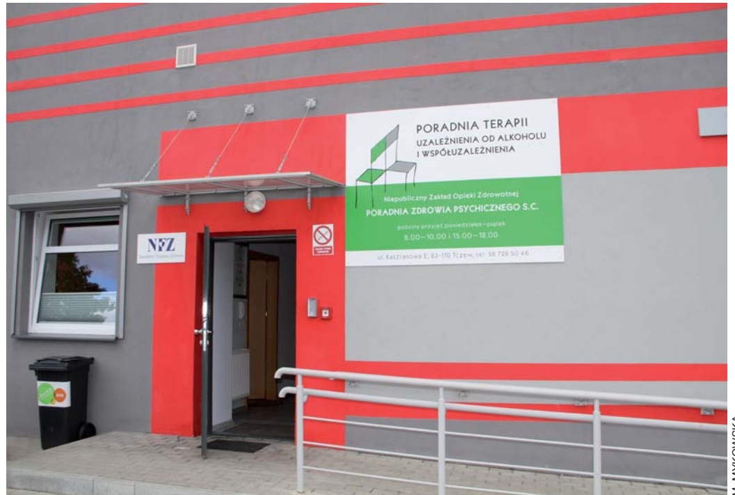
Poradnia mieści się przy ul. Kasztanowej 2

Poradnia dysponuje pełną ofertą dla uzależnionych i współuzależnionych, a terapeutom zależy, aby podzielić się swoimi umiejętnościami. – Jesteśmy przygotowani