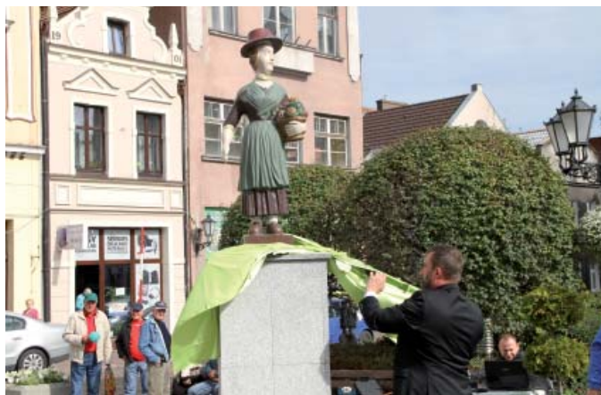
Prezydent Tczewa odsłonił figurkę jesieni...

Figurka stanęła na pl. Hallera, na postumencie i zastąpiła poprzednią porę roku – lato. Na przywitanie jesieni, 23 września, przybyli dzieci z Przedszkola Niepublicznego „Siedem darów” oraz podopieczni świetlic środowiskowych przy ul. Zamkowej i Kopernika, a także wielu innych mieszkańców Tczewa, nie tylko ci najmłodsi.