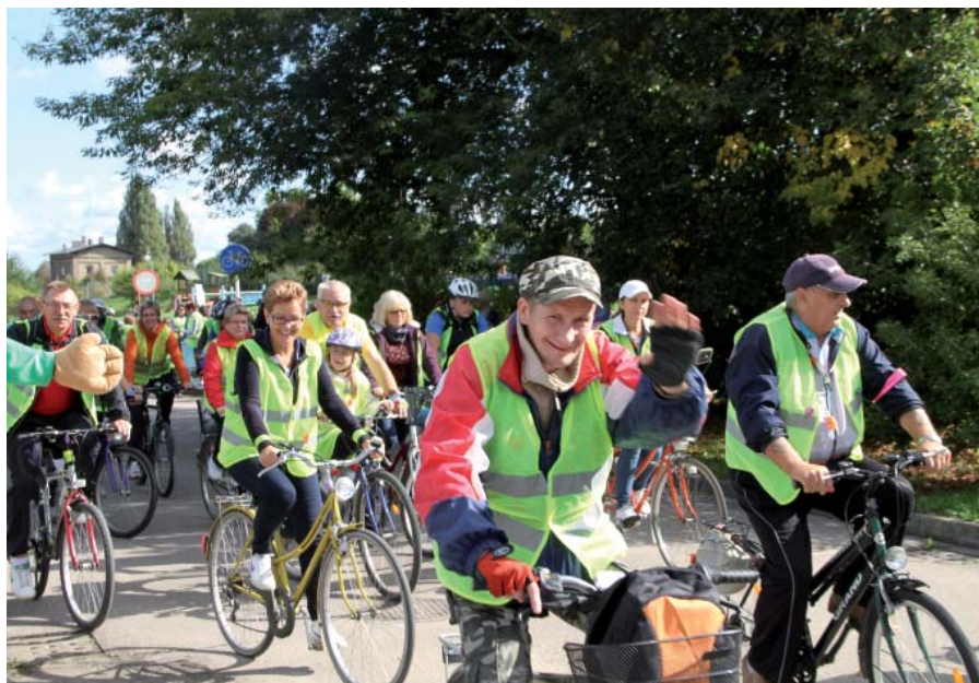
W przejeździe wzięło udział ok. 500 osób

Już po raz siódmy tczewianie zamienili samochody na rowery i wzięli udział w przejeździe rowerowym ulicami miasta w ramach Dnia bez samochodu. W sobotę 21 września z kanonki wystartowało ok. 500 osób, głównie młodzież szkolna, nie brakowało także maluchów pod opieką rodziców oraz seniorów. W przejeździe uczestniczyły również całe rodziny.