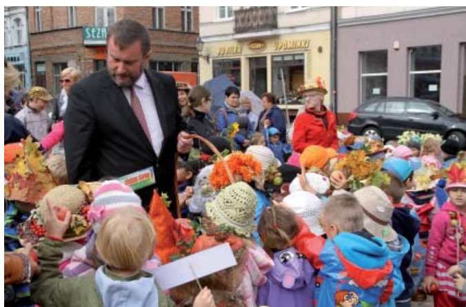
... i częstował najmłodszych słodkościami i owocami