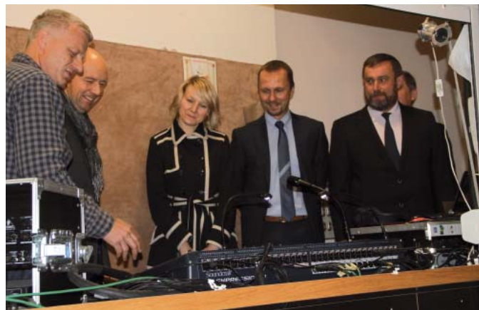
Sala widowiskowa otrzymała nowe nagłośnienie