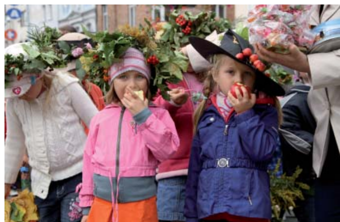
Wszystkim smakowały słodkie jabłka