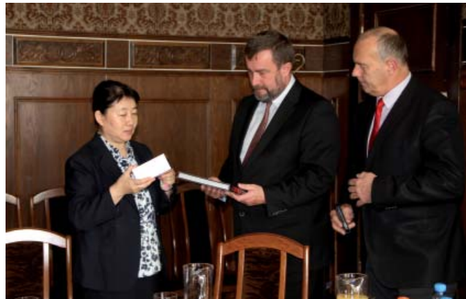
Gość i gospodarze wymienili drobne upominki

– Pomorskie jest bardzo ważnym partnerem Chin – stwierdziła pani konsul. – W 1985 r. województwo pomorskie nawiązało kontakty z Szanghajem. Współpraca jest bardzo owocna, w dziedzinie kulturalnej, gospodarczej, naukowej. Współpracują ze sobą m.in. biblioteki narodowe w Szanghaju i Gdańsku. W Gdyni działa Chipolbrok Chińsko-Polskie Towarzystwo Okrętowe S.A.