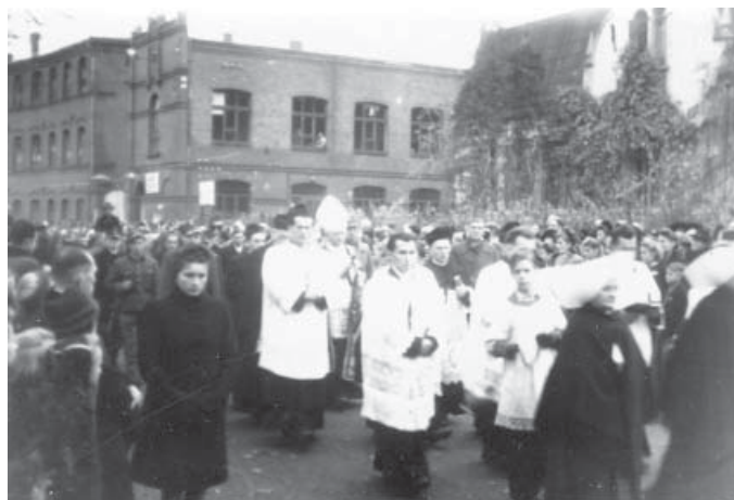
Uroczyste pochowanie ofiar drugiej wojny światowej ekshumowanych z terenu koszar, 1945 r. (zdjęcie powyżej i poniżej)