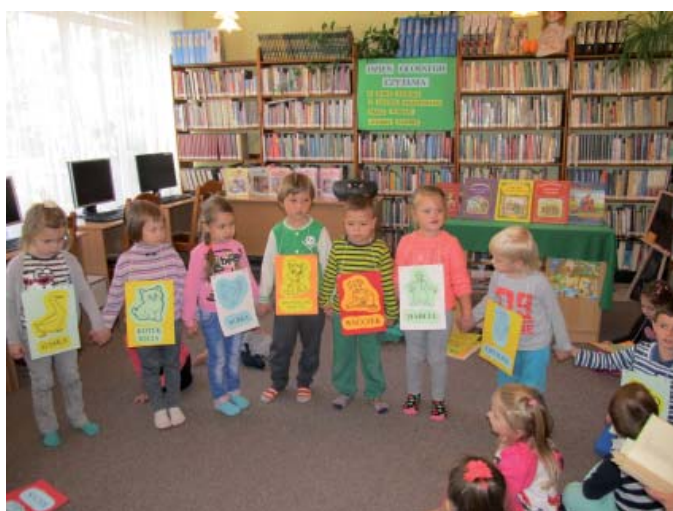
Zajęcia czytelnicze w Filii nr 2 na os. Czyżykowo

W bibliotekach dziecięcych na Czyżykowie, Suchostrzygach i os. Staszica odbyły się spotkania dla dzieci, podczas których przybliżano jego twórczość. Program zajęć był interesujący i urozmaicony. Wstęp do czytanej wiersza stanowiły różne zabawy ruchowe, miniteatryki, ćwiczenia plastyczne. Dzieci zaskakiwały spontanicznością i pomysłowością, czy to przy udawaniu pana Hilarego czy podczas snucia swoich marzeń. Śmiechu było co niemiara w czasie przeciągania liny z obrazkiem rzepki, a przy rozpoznawaniu nazw warzyw z koszyka jeden