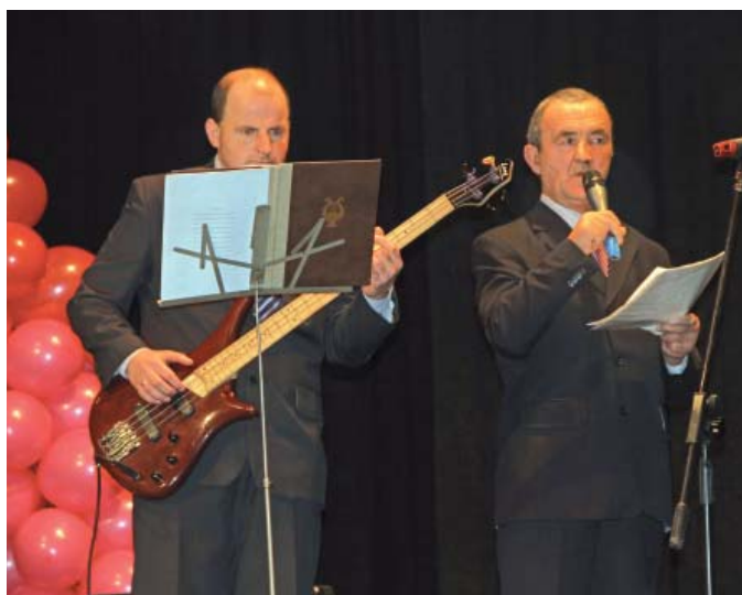
Na scenie wystąpili m.in. podopieczni DPS w Damaszcze

Ze względu na jubileuszowy charakter festynu odbył się on wyjątkowo w sali widowiskowej Centrum Kultury i Sztuki, a