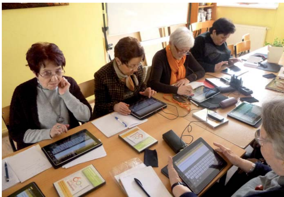
Seniorzy chętnie korzystają z zajęć edukacyjnych