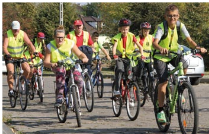
Rowerzyści przejechali ok. 7 km