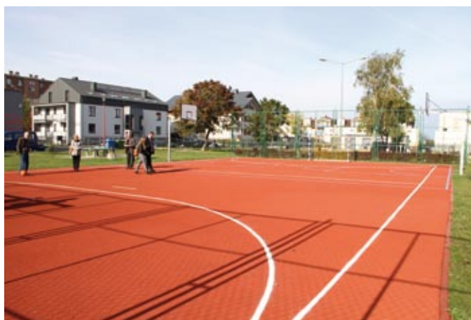
Nowe boisko przy ul. Kasztanowej jest dostępne dla wszystkich mieszkańców.

Mieszkańcy Os. Witosa okazali się bardzo aktywni w tegorocznej edycji budżetu obywatelskiego – na ich osiedlu powstały aż dwa place zabaw i dwie siłownie pod chmurką – na skwerze 750-lecia