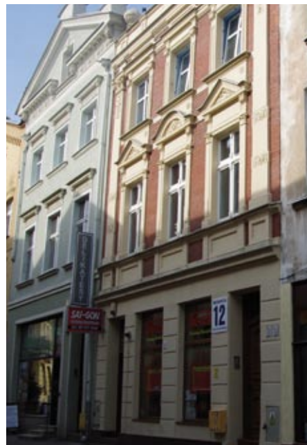
ul. Mickiewicza 12