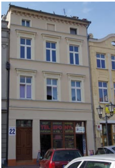
pl. Hallera 22