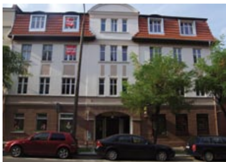
ul. Sobieskiego 40