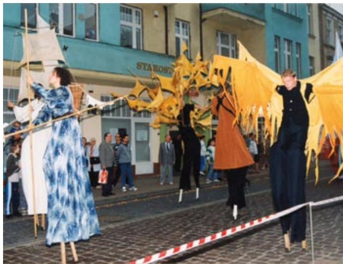
Podczas 1. edycji „Zdarzeń”