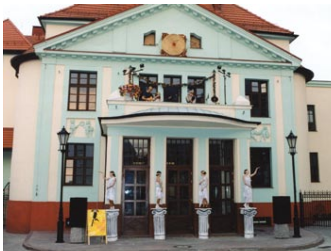
„Zdarzenia”, 2002 r. (zdjęcie powyżej i poniżej)