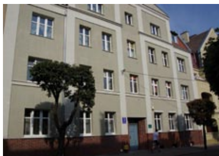
ul. Paderewskiego 7