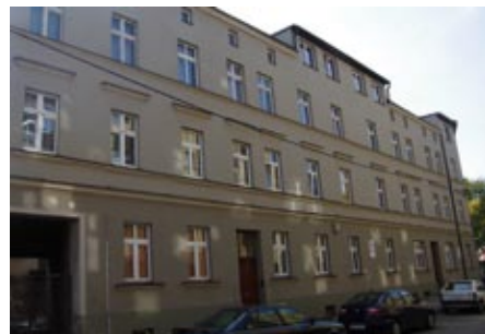
ul. Królowej Jadwigi 7