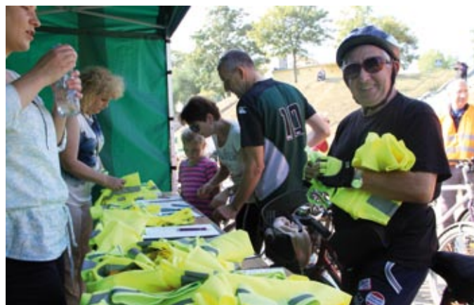
Wszyscy uczestnicy przejazdu otrzymali kamizelki odbłaskowe