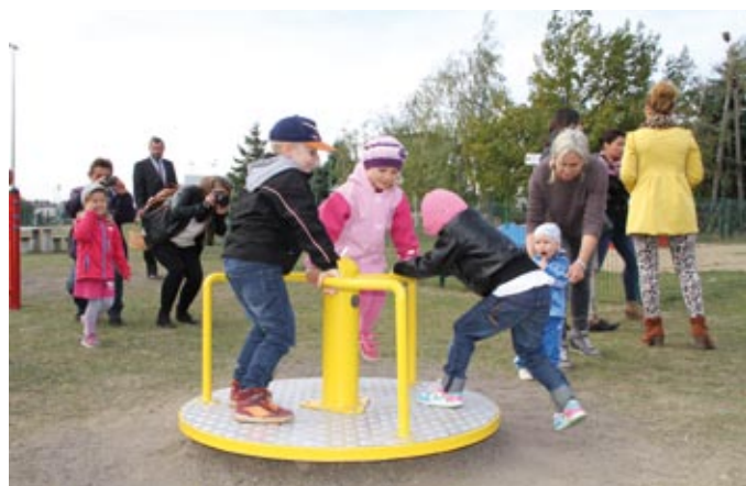
Na Skwerze 750-lecia Miasta Tczewa powstał jeden z pięciu „obywatelskich placów zabaw