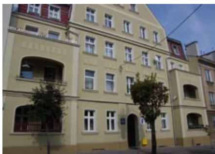
ul. Paderewskiego 8