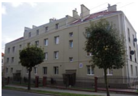
ul. Paderewskiego 22