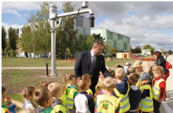
Najmłodszym spodobała się „kolejowa” droga do szkoły i przedszkola

Po przebudowie miejsce to nawiązuje do kolejowych tradycji miasta. Oprócz nowego chodnika, pojawiło się dużo więcej zieleni – drzew, kwitnących krzewów i bylin charakterystycznych dla starych torowisk. Szlak kolejowy symbolizują drewniane belki imitujące podkłady torowe. Pomiędzy nimi pojawiły się miejsca wypoczynku z ławkami stylizowanymi na dawne ławki dworcowe. Charakterystycznymi elementami są semafor i żuraw wodny.