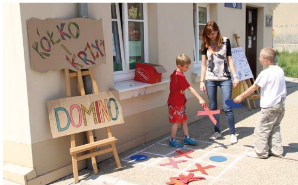
Świetlica na Zamkowej to miejsce, gdzie dzieci znajdują opiekę i zajęcia edukacyjne

20 tczewskich rodzin weźmie udział w programie „Bezpieczne dzieciństwo”. Zajęcia ruszają w październiku.