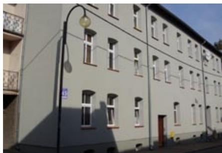
ul. Wąska 49