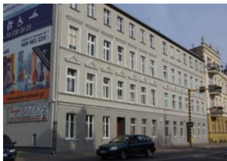
ul. Wojska Polskiego 33