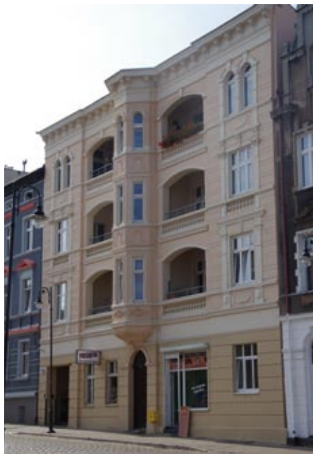
ul. Kościuszki 13

Wszystkie zgłoszone elewacje zostały nagrodzone, a wspólnoty mieszkaniowe otrzymały nagrody pieniężne od 2 tys. do 11 tys. zł: