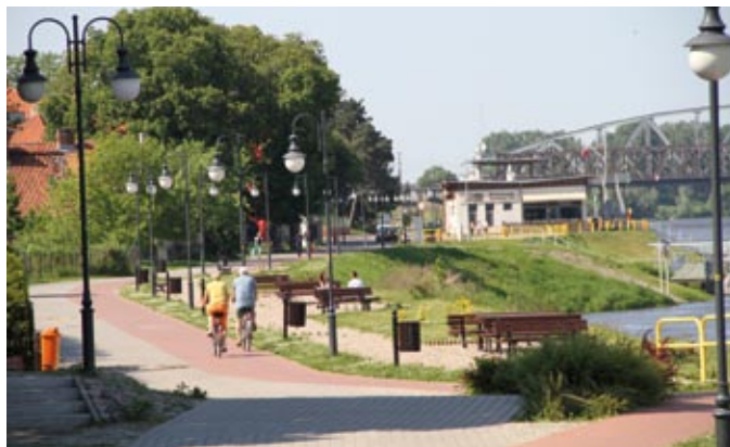
Ścieżka przyrodniczo-edukacyjna to uczęszczane miejsce spacerów tczewian

NAGRODA GŁÓWNA została przyznana 4 miastom za zrealizowane projekty w 3 kategoriach. W kategorii „Zieleń w mieście” – laureatami konkursu są dwa miasta: TCZEW i Chojnice , które otrzymują nagrody za realizację projektów pt.: „ Ścieżka przyrodniczo-dydaktyczna w Tczewie ” oraz „ Rewitalizacja Parku 1000-lecia w Chojnicach ”. Pozosta-