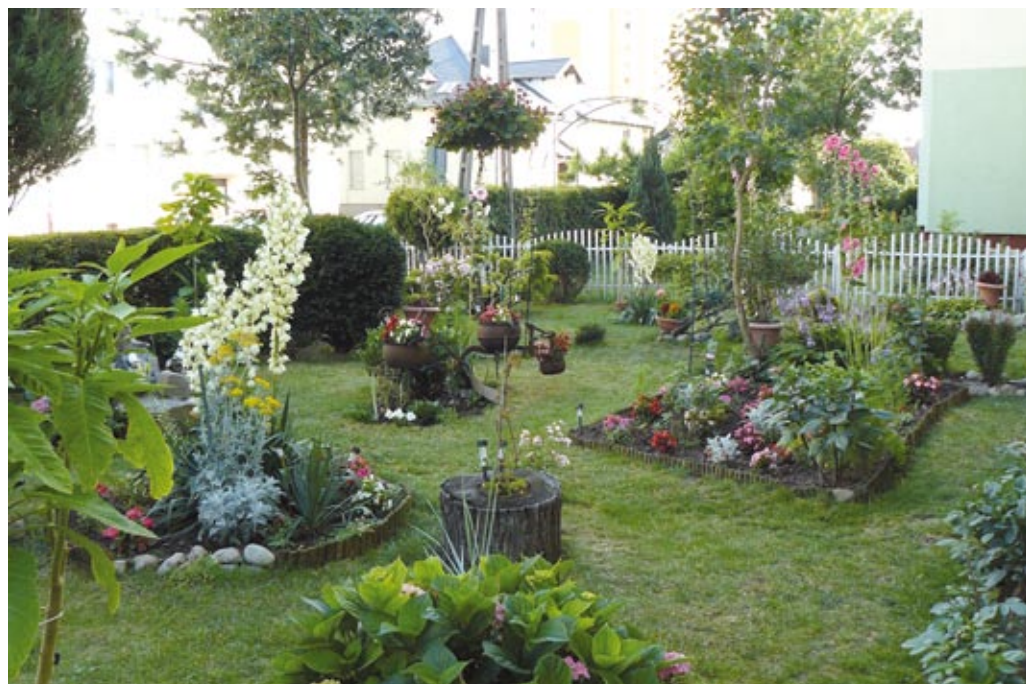
Najładniejsze otoczenie – przy ul. Armii Krajowej 8A