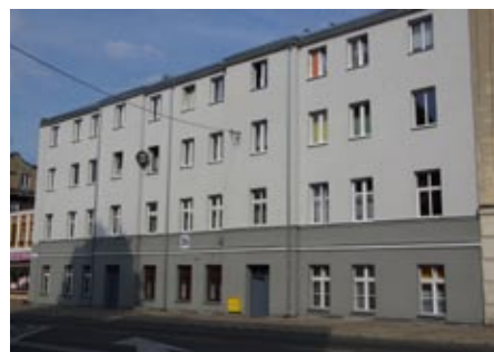
ul. Woj. Polskiego 24