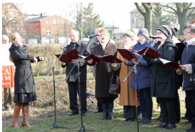
Uroczystości uświetnił Chór Passionata