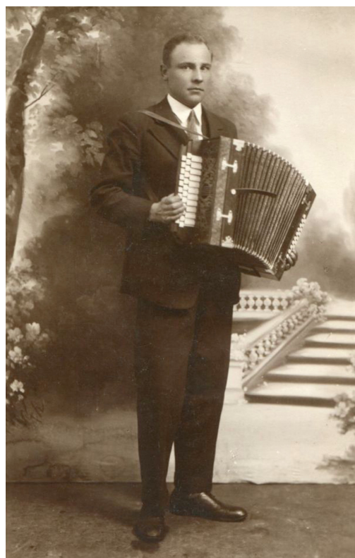
U fotografa, 1933 r. Zbiory P. Nowaka