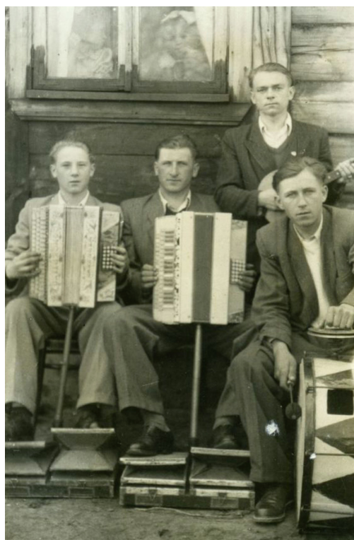
Harmonie pedałowe były produkowane w Polsce od początku XX w. Zbiory P. Nowaka

WYSTAWA „AKORDEON W POLSCE I NA ŚWIECIE”