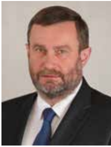
MIROŚLAW POBŁOCKI prezydent Tczewa: Unia zmieniła Tczew

– Gdy 15 lat temu Polska wstępowała do Unii Europejskiej, chyba niewiele osób wyobrażało sobie, jak bardzo wpłynie to na nasze miasto – na jego wygląd, funkcjonowanie, na komfort życia mieszkańców. Zmian, które nastąpiły w tym czasie nie można nie zauważać.