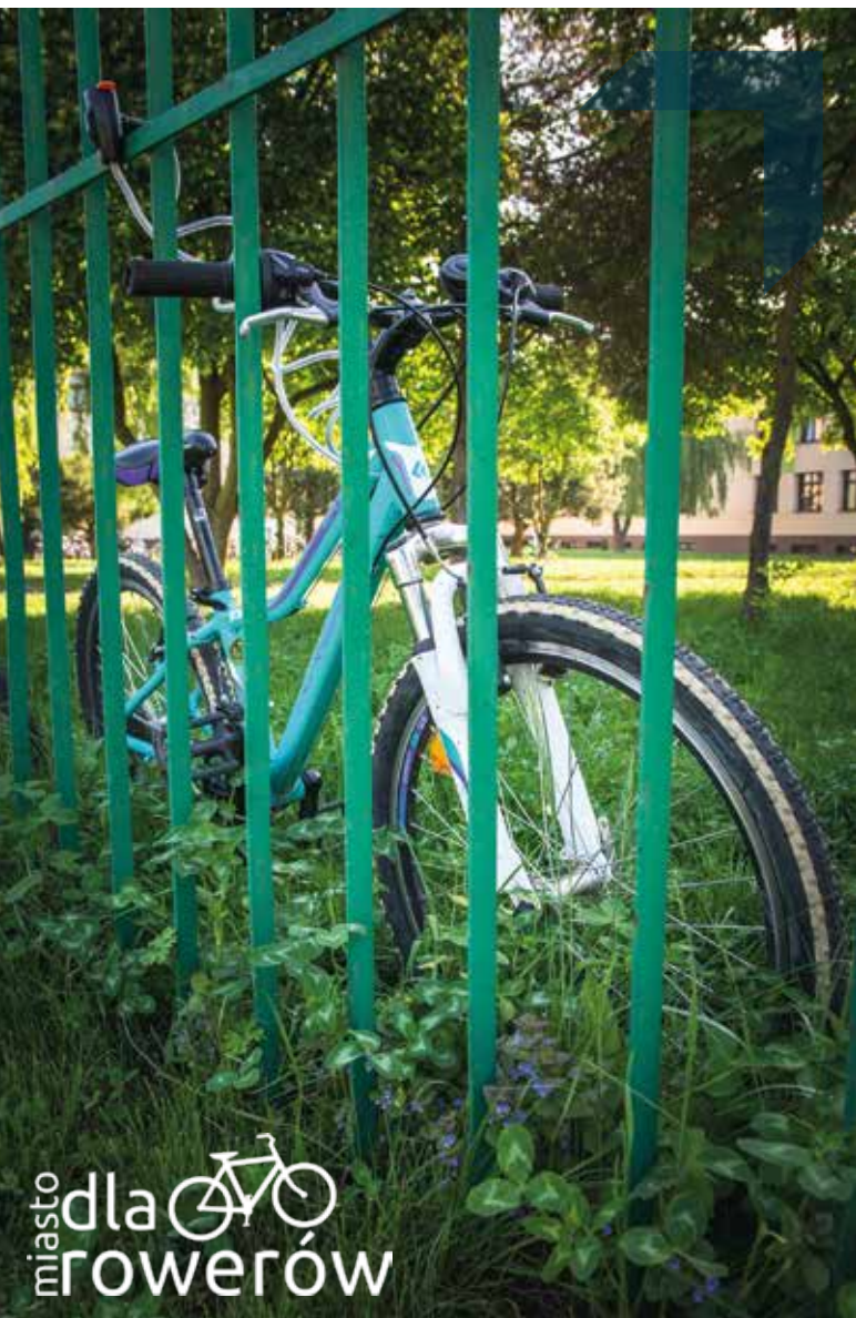
Fot. Katarzyna Gąpska