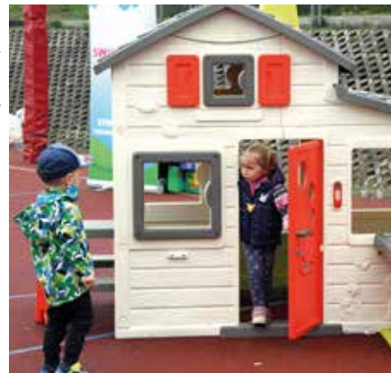
„Strefa malucha” kryła wiele atrakcji dla najmłodszych

stawku. Dzieci chętnie korzystały z możliwości konnej przejażdżki, z gier, zabaw i konkursów.