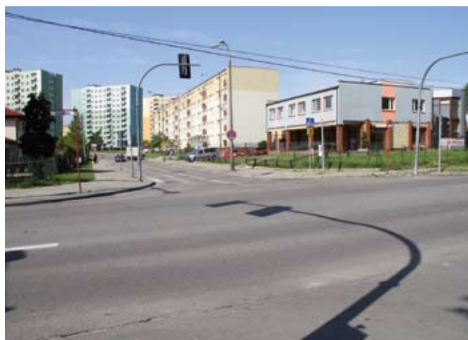
Wkrótce rozpocznie się remont ul. Jedności Narodu i Gdańskiej

Najniższą cenę zaoferowała firma Eurovia Polska Spółka Akcyjna z Kobierzyc, która zaproponowała wykonanie zadania za 1 290 748,62 zł, w terminie do końca września br.