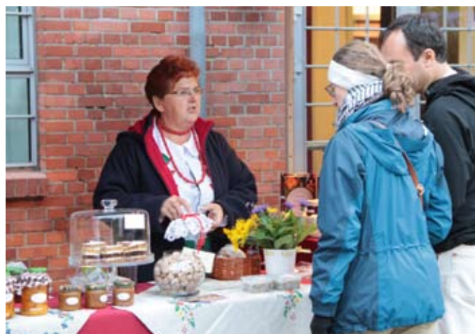
Wystawcy oferowali tradycyjne przysmaki kuchni kociewskiej...