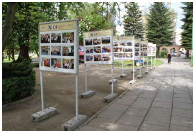
W Parku Kopernika można obejrzeć wystawę poświęconą jubileuszowi TUTW

11 maja odbyły się jubileuszowe obchody Tczewskiego Uniwersy-