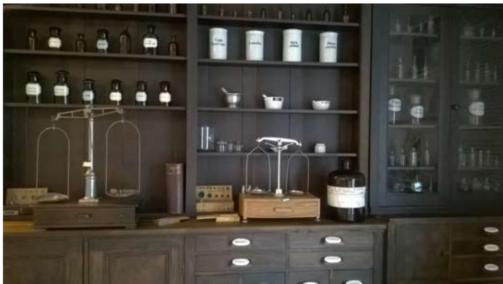
Ekspozycja w Fabryce Sztuk