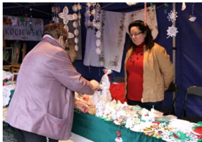
... i przepiękne wyroby rękodzielnicze