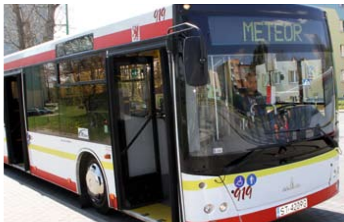
Jeszcze w tym roku pojawi się możliwość doładowywania karty miejskiej przez internet