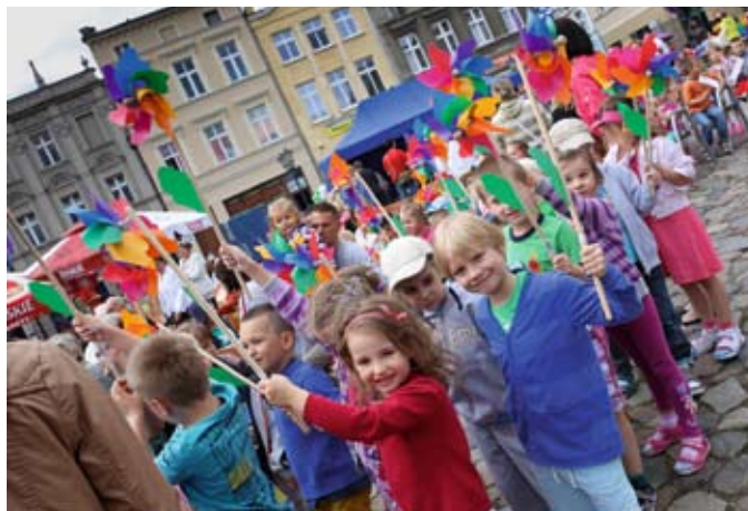
Co roku Święto Ulicy gromadzi wielu mieszkańców miasta