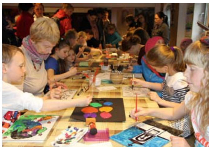
Dzieci nie trzeba było namawiać do udziału w zajęciach plastycznych

Publiczności przypadł również do gustu występ Laboratorium Pieśni . Ten trójmiejski zespół pieśniarek wykonał w sposób tradycyjny – wielogłosowo – pieśni ukraińskie, rosyjskie, bałkańskie i polskie.