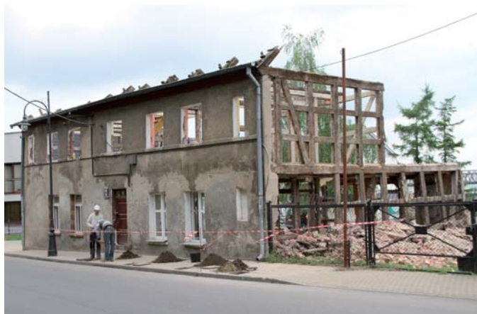
Budynek przy ul. Zamkowej 11

Oba budynki znajdują się w strefie ochrony konserwatorskiej. Oba również remontuje ten sam wykonawca – wyłoniona w przetargu Firma Usługowo-Handlowa LEMAR ze Skarszew.