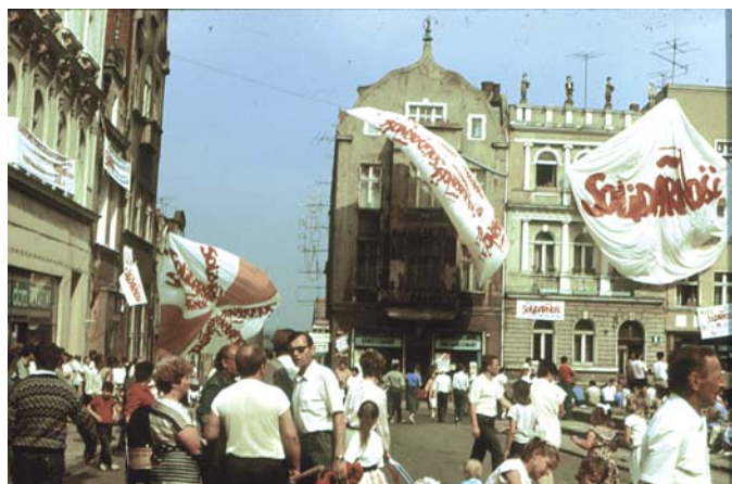
Plac Wolności udekorowany był transparentami Solidarności

Jednym z przełomowych wydarzeń w dziejach powojennej Polski były obrady Okrągłego Stołu (06.02-05.04.1989 r.), które zapoczątkowały pokojowe przemiany ku demokracji i gospodarce wolnorynkowej. Ich konsekwencją były częściowo wolne wybory do parlamentu, które opierały się na bezprecedensowej ordynacji wyborczej do sejmiku, na mocy której 35% miejsc w izbie niższej parlamentu miała stanowić przedmiot wolnej konkurencji, a pozostałe 65% zagwarantowano kandydatom strony rządzącej. Natomiast wybory do senatu miały być całkowicie wolne. Termin pierwszej tury wyborów ustalono na 4 czerwca 1989 r. Za prowadzenie kampanii wyborczej ze strony opozycji odpowiedzialny był Komitet Obywatelski przy przewodniczącym „Solidarności”, mający swe terenowe odpowiedniki. W programie wyborczym uznano za podstawowy cel suwerenność narodu i niepodległość kraju oraz naprawę Rzeczypospolitej. Prowadzono również szeroko zakrojoną kampanię wyborczą. Zapewne wielu tczewian pamięta plakaty z hasłami: Musimy wygrać, Głosuj na Solidarność, Nie śpij, bo Cię przegłosują... Istną furorę zrobił plakat wydrukowany przez włoskich związkowców przedstawiający G. Coopera w scenie z popularnego westernu „W samo południe”. Samotny szeryf miał przypięty znaczek „Solidarność”. Kandydaci opozycyjni fotografowali się z Lechem Wałęsą, a zdjęcia te jednoznacznie utożsa-