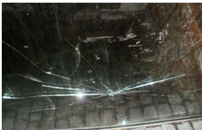
MATERIAŁY STRAŻY MIEJSKIEJ

Duża część Starego Miasta objęta jest monitoringiem, tym roku przybyło kolejnych 16 kamer bardzo dobrej jakości. Kamery te obejmują nowe trasy spacerowe. Zapisy z