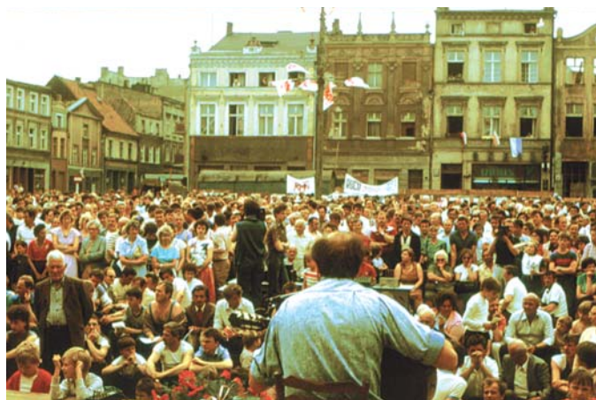
Na wiec przybyły tłumy tczewian

miały kandydata na plakatach wyborczych z tzw. drużyną Wałęsy . Jednym z elementów kampanii wyborczej były spotkania z wyborcami i wiece.