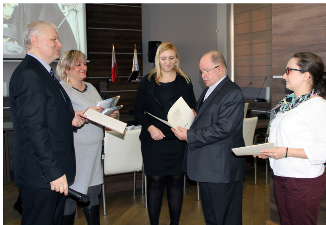
Podziękowania trafiły do około 60 osób.