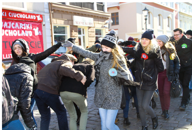
Poloneza tańczyło blisko 400 maturzystów

Inicjatorem imprezy było Uniwersyteckie Katolickie Liceum Ogólnokształcące, a wydarzenie odbyło się przy wsparciu samorządów miasta i powiatu. W polonezie wzięło udział około 400 uczniów. Maturzyści wyruszyli z parkingu przy ul. Ogrodowej wzbudzając ogromne zainteresowanie przechodniów. Tanecznym krokiem przeszli ul. Jarosława Dąbrowskiego, rozdzielili się na ul.