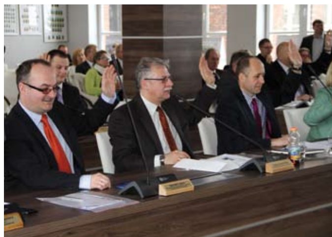
Po raz pierwszy radni głosowali w nowej sali obrad, przy ul. 30 Stycznia 1

Program realizuje Miejski Ośrodek Pomocy Społecznej w Tczewie