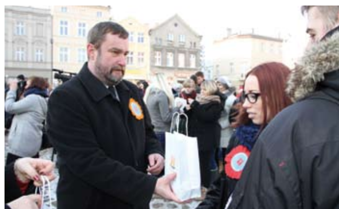
Prezydent Tczewa wręczył maturzystom magiczne długopisy