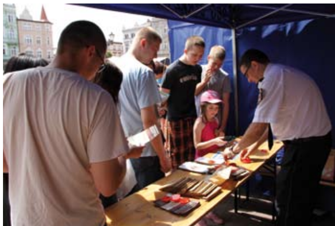
Podczas imprez plenerowych (na zdjęciu Pchli Targ) stoisko Straży Miejskiej cieszy się dużym zainteresowaniem

rodzaju pracach porządkowych na rzecz miasta. Średnio na terenie Tczewa pracowało 4 skazanych, przez 207 dni.