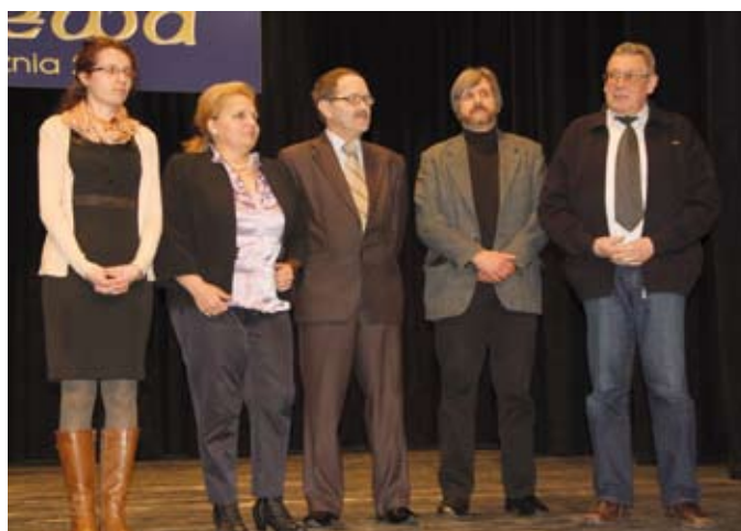
Laureaci wyróżnienia „Pierścień Mechtyldy”

Współpraca Tczewa i starogardzkiego Aresztu Sledczego trwa od 2010 roku. W tym czasie osadzeni wykonywali prace po-