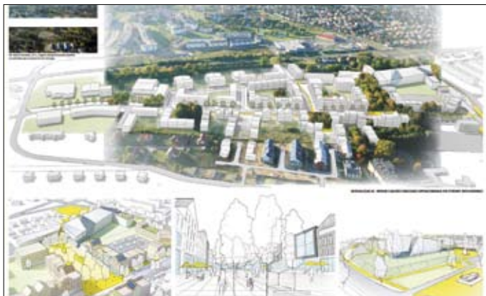
Zwycięska koncepcja pracowni z Gliwic