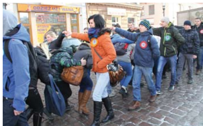
Poloneza tańczyli uczniowie wszystkich szkół ponadgimnazjalnych w Tczewie