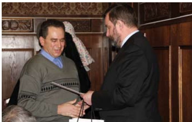
Prezydent Tczewa przekazał nagrody zwycięzcom konkursu