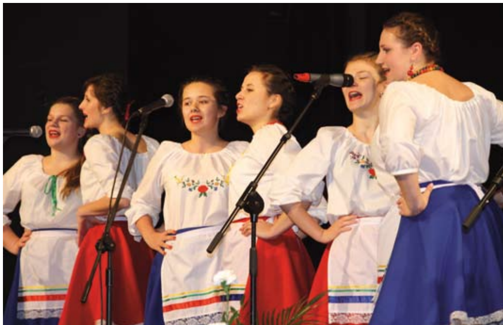
Zespół młodzieżowy „Frantówka” rozpoczął uroczystą sesję Rady Miejskiej

W ubiegłym roku m.in. zakończyliśmy realizację projektu rewitalizacji Starego Miasta – budowę