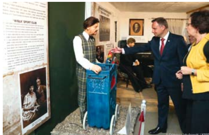
Prezydent Polski Andrzej Duda objął honorowym patronatem wystawę „20 lat wolności. Tczew 1920-1939”. Uroczyste zwiedzanie ekspozycji 1.09.2018 r.