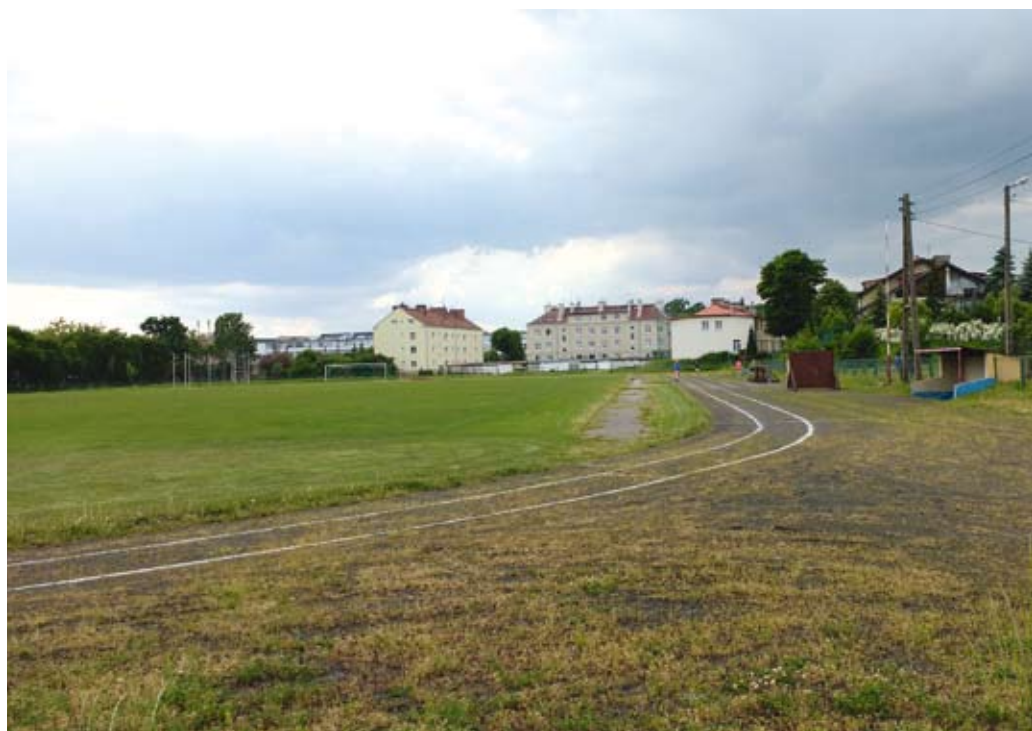
M. MYKOWSKA (2)

Już w przyszłym roku lekkoatleci będą mogli trenować na nowym obiekcie