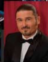
Volodymyr Ordynsky tenor