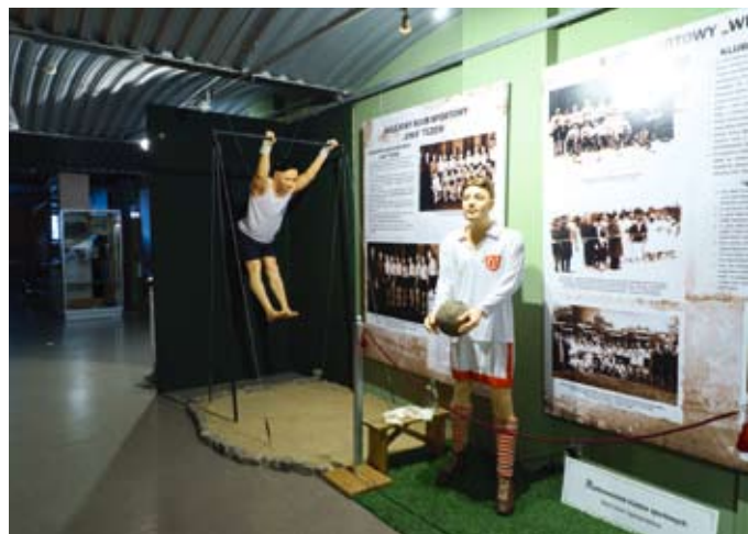
Co nieco o życiu sportowym Tczewa