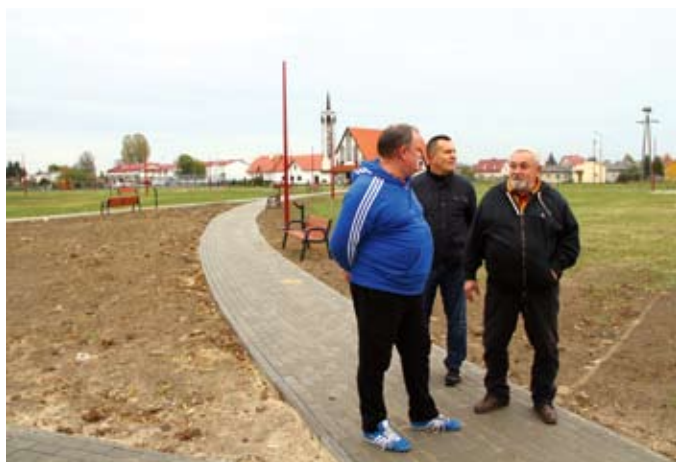
Mieszkańcy Os. Staszica cieszą się z nowych miejsc do rekreacji