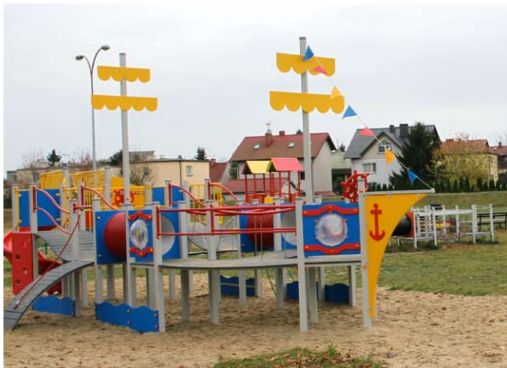
Niecka czyżykowska będzie wkrótce miejsce aktywności i relaksu