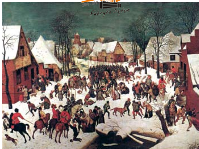
Pieter Brueghel, Rzeź niewiniątek, oryginał: Kunsthistorisches Museum, Wiedeń

Dorobek Brueghla obejmuje około „40 obrazów, niewiele więcej rysunków i dwa razy tyle rycin cudzego autorstwa, do tego kil-