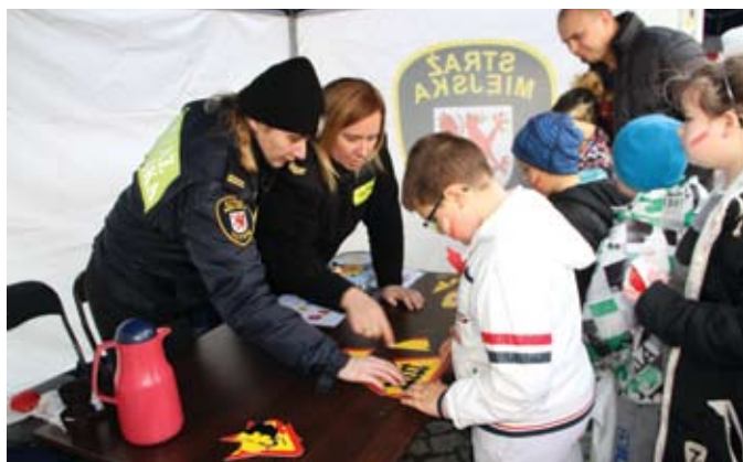
Stoisko Straży Miejskiej