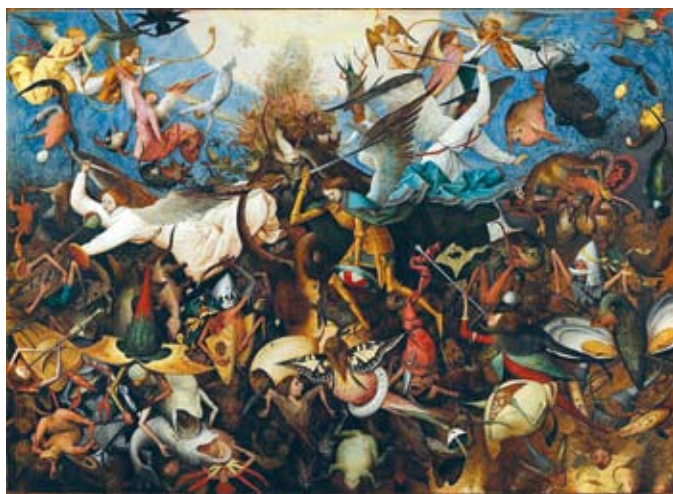
Pieter Brueghel, Upadek zbuntowanych aniołów, oryginał: Musées Royaux des Beaux-Arts, Bruksela

WYSTAWA „PIETER I JAN BRUEGHEL” do 31 grudnia 2017 r. Fabryka Sztuk, ul. 30 Stycznia 4 Wstęp bezpłatny!