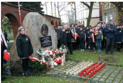
Kwiaty i znicze przy obelisku marsz. J. Piłsudskiego