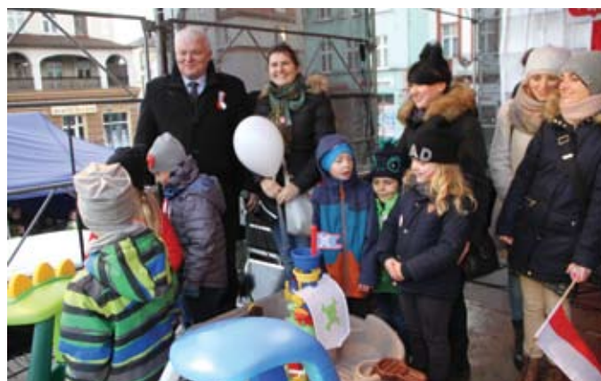
Na zwycięzców konkursu plastycznego czekały atrakcyjne nagrody