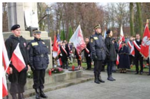
Uroczystości patriotyczne na cmentarzu „starym”