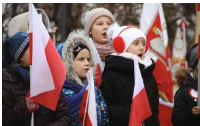
Uczniowie SP 10 przygotowali krótki program artystyczny

Po części patriotyczno-religijnej, rozpoczął się festyn na pl. Hallera. Nie zabrakło pieśni patriotycznych, wojskowych, ale też innych melodii, który podkreślały radość Święta Niepodległości. Wystąpiły chóry „Passionata” oraz „Passionat-