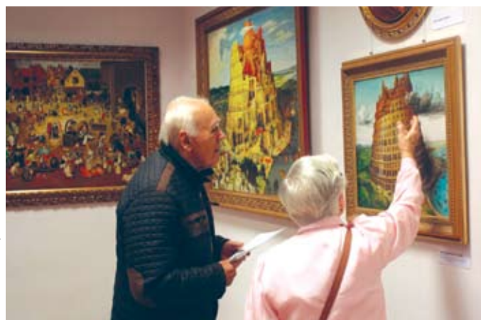
Zwiedzający wystawę kopii dzieł Brueghłów