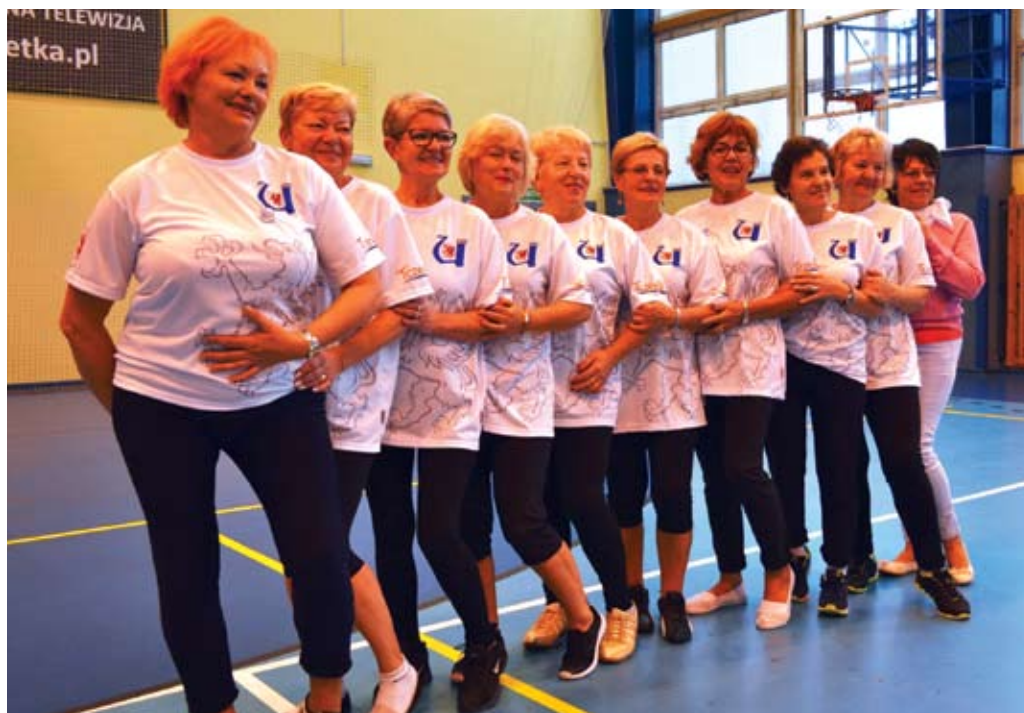
Tczewska drużyna – zwała i gotowa