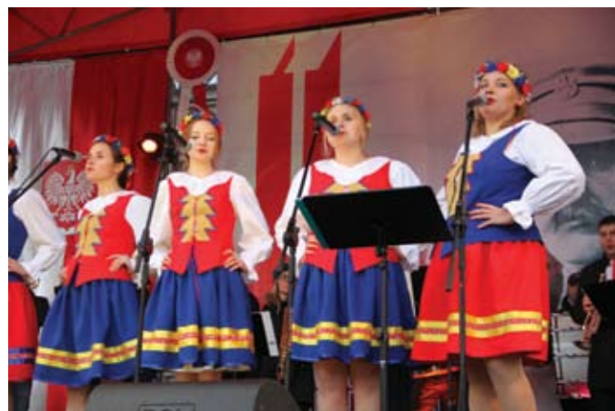
... oraz zespół folklorystyczny Frantówka