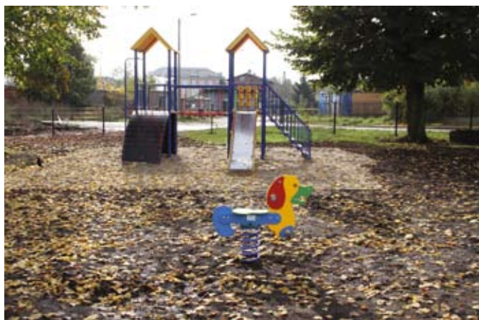
Plac zabaw przy ul. Łąkowej

Inwestycja kosztowała ok. 150 tys. zł i została wykonana w ramach projektu rewitalizacji Starego Miasta i Zatorza w Tczewie.