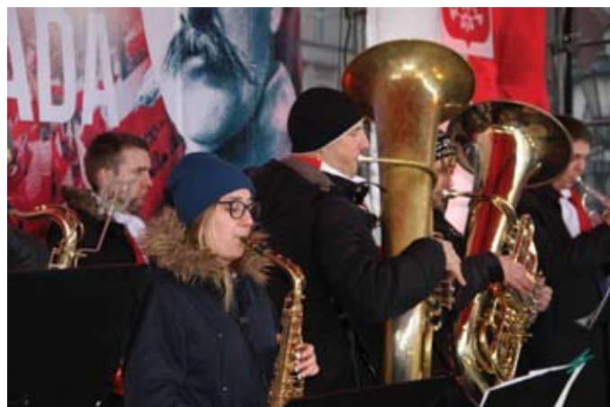
Na scenie wystąpiła m.in. orkiestra dęta Torpeda