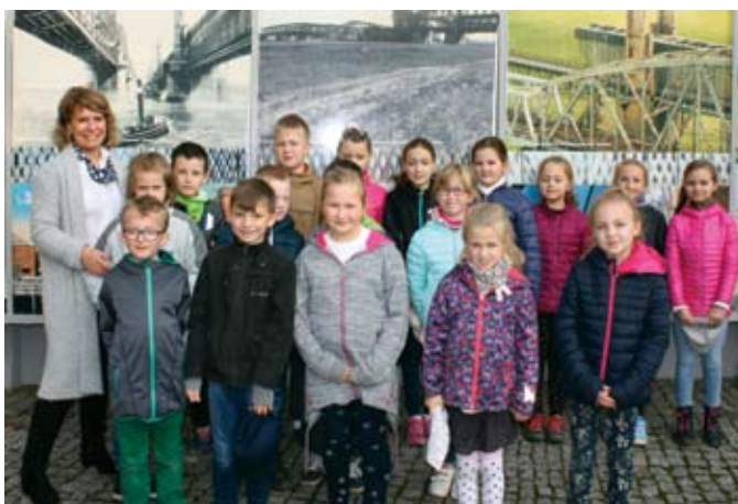
Pamiątkowe zdjęcie kl. 3 b SP 5 w Tczewie

Wnawiązaniu do 160. urodzin Mostu Tczewskiego w Fabryce Sztuk odbywały się zajęcia, których uczestnicy malowali na szkle most tczewski, poznawali jego historię, przy okazji podziwiając makietę mostu i wystawę zdjęć, pisali życzenia dla tczewskiego zabytku oraz brali udział w zabawie „Budujemy most”. Otrzymali także pamiątkowe przypinki ze zdjęciem mostu tczewskiego. W zajęciach uczestniczyło około 150 osób: uczniowie: Szkoły Podstawowej nr 5, nr 10, nr 11 i Niepublicznej Szkoły Podstawowej w Tczewie oraz wychowankowie Świetlicy Środowiskowej „Oaza”. Warsztaty zorganizowali: Fabryka Sztuk