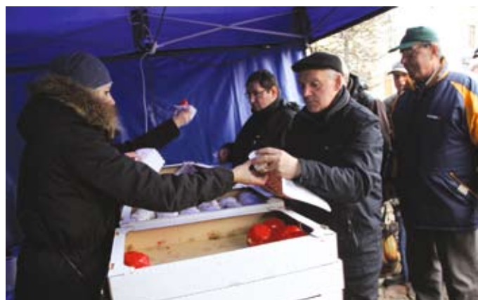
Pączki z białą i czerwoną polewą smakowały tczewianom