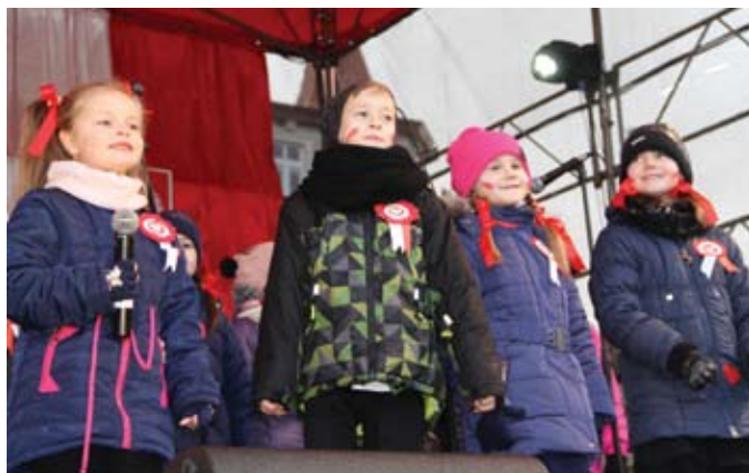
Występ dziecięcego chóru Passionatka