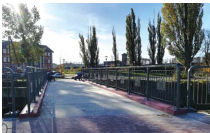
przetargu, spółka ROKA Budownictwo ze Starogardu Gd. Koszt zadania to 606 tys. zł.

Inwestycja wykonana została w ramach projektu rewitalizacji Starego Miasta i Zatorza. Wykonawcą jest wyłoniona w drodze