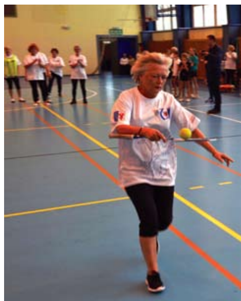
Konkurencje sportowe wymagały sporo wysiłku