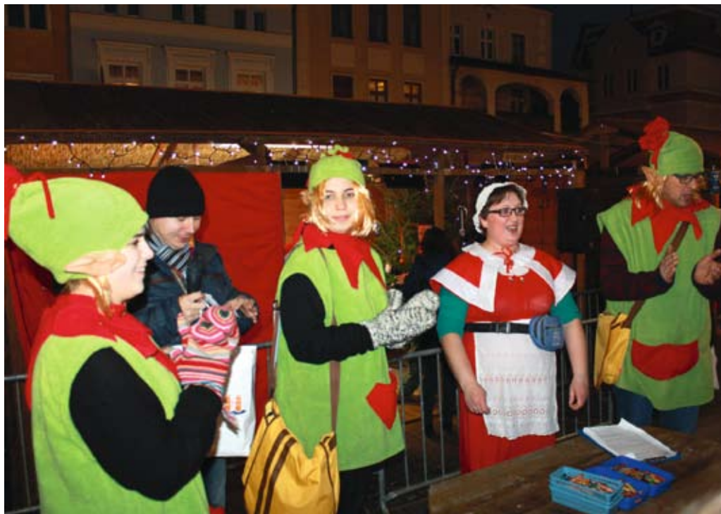
Trzeci Jarmark Bożonarodzeniowy w Tczewie, 2015 r. (obie fotografie)

W Tczewie, w ostatni przedświąteczny weekend, na placu Hallera organizowany jest Jarmark Bożonarodzeniowy. Na klientów czekają swojskie wędliny, sery, miody, chleb litewski, oscypki, domowe pierogi, zupa grzybowa, grzane wino, pierniki i inne słodkie wypieki oraz mobilna kawiarenka, a ponadto żywe choinki i cała gama wyrobów rękodzielniczych, począwszy