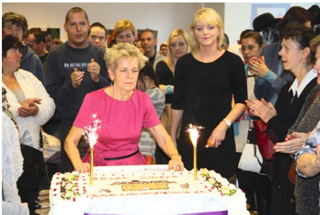
Zwieńczeniem wernisazu był wielki jubileuszowy tort

Goście wernisazu wspólnie prześledzili to, co działo się w ciągu minionych 20 lat – wyjazdy, podróże, jasełka, spotkania wigilijne, turnusy rehabilitacyjne, sadzenie pierwszych drzewek i urządzenie ogrodu, zajęcia klubowe, spotkania z seniorami. Podopieczni ośrodka wzięli udział w 278 konkursach, zorganizowali 97 imprez, uczestniczyli w 58 projektach. Naj-