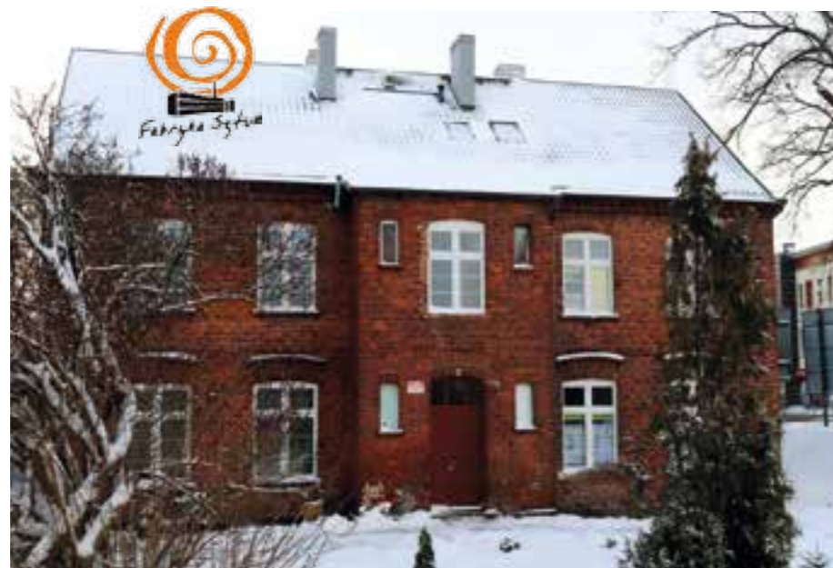
Tutaj spotykali się członkowie „Zapory”. Tczew, ul. Gdańska 40, fot. współczesna