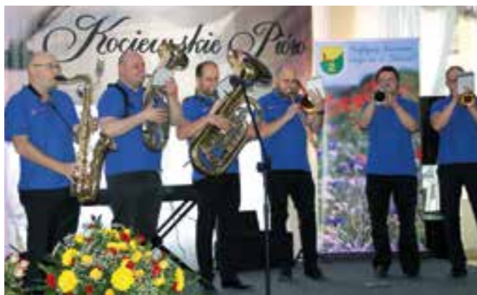
Tczewska Torpeda zdobyła nagrodę w kategorii animacja kultury zbiorowo

ży szkolnej na tematy historyczne. Posiada znaczący dorobek naukowy. Jest autorem lub współautorem łącznie około 40 książek, prawie 50 artykułów naukowych i popularnonaukowych oraz około 300 tekstów publicystycznych. Jest nauczycielem od 37 lat., wielokrotnie odznaczany za osiągnięcia naukowe i dydaktyczne. W latach 1995-2004 pełnił funkcję dyrektora Zespołu Szkół Kolejowych w Tczewie, w latach 2004-2010 - Zespołu Szkół Technicznych im. Antoniego Garnuszelewskiego w Tczewie. Jest wychowawcą pokoleń młodzieży, szczególnie historyków, których zaraził zamiłowaniem do regionalizmu.