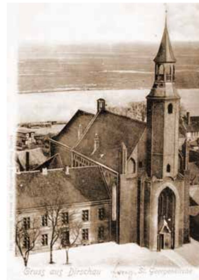
ZEZ BIORÓW DAWNEGO TCZEWIA