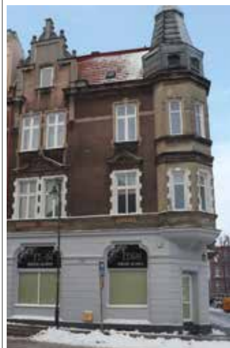
W tej kamienicy spotykali się członkowie „Victorii”. Tczew, ul. Słowackiego 1, fot. współczesna

Od 1949 roku na terenie Tczewa działała konspiracyjna organizacja „Zapora” . Związała się w Liceum Pedagogicznym w Tczewie, a jej dowódcą został dwudziestoletni Henryk Hartun, pseudonim „Lis”. Organizacja liczyła około 20 osób, posia-