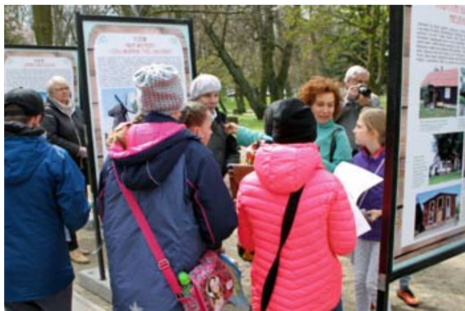
Wystawę w Parku Kopernika można oglądać do końca września br.