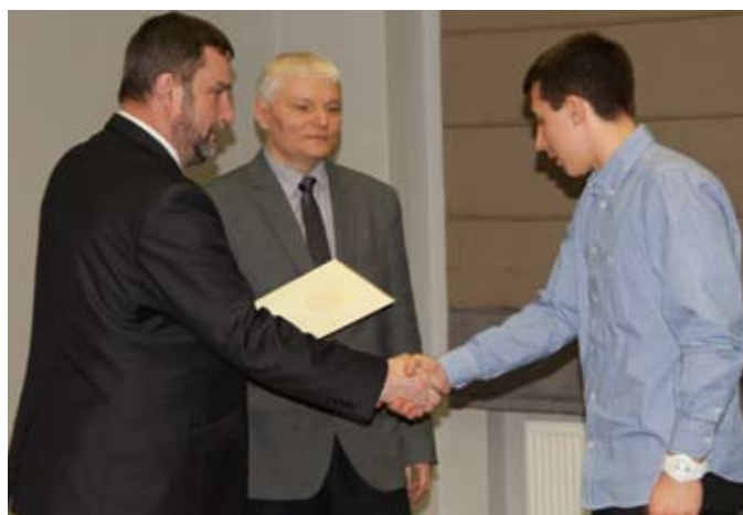
Już od wielu lat samorząd miasta Tczewa nagradza sportowców i trenerów za wybitne osiągnięcia sportowe