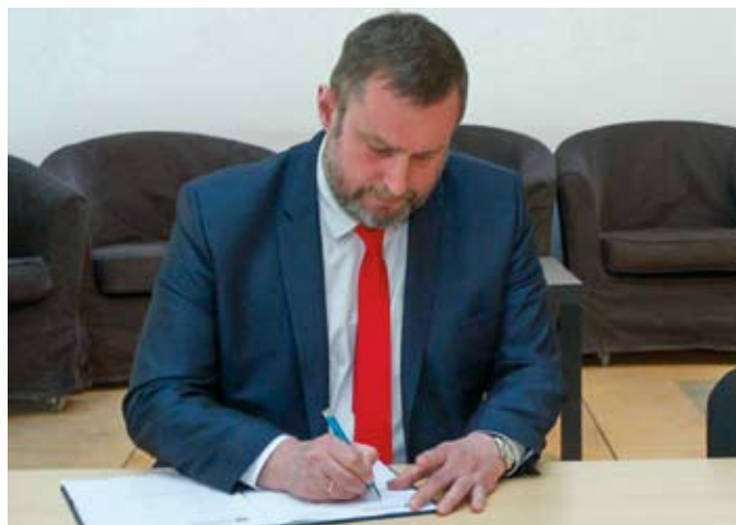
Prezydent Tczewa podpisał umowę w sprawie przystąpienia Tczewa do systemu roweru metropolitalnego

Stowarzyszenie Obszar Metropolitalny Gdańsk/Gdynia/Sopot, w imieniu stowarzyszonych gmin biorących udział w projekcie wyłoni operatora, który będzie zobowiązany dostarczyć flotę rowerów, zaplecze techniczne, teleinformatyczne i kadrowe. Obecnie trwa przygotowywanie