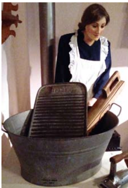
Produkty Arkony można oglądać na wystawie „20 lat wolności. Tczew 1920–1939”

Wybucho druga wojna światowa. Niemcy zakładają obóz przejściowy dla wysiedlonych Polaków, a po jego likwidacji powstaje zakład „Gerätebau Dirschau E. Schmidt” produkujący sprzęt na potrzeby niemieckiej armii (wyposażenie dla lotnictwa, sprzęt radiolokacyjny, aparaty podsłuchowe oraz sprzęt optyczny). 23 stycznia 1940 roku w fabryce wybuchają pożar, w wyniku którego spłonęło kilka samochodów. Znajdowały się one w dawnej Arkonie , ponieważ w jednej z hal niemiecka poczta urządziła warsztat samochodowy oraz garaże. W celu ułatwienia uruchamiania samochodów nad ranem, do hali wstawiano koksowniki, których zadaniem było ich ogrzewanie, co więcej skła-