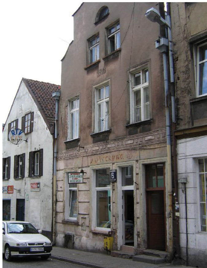
Dotację na remont otrzymali m.in. właściciele kamienicy przy ul. Podgórznej 6

3) właścicielom budynku przy ul. Garncarskiej 1–2 w Tczewie na przeprowadzenie remontu elewacji frontowej – 10 500 zł, nie więcej jednak niż 50% rzeczywistego, udokumentowanego kosztu prac,