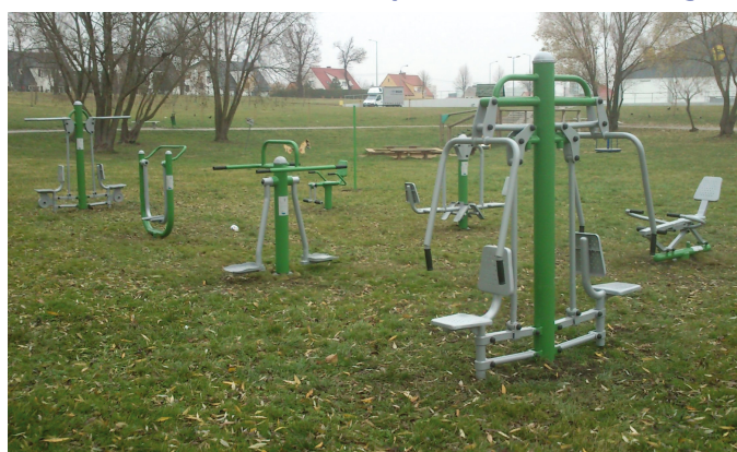
Kilka wniosków do budżetu obywatelskiego dotyczy siłowni pod chmurką

– Budżet obywatelski wprowadzamy w Tczewie po raz pierwszy, to dla nas projekt pilotażowy. Tak duża liczba wniosków to duży sukces, świadczący o tym, że jest zapotrzebowanie na tego rodzaju oddolne inicjatywy i o tym, że mieszkańcom zależy na kreo-