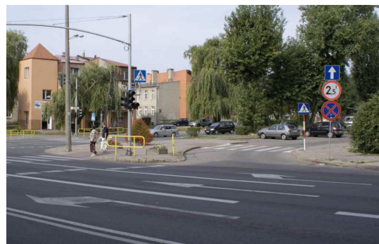
Skrzyżowanie ul. Wojska Polskiego i Sobieskiego, prawdopodobnie l. 60. XX wieku i 2012 rok