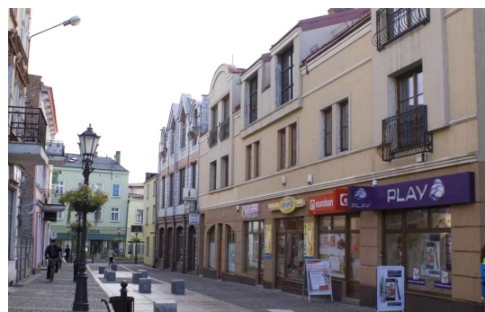
Ulica J. Dąbrowskiego, l. 80. XX wieku i 2012 rok