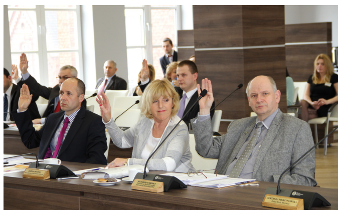
Radni uchwalili zmiany w planie zagospodarowania miasta

Znajduje się tam zdewastowany budynek po byłej masarni. Początkowo rozważane było wyremontowanie obiektu i umieszczenie tam Miejskiego Ośrodka Pomocy Społecznej, ale pomysł upadł z uwagi na duże koszty takiej modernizacji (ostatecznie