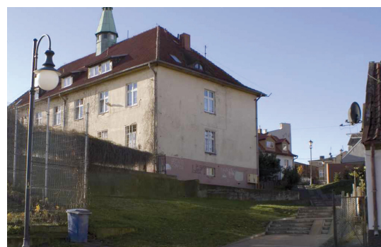
Ulica Wodna, l. 60. XX wieku i 2012 rok