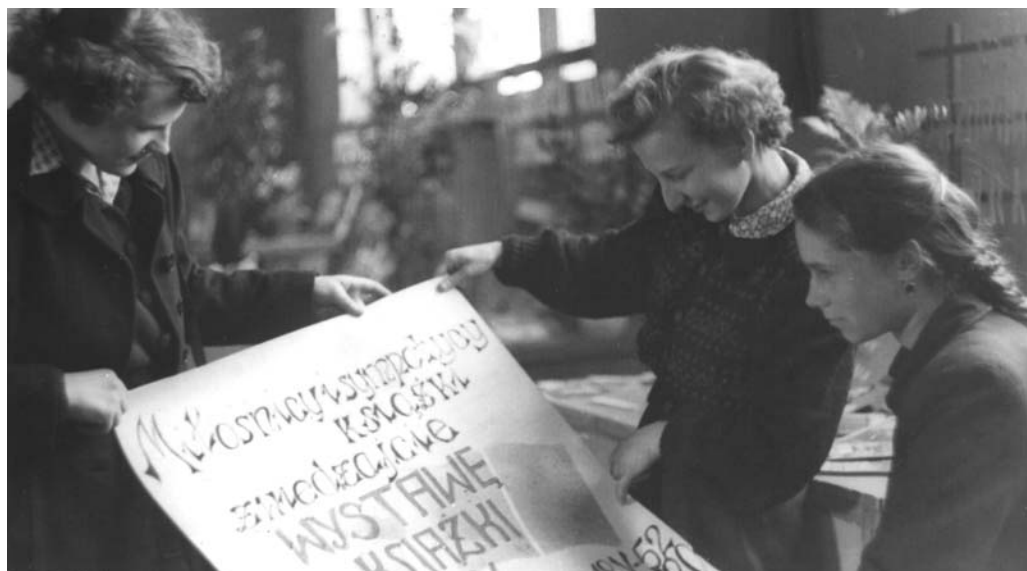
Prace nad plakatem, lata 50. XX w.

Biblioteka – to nie tylko książki, to również działalność kulturalno-edukacyjna. Przeglądy nowości wydawniczych połączone z pogadanką, obchody Dni Kultury, Oświaty, Książki i Prasy, kiermasze książek prowadzone we współpracy z księgarniami, spotkania „oko w oko” z popularnymi wówczas pisarzami, konkursy poetyckie, literackie i wiedzy o Tczewie, wystawki i wystawy, projekcje filmowe, a nawet przedstawienia teatralne w wykonaniu aktorów Teatru Wybrzeża – to tylko niektóre przedsięwzięcia realizowane przez tczewską bibliotekę od jej początków po lata osiemdziesiąte minionego stulecia.