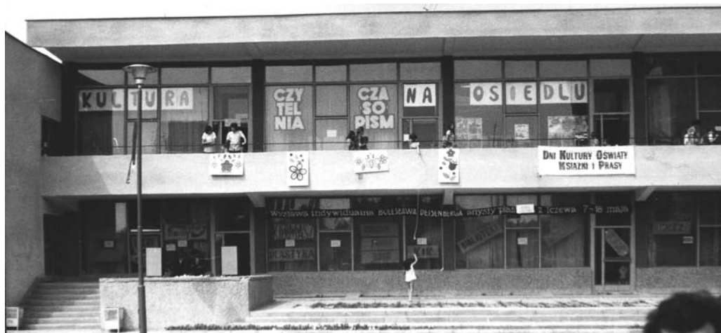
Dni Kultury, Oświaty, Książki i Prasy na Os. Garnuszeńskiego, lata 70. XX w.