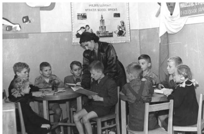
Zajęcia z najmłodszymi czytelnikami, lata 50. XX w.

Miejska Biblioteka Publiczna w Tczewie uprzejmie prosi wszystkich czytelników, którzy zapomnieli lub nie mogli z różnych względów zwrócić w terminie wypożyczonych książek, o dostarczenie ich do naszej najbliższej filii bibliotecznej. W razie zagubienia można przynieść w zamian inne wartościowe pozycje. Informujemy, że do końca maja br. książki można zwrócić bez ponoszenia konsekwencji finansowych.