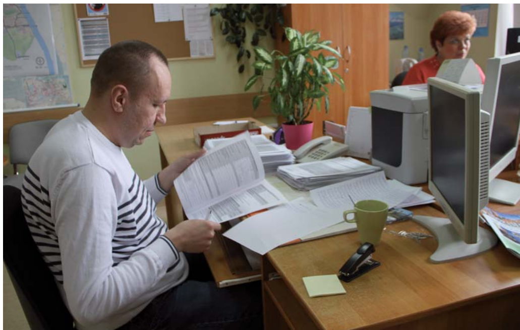
W Urzędzie Miejskim trwa przyjmowanie deklaracji

Rada Miejska w Tczewie uchwaliła, że w Tczewie opłaty będą pobierane od osoby. Osoba faktycznie mieszkająca na terenie danej nieruchomości płaci 13 zł miesięcznie za śmieci segregowane lub 18,60 zł na niesegregowane.