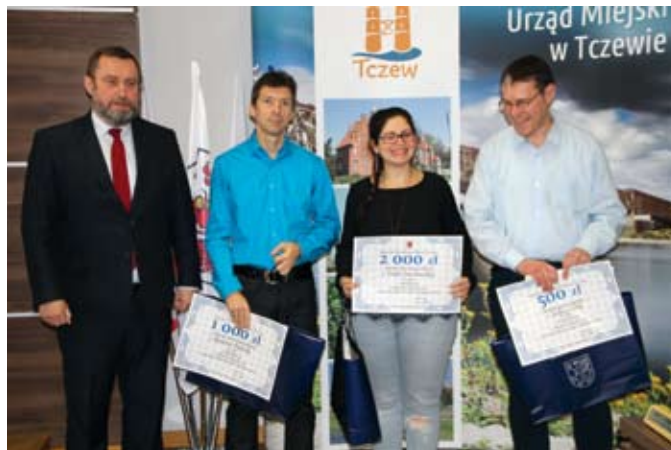
Prezydent Tczewa z laureatami konkursu

W holu Urzędu Miejskiego (budynek główny – pl. Piłsudskiego