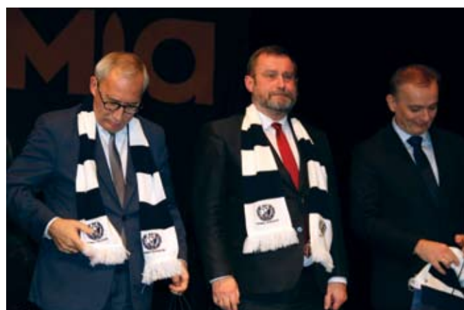
Przyjaciele Unii otrzymali klubowe szaliki