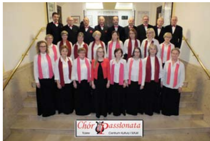
Członkowie Chóru mieszanego Passionata

Chór Passionata powstał w lutym 2013 r. przy CKiS. W repertuarze posiada utwory świeckie, ludowe, okolicznościowe, patriotyczne oraz sakralne. Wszystkie opracowane w układzie czterogłos-