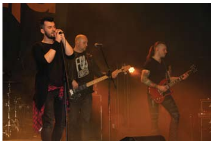
Na zakończenie uroczystej Gali wystąpił zespół Chemia