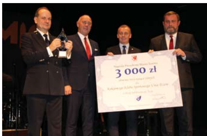
Życzenia i prezenty od samorządu Tczewa dla Unii Tczew