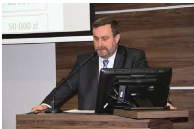
Prezydent Tczewa Mirosław Pobłocki przedstawił inwestycje, które mają być realizowane w 2017 r.

Planowany deficyt budżetu miasta: 20 603 572 zł, który zostanie sfinansowany ze sprzedaży papierów wartościowych emitowanych przez Gminę Miejską Tczew (19,3 mln zł) oraz wolnych środków z lat ubiegłych (1 303 572 zł).