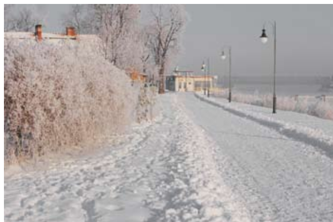
III miejsce – Zdzisław Warot „Bulwar nad Wisłą”