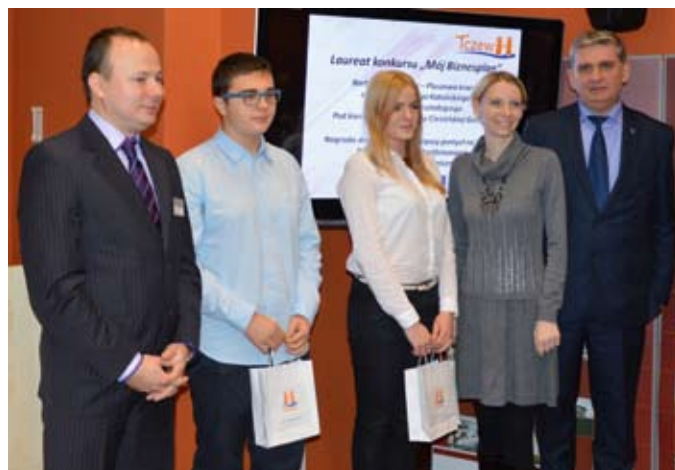
Konkurs „Mój Biznesplan 2015” – wręczenie nagród

18 listopada w Knybawie odbyła się konferencja poświęcona nowym terenom inwestycyjnym, na którą przybyło kilkudziesięciu przedsiębiorców. Tematem konferencji był rozwój terenów po byłej jednostce wojskowej – Nowego Centrum Tczewa. Konferencja składała się z trzech części, dwóch paneli wprowa-