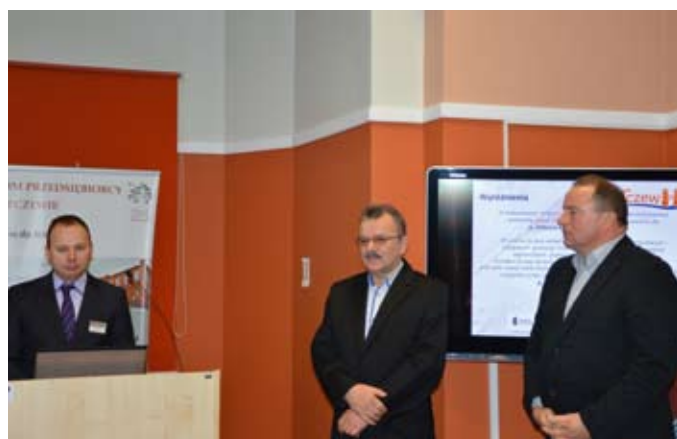
Wyróżnieni w konkursie Przedsiębiorca Roku

Serdecznie dziękujemy wszystkim przedsiębiorcom, partnerom Domu Przedsiębiorcy za udział i zaangażowanie w obchodach Światowego Tygodnia Przedsiębiorczości oraz kapitule konkursu Mój Biznesplan i Przedsiębiorca Roku. Zapraszamy do obejrzenia pełnej relacji na naszej stronie: www.dp.tczew.pl