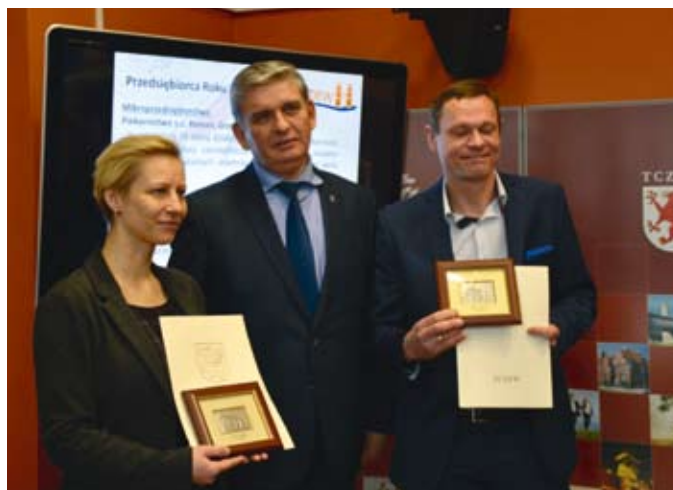
Zwycięzcy konkursu Przedsiębiorca Roku

Wyłoniono także najlepszy spośród młodzieżowych biznesplanów, złożonych przez uczniów szkół ponadgimnazjalnych. Celem konkursu jest kształtowanie postaw pro-przedsiębiorczych wśród młodzieży, promowanie kreatywnego myślenia i zalet prowadzenia własnego biznesu oraz ukazanie korzyści płynących z wprowadzania innowacji do prowadzonych przez siebie przedsięwzięć. Przy ocenie złożonych prac brano pod uwagę takie kryteria jak: oryginalność i