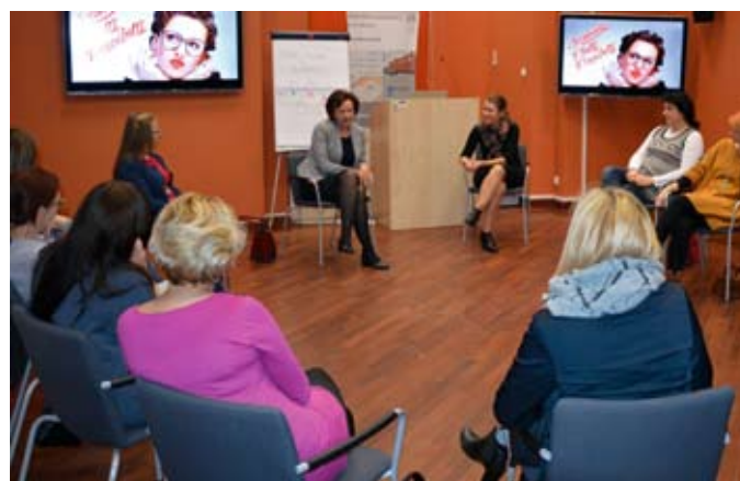
Spotkanie kobiet biznesu