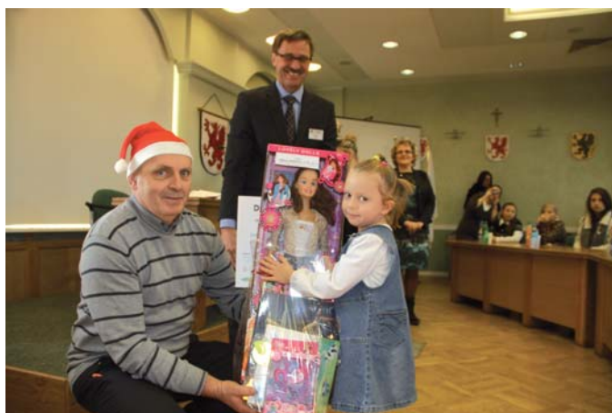
Wszyscy uczestnicy konkursu otrzymali nagrody

Komisja Konkursowa wyróżniła 26 zwycięskich prac w sze-