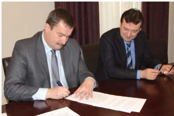
Prezydent Mirosław Pobłocki i dyr Leszek Łuczak podpisali akt notarialny

W wyniku porozumienia Skarbu Państwa przekazał miastu Tczew działkę o powierzchni 18,5992 ha położoną u zbiegu ulic Wojska Polskiego i al. Solidarności. Nieruchomość wyposażona jest w instalacje wodociągową, kanalizacyjną, energetyczną i centralnego ogrzewania i zabudowana jest m.in. budynkiem byłych koszar, budynkiem stołówki i kuchni, wartowni, izby chorych i innymi obiektami gospodarczymi, garażami, magazynami. Wartość nieruchomości wraz z zabudowaniami oszacowana została na 41 554 286 zł.