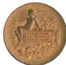
Awers złotego medalu przyznanego firmie na międzynarodowej wystawie w Paryżu, 1927 r.

Część 1. Spis alfabetyczny wszystkich mieszkańców. Cz. 2. Władze i instytucje. Cz. 3. Branże. Cz. 4. Dział reklamy. Grudziądz, Feliks Jeuthe, 1924.