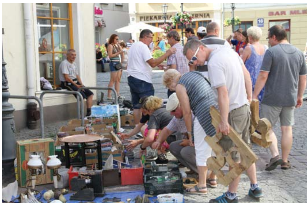
Kolejny Pchli Targ 2 czerwca 2019 r.

Pchli Targ nie miałby swojego klimatu, gdyby nie działania towarzyszące handlowi. Nie mogło zabraknąć katarzyniarza, ale tematem przewodnim części artystycznej był pokaz rzemiosł dawnych. Warsztaty kowal-