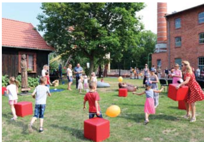
Dzień Dziecka – Zabawy na dziedzińcu

Kręcenie lizaków, modelowanie balonów, projektowanie autorskiej przypinki, malowanie na szkle i na wodzie, zabawy taneczne, gry zręcznościowe, zwiedzanie wystawy z koci...koci KOCIEWIAKIEM – taki był Dzień Dziecka w Fabryce Sztuk.