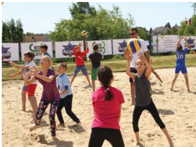
Trening siatkarski pod okiem mistrzów

O muzyczną oprawę zadbał Zespół Jan, wystąpiła także Tczewska Formacja Szantowa,