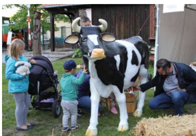
Dojenie sztucznej krowy okazało się nie lada atrakcją, nie tylko dla najmłodszych

Prawdziwy tłum zgromadził się na warsztatach robienia natu-