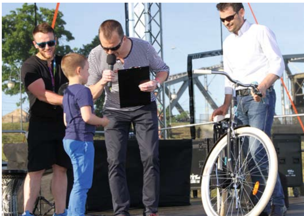
Rower był jedną z głównych nagród w wielkiej loterii

Wśród dzieci ogromnym zainteresowaniem cieszyło się koło fortuny. Wystarczyło zdobyć pieczątki do specjalnego kuponu, by móc zakręcić kołem i wygrać nagrodę. Dzieci zdobywały pieczątki w stoiskach firm komunalnych, Straży Miejskiej i miejskich instytucji – ale nie za darmo. Najpierw trzeba było odpowiedzieć na pytania lub wziąć udział w jakiejś konkurencji. Chętnych jednak nie brakowało, tym bardziej, że każde pole koła fortuny wygrywało. Nawet „bankrut” otrzymywał nagrodę pocieszenia. Do wygrania były setki nagród, m.in. plecaki, skarbonki, piłki, kubki, breloczki, czapeczki, kredki, wejściówki na basen i wiele innych.