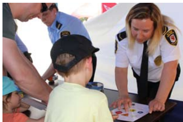
Stanowisko Straży Miejskiej