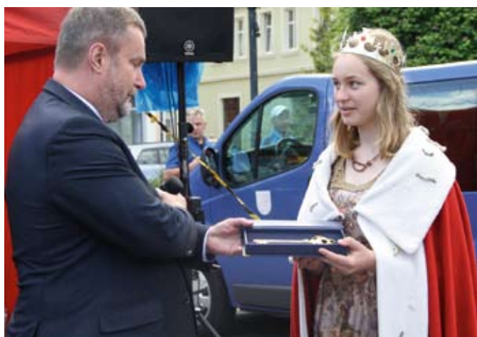
Prezydent Tczewa przekazał św. Jadwidzie klucze do miasta

Obchody święta patronki rozpoczęły się mszą św. w kościele pw. Podwyższenia Krzyża Św. Po mszy uroczystości