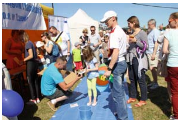
Liczne atrakcje przygotowały firmy komunalne