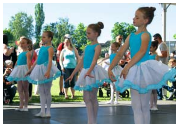
Baletnice z Centrum Kultury i Sztuki