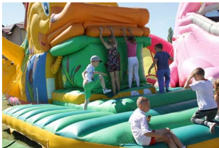
Dmuchańce cieszyły się wielkim powodziem