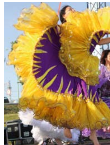
Cygańskie rytmy porwały tczewian