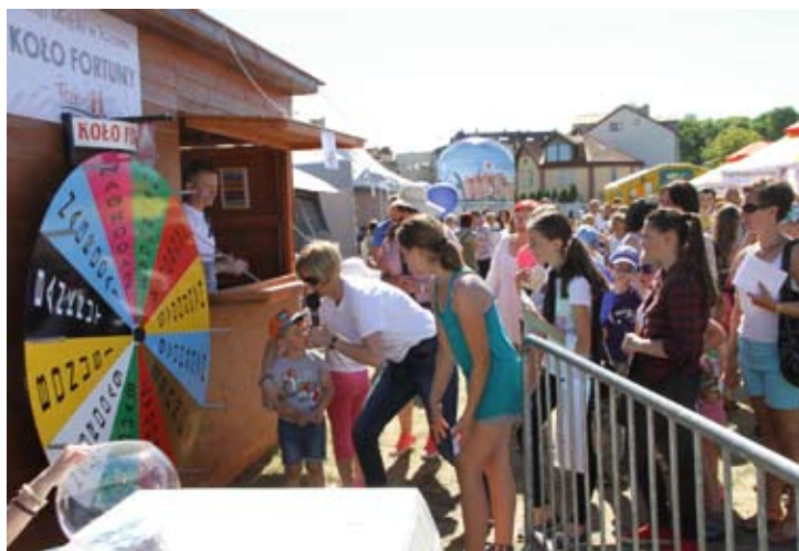
Chętnych do kręcenia kołem fortuny nie brakowało