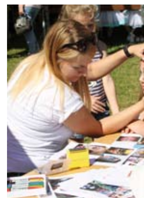
Nie brakowało chętnych do m