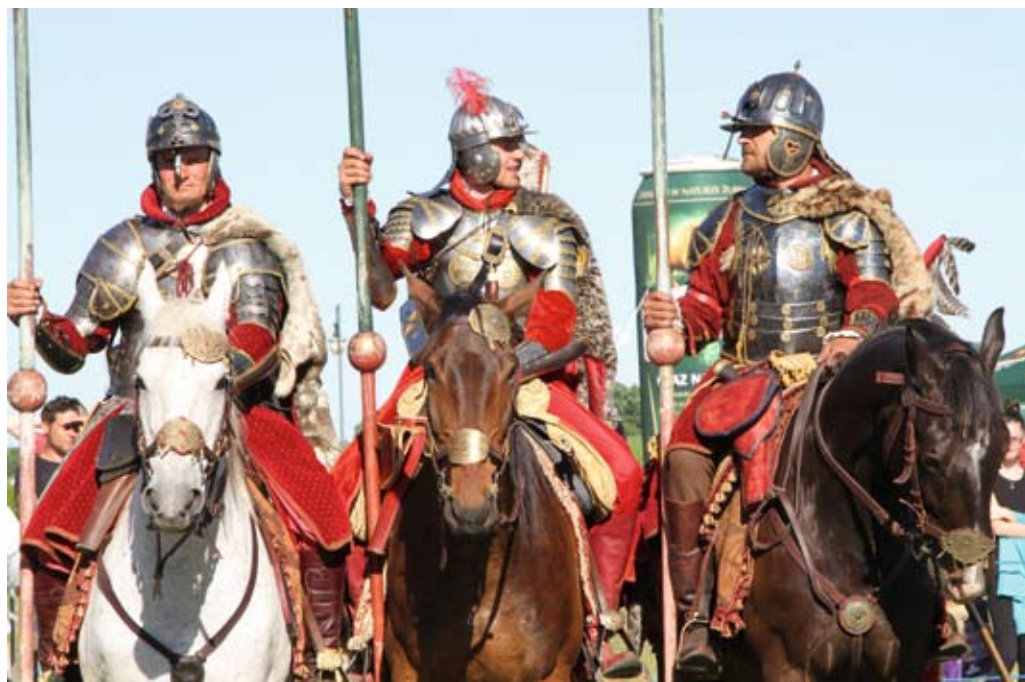
Husaria opanowała bulwar

Można było skorzystać z przejażdżki konnej, dmuchalców, poskakać na trampolinie, przemierzyć bulwar w specjalnej kuli, a najodważniejsi, wspinali się prawie do nieba – po dra-