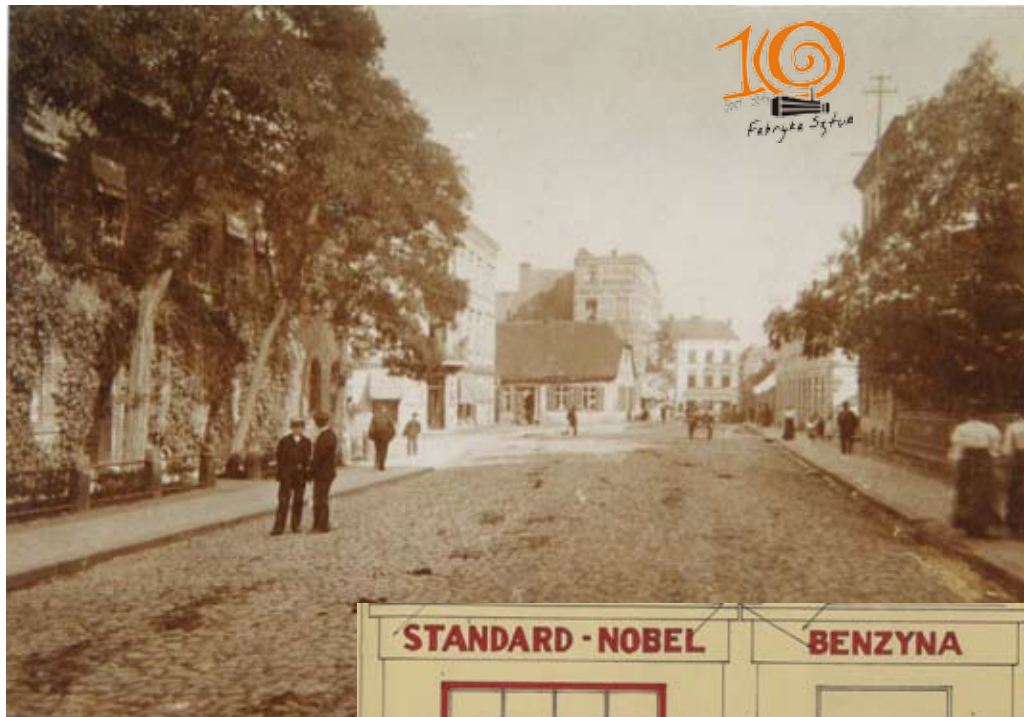
Jedno z najstarszych fotograficznych ujęć obecnej ulicy Jarosława Dąbrowskiego – pocztówka ze zbiorów Miejskiej Biblioteki Publicznej w Tczewie