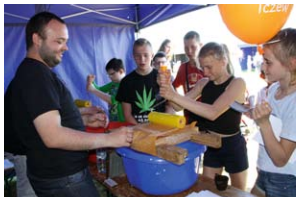
Produkcja papieru czerpanego – warsztaty Fabryki Sztuk