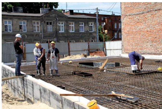
Prace przy ul. Zamkowej 11

Inwestycja realizowana jest w ramach tzw. schetynówek. Koszt budowy to 6,7 mln zł. Dotacja