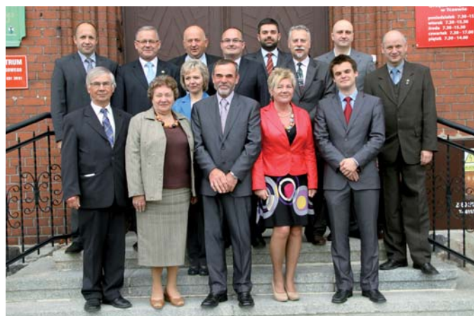
Członkowie Komisji Finansowo-Budżetowej: