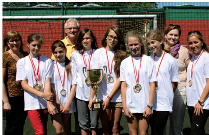
Złote medalistki z SP 11 z dyrektorką i trenerką

Tczewski zespół wywalczył tam wicemistrzostwo Polski i srebrny medal mistrzostw;