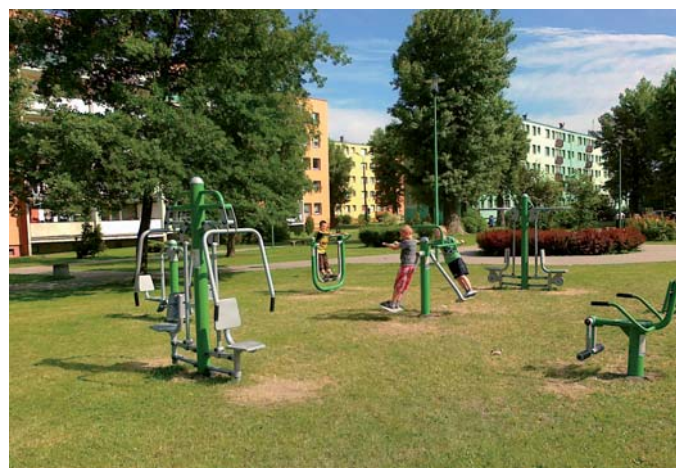
M.M. Siłownia przy ul. Orzeszkowej szybko stała się centrum zabaw

W sąsiedztwie skrzyżowania ul. Bałdowskiej z Nowowiejską niedawno powstał też nowy „mini” plac zabaw (huśtawki, sprężynowce, karuzela).