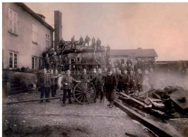
Po pożarze zajazdu „Miasto Gdańsk” i hotelu „Następca Tronu”, 20 listopada 1897 r.