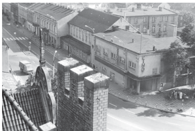
Widok na kino „Wisła”