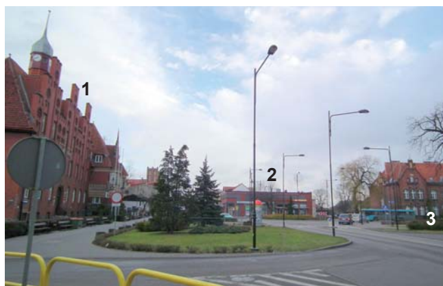
Współczesne ujęcie dawnych obiektów: 1 – zajazd, 2 – kino, 3 – pomnik