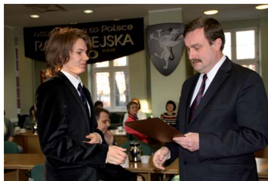
Prezydent M. Pobłocki wręczył nagrody pieniężne i drobne upominki

Regulamin przyznawania nagrody określa uchwała Rady Miejskiej w Tczewie nr VI/33/2007 z 29 marca 2007 r. oraz zmieniająca ją Uchwała Nr XLVII/408/2010 z 24 czerwca 2010 r. Uchwały dostępne są na stronie Biuletynu Informacji Publicznej; www.bip.tczew.pl .