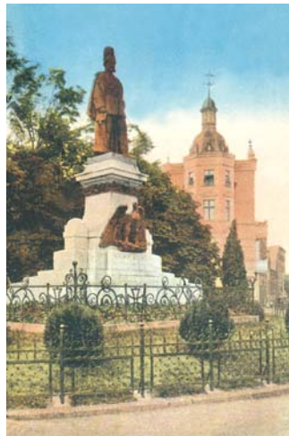
Pomnik cesarza Wilhelma