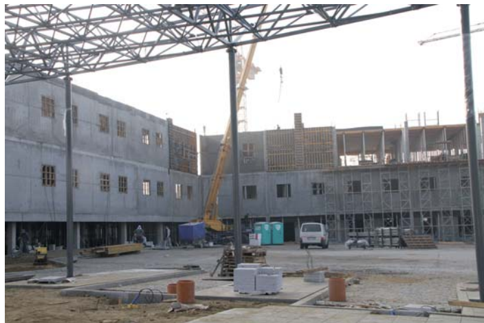
Nowa ulica Dworcowa