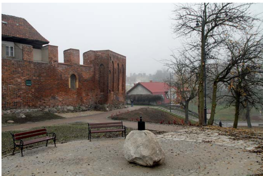
Teren między ul. J. Dąbrowskiego a Wąską stał się miejscem wypoczynku i spacerów

Część prac na starówce wstrzymana została nie tylko ze względu na porę roku, ale również z uwagi na prace archeologiczne. Badania prowadzono m.in. w rejonie ul. Rybackiej – przy powstającym punkcie widokowym i amfiteatrze. Fragmenty średniowiecznych murów odkryto również na rogu ul. Chopina i Wodnej.