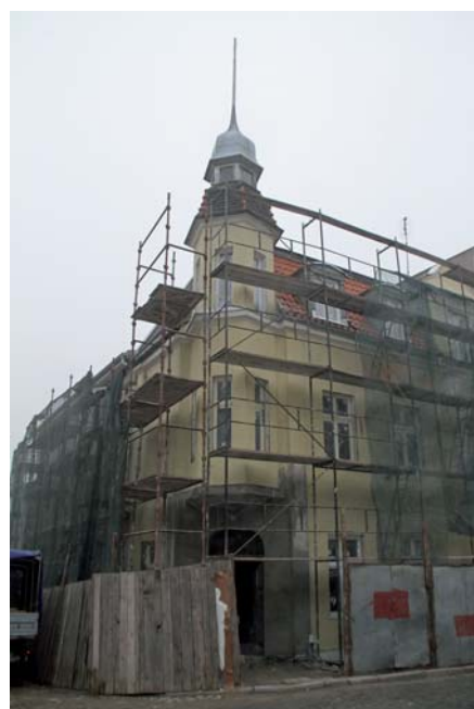
Trwa remont kamienicy przy ul. Chopina 33