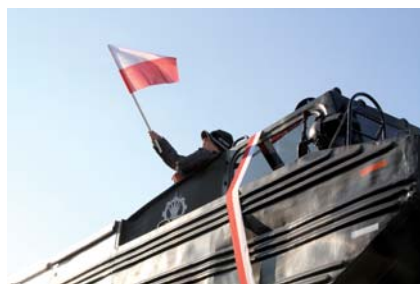
Z transportera najbardziej ucieszyli się najmłodszy

W ramach obchodów Narodowego Święta Niepodległości, 11 listopada w Centrum Kultury i Sztuki odbył się koncert pieśni patriotycznych „Serce w plecaku”, a następnego dnia Tczewskie Centrum Sportu i Rekreacji zorganizowało Uliczny Bieg Sambora.