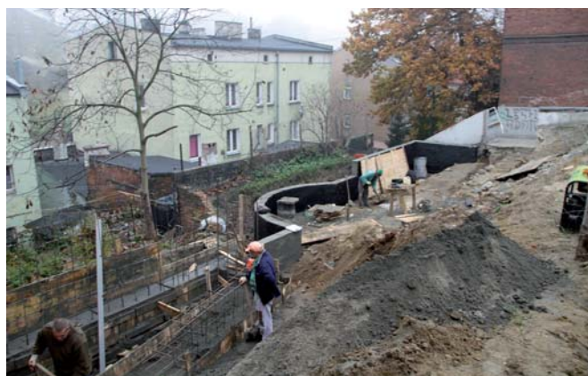
Przy ul. Rybackiej powstaje niewielki amfiteatr i punkt widokowy