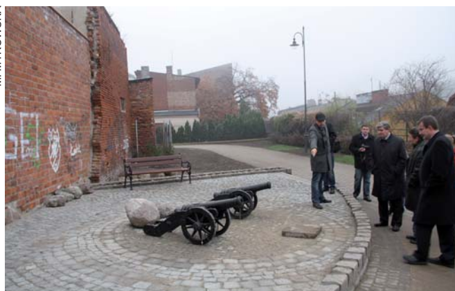
Przy murach obronnych atrakcją są dwie armaty