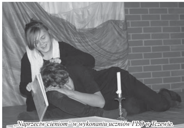
„Naprzeciw ceniom” w wykonaniu uczniów I LO w Tczewie.