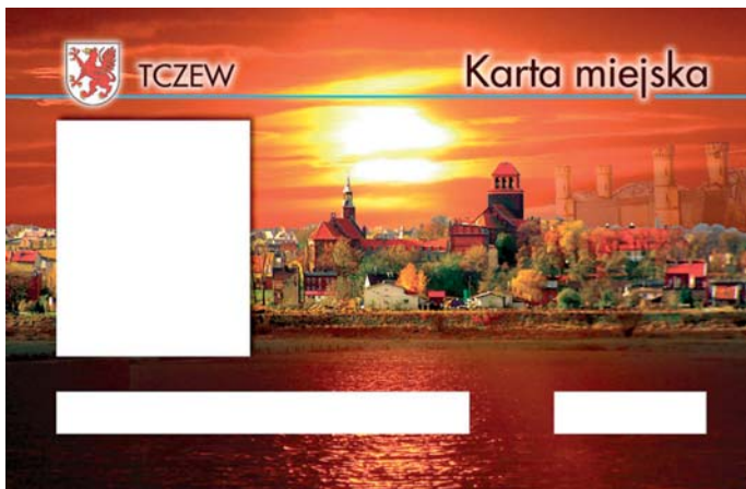
Projekt karty miejskiej.

Od 1 kwietnia przyszłego roku użytkownicy komunikacji miejskiej w Tczewie będą posługiwali się biletem elektronicznym – kartą miejską. System ten pozwoli na dokładniejsze określenie liczby przejazdów ulgowych oraz przemieszczania się pasażerów. Równocześnie bilet elektroniczny ma powiązać system komunikacyjny Tczewa i aglomeracji trójmiejskiej. Kolejne zapowiadane zmiany to uzależnienie cen biletów od długości przejechanej trasy.