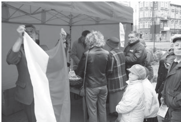
Przed 11 listopada wiele osób zaopatrzyło się we flagi narodowe.

11 listopada tczewianie uczcili Narodowe Święto Niepodległości. Wszędzie widać było biało-czerwone flagi. Otrzymali je wszyscy uczestnicy uroczystości patriotycznych i z flagami przemaszerowali ulicami miasta do kościoła farnego, gdzie odbyła się msza św. za Ojczyznę. Przez trzy dni poprzedzające Święto Niepodległości (7, 8 i 10 listopada) narodowe flagi można było także kupić przed Urzędem Miasta.