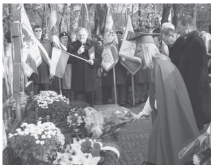
Na grobach żołnierzy złożono kwiaty.