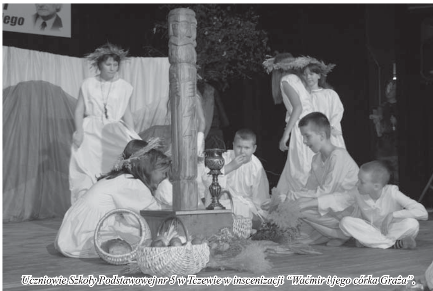
Uczniowie Szkoły Podstawowej nr 5 w Tczewie w inscenizacji „Waćmir i jego córka Graża”.