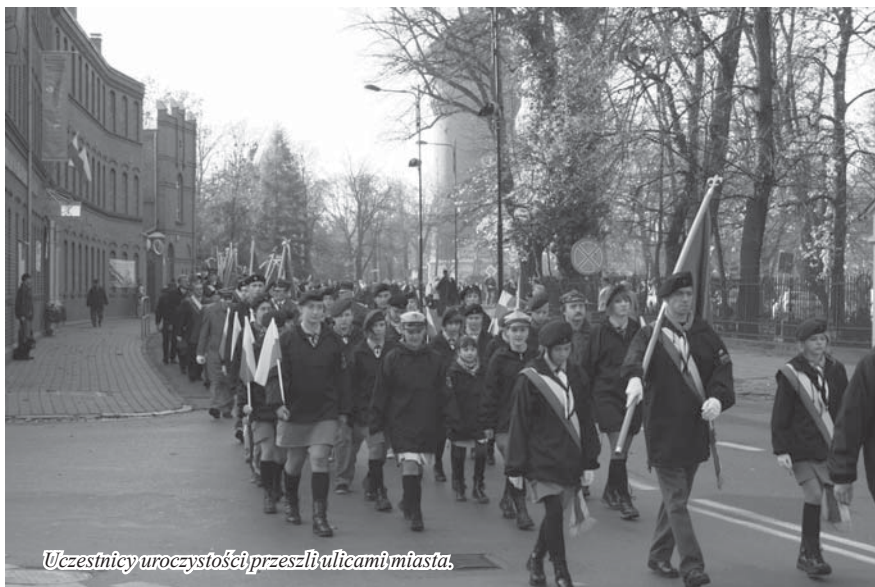
Uczestnicy uroczystości przesuwać ulicami miasta.