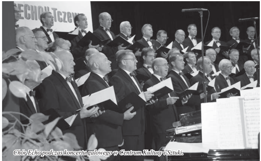
Chór Echo podczas koncertu galowego w Centrum Kultury i Sztuki.