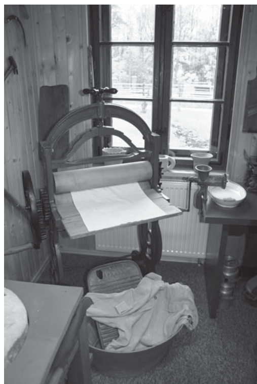
W pomieszczeniach zgromadzono meble i sprzęty używane dawniej na Kociewiu.