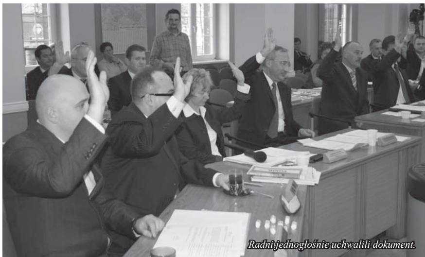
Radni jednogłośnie uchwalili dokument.

• Popieranie aktywności dzieci i młodzieży poprzez sport, turystykę i rekreację m.in.