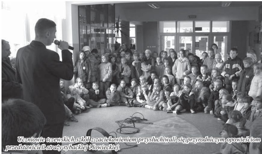
Uczniowie tczewskich szkół z zacięciem przysłuchiwali się przyrodniczym opowieściom przedstawicieli straży rybackiej i łowieckiej.

II Nadwiślańskie Spotkania Regionalne organizowane przez Oddział Kociewski Zrzeszenia Kaszubsko-Pomorskiego w Tczewie zgromadziły wielu pasjonatów naszego regionu. Większość spotkań odbywała się w Centrum Wystawienniczo-Regionalnym Dolnej Wisły, ale uczestnicy spotkań gościli także w tczewskich szkołach. Reprezentacja Państwowej Straży Łowieckiej oraz Państwowej Straży Rybackiej przygotowała dla uczniów szkół podstawowych nr 8 i 10 prezentacje ekologiczne, które spotkały się z ogromnym zainteresowaniem.