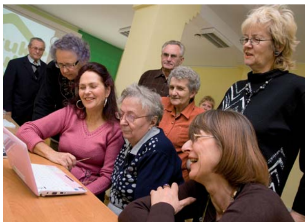
Tczewscy „Seniorzy w akcji”, czyli Animatorzy 50+ projektu „Stuk-puk. Otwórz drzwi, pomogę Ci”

Projekt był realizowany w dwóch edycjach w latach 2009-2011, współfinansowany ze środków Towarzystwa Inicjatyw Twórczych „e” w ramach programu „Seniorzy w akcji”.