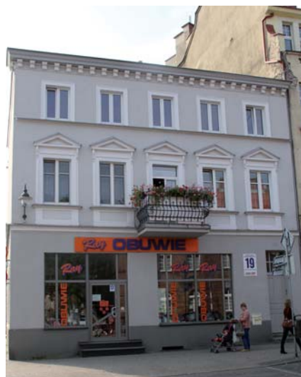
Jurorzy nagrodzili m.in. elewację budynku przy ul. J. Dąbrowskiego 19