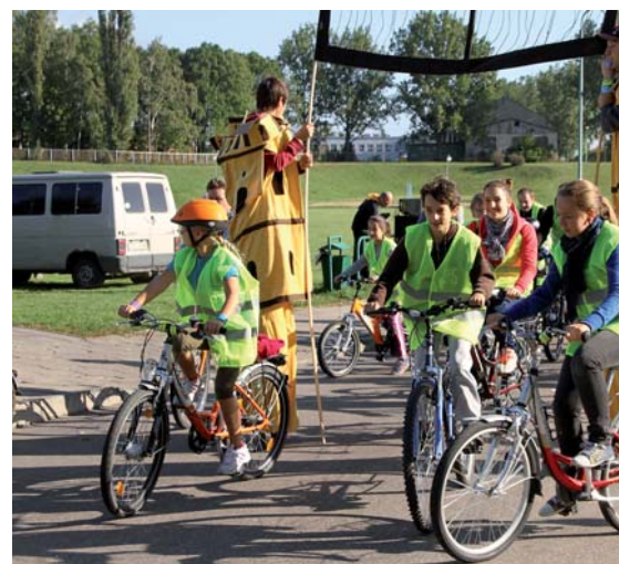
Z kanonki wystartowało ponad 500 osób