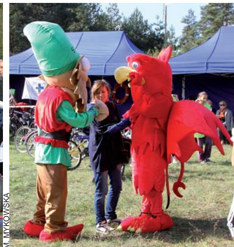
Rowerowe Mistrzostwa Kociewia