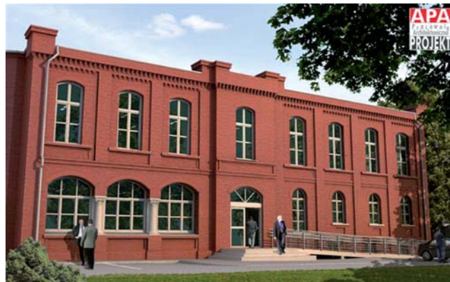
Wizualizacja Domu Przedsiębiorcy

Inwestycja warta jest 4 mln zł, w 75 proc. finansuje ją Unia Europejska w ramach Europejskiego Funduszu Rozwoju Regionalnego.