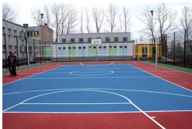
Boisko Orlik przy Sportowej Szkole Podstawowej nr 2

●● Rewitalizacja Starego Miasta – rewitalizacja zdegradowanego obszaru ścisłego Starego Miasta to jeden z najważniejszych celów realizowanych przez samorząd miasta Tczewa. Chodzi o to, aby starówka była atrakcyjna dla mieszkańców i turystów jako miejsce spacerów i spędzania wolnego czasu. To projekt na wiele lat. Jego realizacja pozwoli wyeksponować piękno dawnej zabudowy i przybliżyć historię miasta. Zabytkowe obiekty będą oświetlone, pojawią się tablice informujące o historycznej wartości tych miejsc, dzięki systemowi monitoringu poprawi się bezpieczeństwo. Projekt obejmuje wykreowanie nowych przestrzeni publicznych i wy-