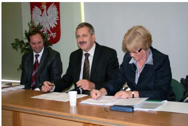
Podpisanie umowy (wrzesień 2009 r.)

●● Budowa sieci wodno-kanalizacyjnej – inwestycję realizuje Zakład Wodociągów i Kanalizacji. Po jej zakończeniu możliwość podłączenia do kanalizacji sanitarnej uzyska blisko 1000 osób, natomiast możliwość podłącze-