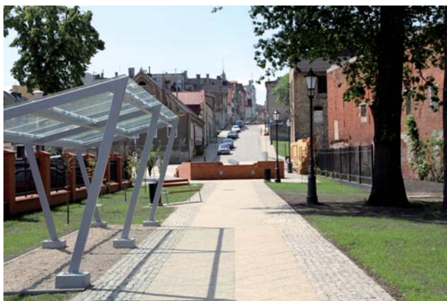
Droga widokowa to jeden z elementów projektu rewitalizacji

tyczenie trzech szlaków – drogi widokowej, spacerowej i szlaku fortecznego. Zakończyła się realizacja pierwszego etapu „Drogi widokowej” wiodącej od ul. Jarosława Dąbrowskiego (skrzyżowanie z ul. Kościuszki) poprzez ul. Krótką, plac Hallera, ul. Podgórną aż nad Wisłę. Na realizację zadań związanych z rewitalizacją zdegradowanego obszaru Starego Miasta Tczew otrzymał ponad 10 mln zł unijnego dofinansowania w ramach Regionalnego Programu Operacyjnego Woj. Pomorskiego.