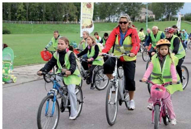
Coroczny „Dzień bez samochodu” jest w Tczewie okazją do promowania jazdy na rowerze

●● Miasto dla rowerów – Samorząd Tczewa inwestuje w budowę tras rowerowych na terenie miasta, a także, we współpracy z innymi gminami, na terenie całego Kociewia. Jedną z takich tras, liczącą 100 km, będzie Trasa Grzymiśława prowadząca z Tczewa do Nowego. W 2009 r. podczas Międzynarodowego Kongresu Europejskiej Federacji Cyklistów (EFC) w Brukseli Tczew, jako pierwsze polskie miasto, otrzymał certyfikat przeprowadzenia audytu polityki rowerowej BYPAD. Certyfikacja polegała na pełnej analizie dotychczasowych warunków i możliwości realizacji w przyszłości polityki rowerowej w mieście. Jednym z efektów uzyskania certyfikatu było zorganizowanie w Tczewie Kongresu Europejskiej Federacji Cyklistów w maju 2010 r. W ramach rowerowego projektu PRESTO, w którym Tczew uczestniczy obok takich miast jak Grenoble, Zagrzeb, Wenecja, Brema, tczewianie testują rowery hybrydowe, w których siła mięśni wspomaganą jest przez napęd elektryczny.