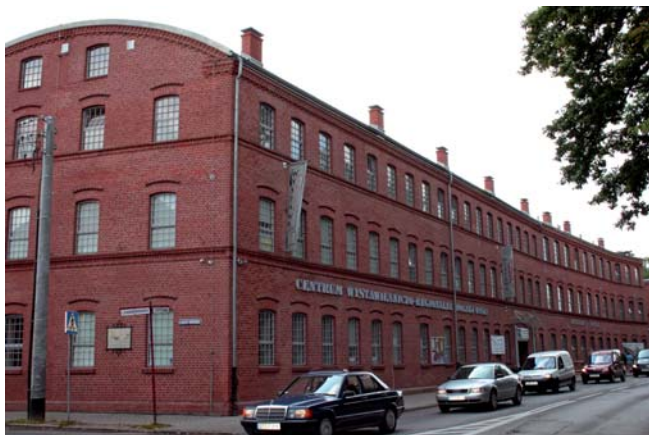
Centrum Wystawienniczo-Regionalne Dolnej Wisły

●● Centrum Wystawienniczo-Regionalne Dolnej Wisły – otwarte na początku 2007 r. to placówka z nowatorską ofertą działań promujących dziedzictwo Tczewa i Kociewia. Proponuje m.in. wystawy, lekcje regionalizmu i historii, spacerów po mieście pod opieką przewodnika, warsztaty artystyczne. W budynku działa także Muzeum Wisły będące oddziałem Muzeum Morskiego w Gdańsku. CWRDW zdobyło główną nagrodę w konkursie 7 Cudów Unijnych Funduszy. W kategorii „rewitalizacja” Tczew był bezkonkurencyjny.