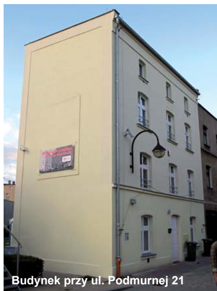
Budynek przy ul. Podmurnej 21