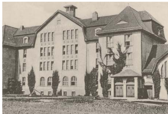
Budynek dawnej Szkoły Morskiej w Tczewie, dziś I LO (ze zbioru pocztówek T. Spionka znajdujących się w zasobach Miejskiej Biblioteki Publicznej w Tczewie)

W 1939 r. w listopadzie musiałyśmy opuścić miasto. Zamieszkałyśmy w