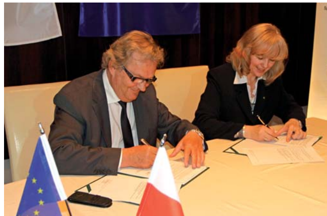
Podpisanie umowy na dofinansowanie inwestycji (maj 2010 r.)

Realizacja projektu zapewni odzysk surowców, ograniczenie ilości odpadów biodegradowalnych kierowanych na składowisko, minimalizację objętości odpadów składowanych na składowisku oraz ich ostateczne unieszkodliwienie zgodnie z najlepszymi dostępnymi technikami oraz polskimi i unijnymi wymogami prawnymi.