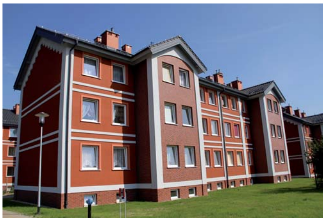
Budynek przy ul. Prostej

●● Plac Papieski – został wyróżniony w trzeciej edycji Konkursu na Najlepszą Przeszłość Publiczną Woj. Pomorskiego 2008. Komisja konkursowa zwróciła uwagę na wartościowy przykład uporządkowania fragmentu przestrzeni wspólnego osiedla i podkreślenie wartości symbolicznej miejsca. Plac Papieski w Tczewie jest dziś jedną z najbardziej reprezentacyjnych przestrzeni publicznych w mieście. Jeszcze w 2005 r. był to niezagospodarowany teren przed kościołem NMP Matki Kościoła, który funkcjonował jedynie jako „dziki” parking dla odwiedzających świątynię. Śmierć Jana Pawła II zainicjowała społeczną ideę zagospodarowania tej przestrzeni jako miejsca upamiętniającego papieża – Polaka.