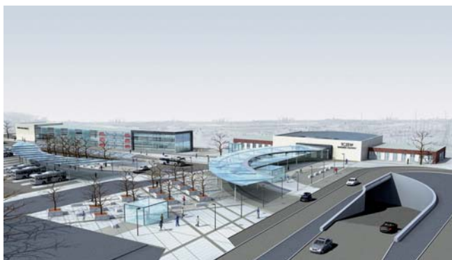
Wizualizacja regionalnego węzła transportowego

W ramach Regionalnego Programu Operacyjnego Województwa Pomorskiego na lata 2007-2013 Tczew uzyskał ponad 12 mln zł dotacji dla projektu którego wartość ogólna wynosi około 26 mln zł.