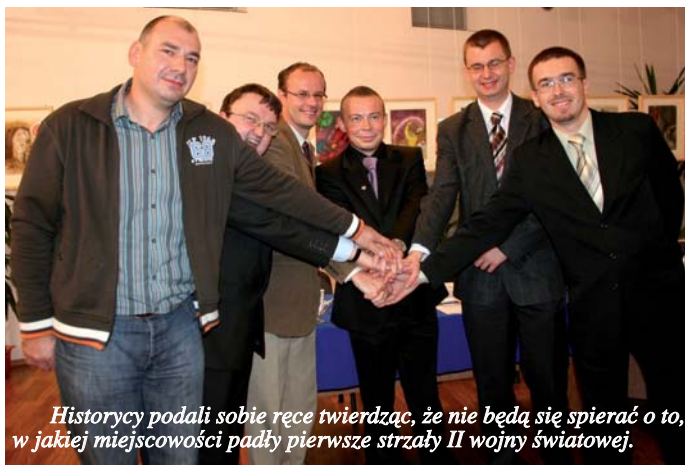
Historycy podali sobie ręce twierdząc, że nie będą się spierać o to, w jakiej miejscowości padły pierwsze strzały II wojny światowej.

Nadwiślańskie Spotkania Regionalne trwały trzy dni. Odbyło się w tym czasie mnóstwo spotkań adresowanych do młodzieży, seniorów, ludzi zainteresowanych historią. W tym czasie młodzież tczewskich szkół spotkała się z przedstawicielami Muzeum KL Stut-