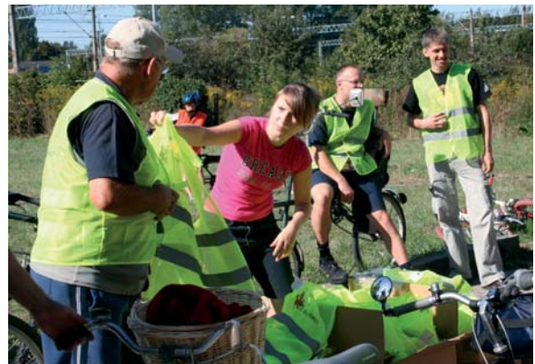
Każdy z uczestników tczewskiego „Dnia bez samochodu” otrzymał odblaskową kamizelkę z herbem miasta.

na polskiej i europejskiej mapie miast rowerowych. Promowaliśmy więc nie tylko samą jazdę rowerem, ale i miasto. Do kierowców zaczął docierać fakt, że rowerzyści nie jeżdżą tylko po ścieżkach rowerowych. Rowerzyści przestali być „przezroczyści”. Kierowcy, widząc ich z większej odległości, mogli przystosować swój styl jazdy z większym wyprzedzeniem. Do świadomości wielu z nich przypuszczalnie zaczęło docierać przesłanie, że im więcej rowerzystów na jezdni, tym więcej miejsca dla nich.