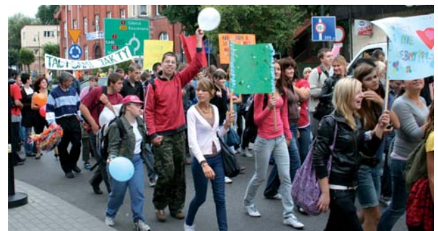
W paradzie uczestniczyło wielu tczewian.

Na placu Hallera przez kilka godzin trwały występy artystyczne, zorganizowano także kiermasz prac wykonanych