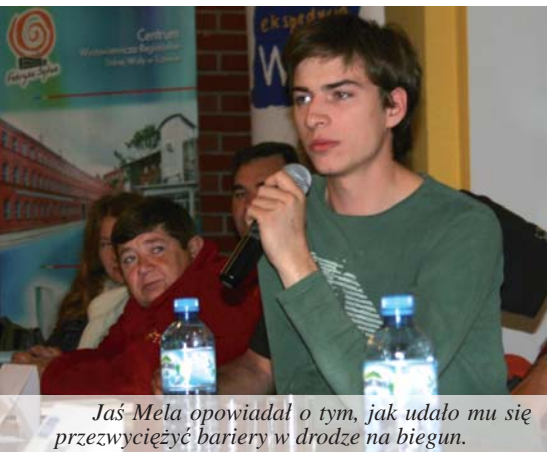
Jaś Mela opowiadał o tym, jak udało mu się przezwyciężyć bariery w drodze na biegun.