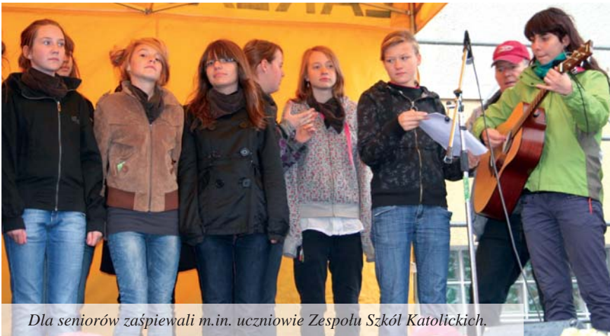
Dla seniorów zaśpiewali m.in. uczniowie Zespołu Szkół Katolickich.

Jak zwykle hucznie tczewscy seniorzy obchodzili Międzynarodowy Dzień Osób Starszych. Świętowali wspólnie z zaprzyjaźnionymi organizacjami porządkowymi, młodzieżą i najmłodszym pokoleniem tczewian. Mimo kapryśnej pogody, niekwa przy ul. Łaziennej 1 październik tętnił życiem.