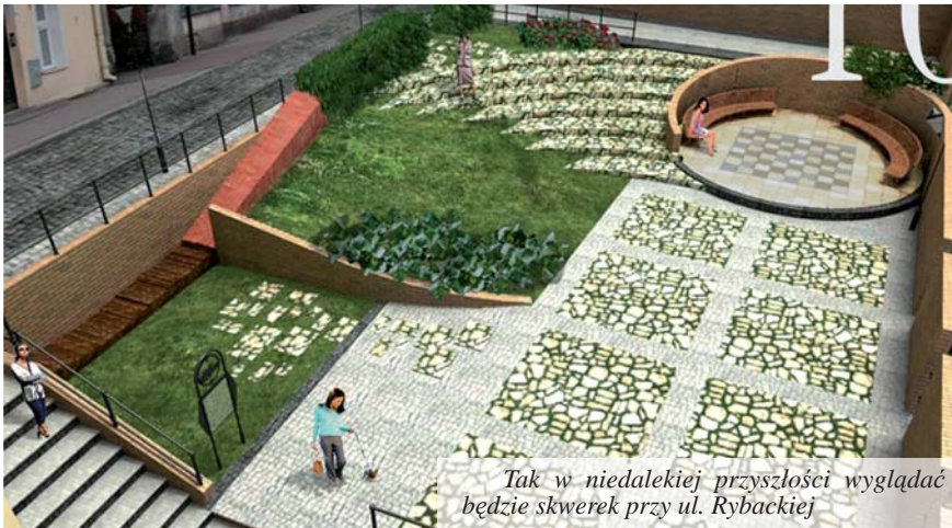
Tak w niedalekiej przyszłości wyglądać będzie skwerek przy ul. Rybackiej

Tczew zdobył dodatkowy atut w wyścigu do unijnych funduszy przeznaczonych na rewitalizację najbardziej zaniedbanych dzielnic pomorskich miast. Porozumienie w sprawie zakresu przedsięwzięć objętych dofinansowaniem w ramach Regionalnego Programu Operacyjnego Woj. Pomorskiego, podpisane 2 października przez marszałka woj. pomorskiego oraz wiceprezydenta Tczewa oznacza, że nasz projekt rewitalizacyjny został bardzo dobrze oceniony i jest niemal pewne, że uzyska dofinansowanie. Mamy szansę na 11 mln zł.