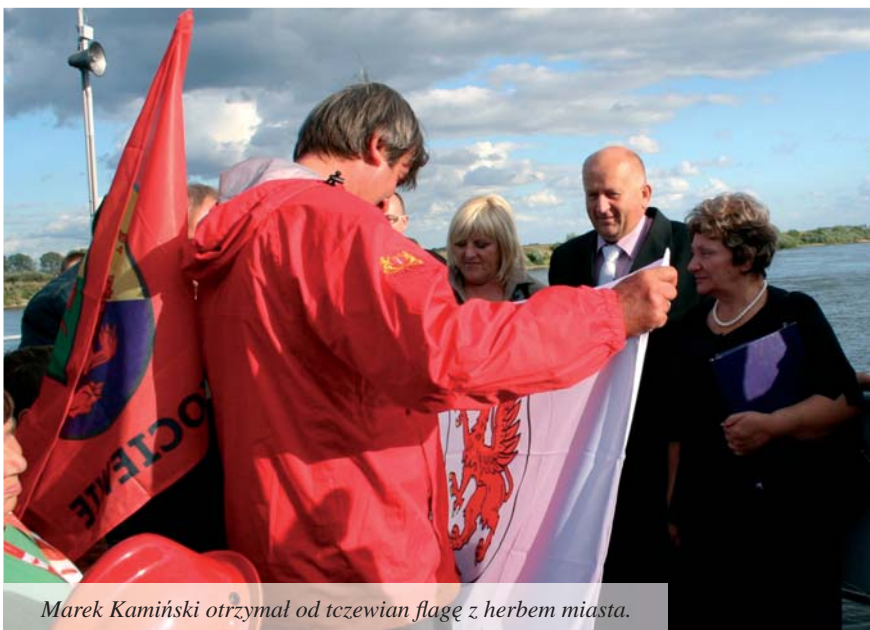
Marek Kamiński otrzymał od tczewian flagę z herbem miasta.

runają w gruzach – powiedział Jaś Mela, dzisiaj 20-letni mężczyzna. – Byłem przekonany, że zupełnie straciłem możliwość realizowania marzeń, że nic już się moim życiu nie wydarzy. To Marek pokazał mi, że osoba niepełnosprawna może żyć normalnie, co więcej – zrobić coś tak niezwykłego jak dojść na dwa bieguny. Ta wyprawa nauczyła mnie, że nie można się poddawać. Jeśli bardzo się czegoś chce, można pokonać niewyobrażalne przeszkody i zrealizować swoje marzenia.