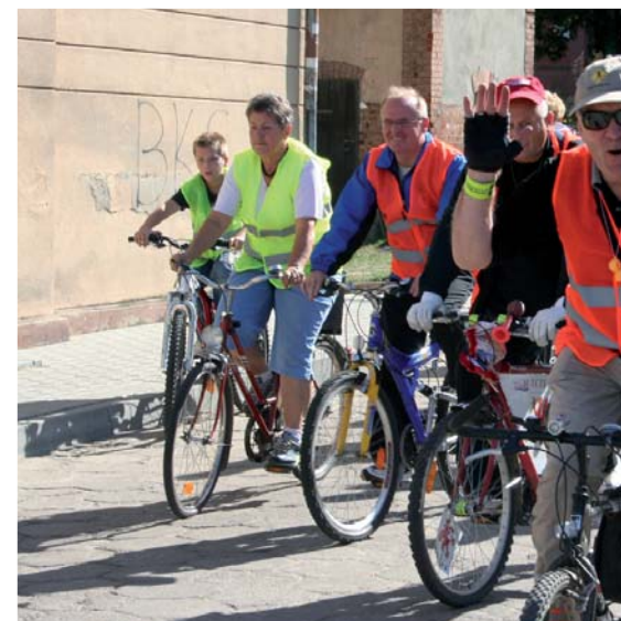
Rowerzyści tradycyjnie wystartowali z ul. Prostej...