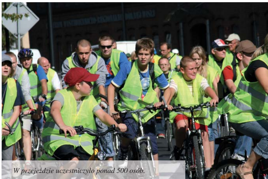
W przejeździe uczestniczyło ponad 500 osób.