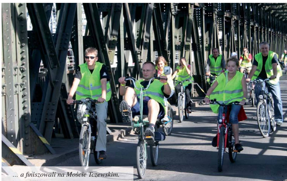
... a finiszowali na Moście Tczewskim.