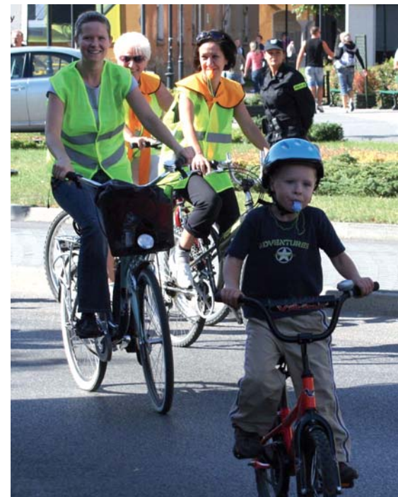
Na trasie pojawili się także bardzo młodzi rowerzyści.

Na wszystkich uczestników przejazdu już na starcie czekały kamizelki odbłaskowe oraz gwizdki. Tak wyposażony – kolorowy i głośny peleton wyruszył z ulicy Prostej. Nad bezpieczeństwem rowerzystów czuwała policja i straż miejska.