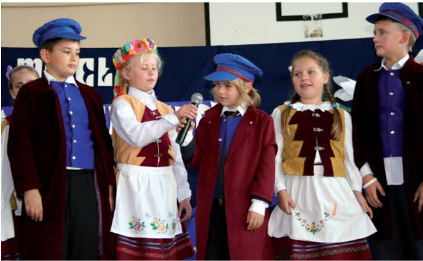
Przed niemieckimi gośćmi wystąpił m.in. zespół „Samborowe dzieci”

20 lat partnerstwa świętowali uczniowie Gimnazjum w Norderstedt w Niemczech i Szkoły Podstawowej nr 10 oraz Gimnazjum nr 1 w Tczewie – to dwa razy dłużej niż trwa partnerstwo między samorządem Tczewa a miastem Witten w Niemczech. Ta współpraca to najlepszy przykład na to, że ani granice ani język nie muszą być barierą w poznawaniu kraju i kultury sąsiadów, a przede wszystkim w nawiązywaniu zupełnie prywatnych znajomości i przyjaźni.