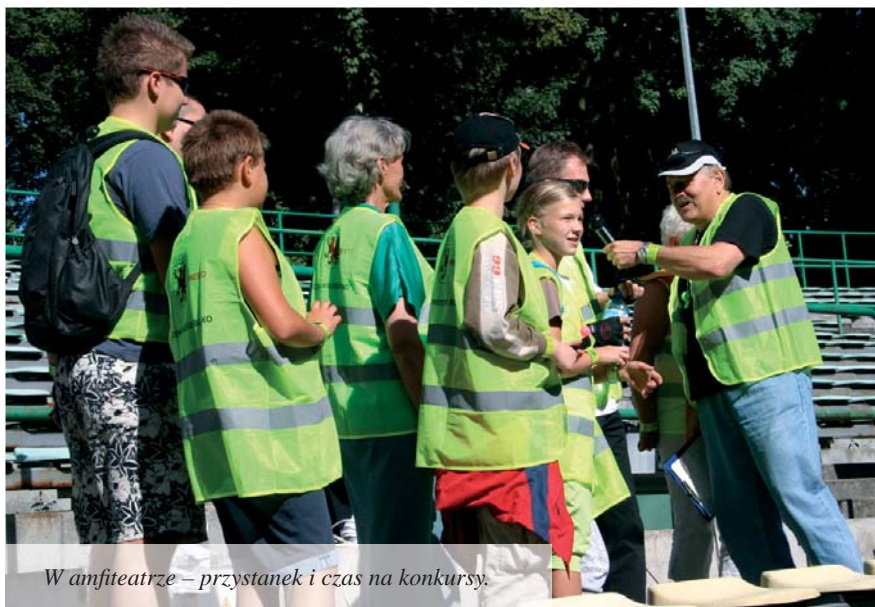
W amfiteatrze – przystanek i czas na konkursy.