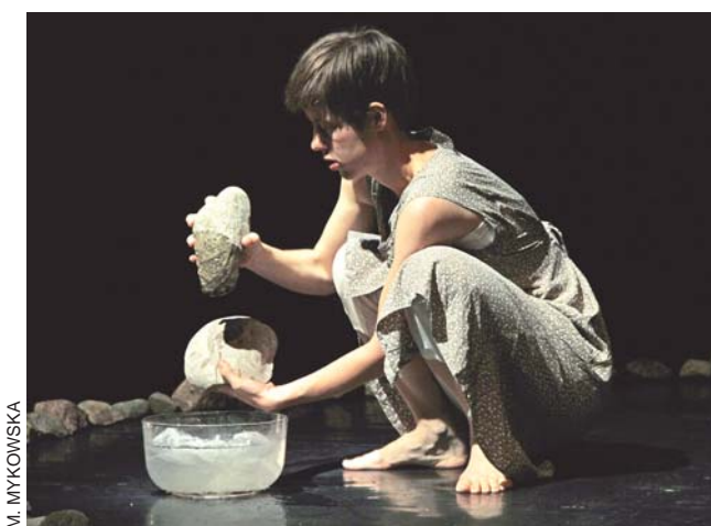
Kobieta zatrzymująca wodę – spektakl artystów z Finlandii