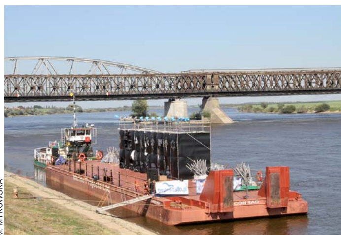
Barka na nabrzeżu Wisły była sceną ostatniego festiwalowego spektaklu – „Miasto możliwe”