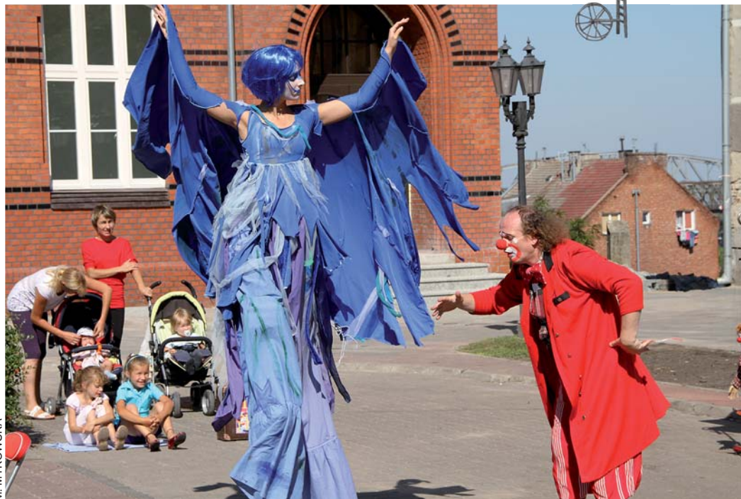
Na placu Św. Grzegorza wystąpił uwielbiany przez dzieci Pan Pinezka

Dwie równorzędne pierwsze nagrody otrzymali twórcy spektaklu „Kwartet na czterech aktorów” (Akademia Teatralna w Warszawie i Państwowa Wyższa Szkoła Filmowa, Telewizyjna i Teatral-