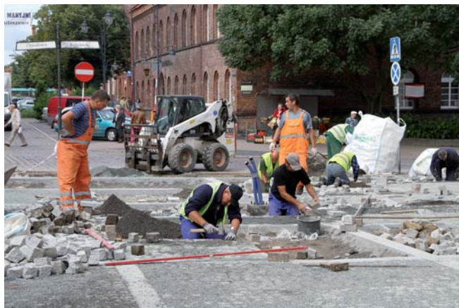
Przy ul. J. Dąbrowskiego trwa układanie nowej nawierzchni

Prace przy realizacji projektu rewitalizacji Starego Miasta w pełni. Na początku września uruchomiona została fontanna na placu Hallera, wykonana w ramach Drogi Widokowej, obecnie trwa wymiana nawierzchni na staromiejskich uliczkach oraz remonty w kamienicach.