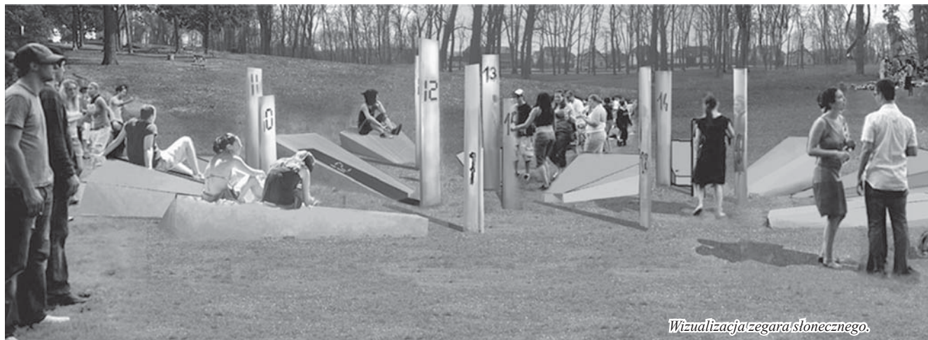
Wizualizacja zegara słonecznego.

Mini pole golfowe wraz z wypożyczalnią sprzętu, zegar słoneczny, na którym będzie można przysiąc, plac do gry w boule, plac zabaw, brodzik, w którym najmłodszy będą mogli ochłodzić się podczas upałów - to tylko część atrakcji planowanych w Parku Miejskim. Liczący ponad 15 ha park to prawdziwe płuca miasta, największy teren zielony w Tczewie, dlatego samorządowi miasta zależy, aby było to miejsce wypoczynku, rekreacji, spacerów, rozrywki.