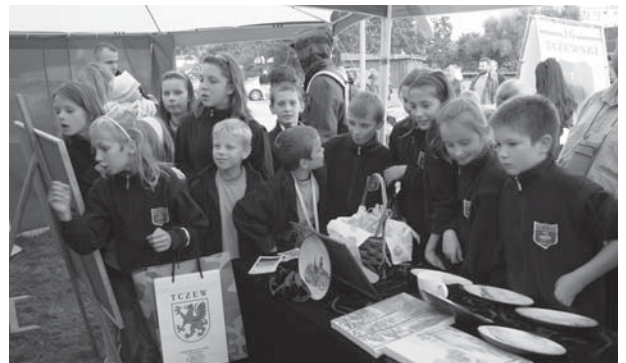
Tczewskie stoisko wzbudziło ogromne zainteresowanie, szczególnie wśród dzieci i młodzieży.

Program artystyczny zaprezentowały zespoły i ośrodki kultury, na odwiedzających