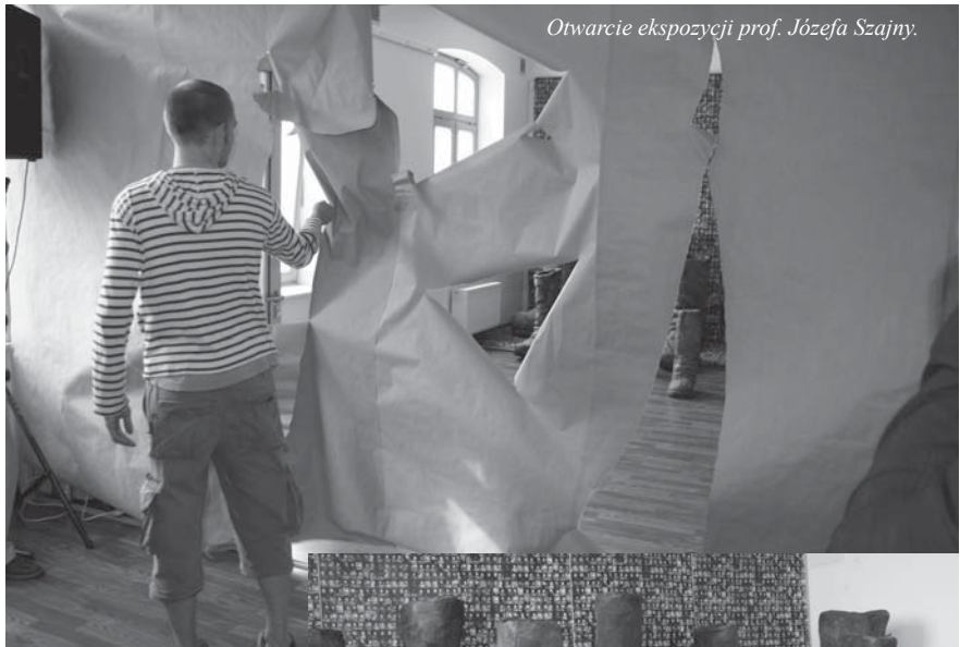
Otwarcie ekspozycji prof. Józefa Szajny.

I na koniec słowo o publiczności, a ta jest na „Zdarzeniach” naprawdę wyjątkowa. Mimo, że niemal przed każdym spektaklem mniejsze lub większe grono osób musiało odejść z kwitkiem z powodu braku miejsc, nie było pretensji, protestów. Do sal wchodziło tyle osób, ile było w stanie się zmieścić, a nie tyle ile przygotowano krzeseł. Wiele osób, aby móc obejrzeć spektakl, gotowych było znosić niewygodę - siedzieć na podłodze, parapecie, gdziekolwiek udało się znaleźć odrobinę miejsca. Nie komfort był tu najważniejszy. Przez trzy dni ulice Tczewa pełne były młodych ludzi - artystów, widzów, którzy