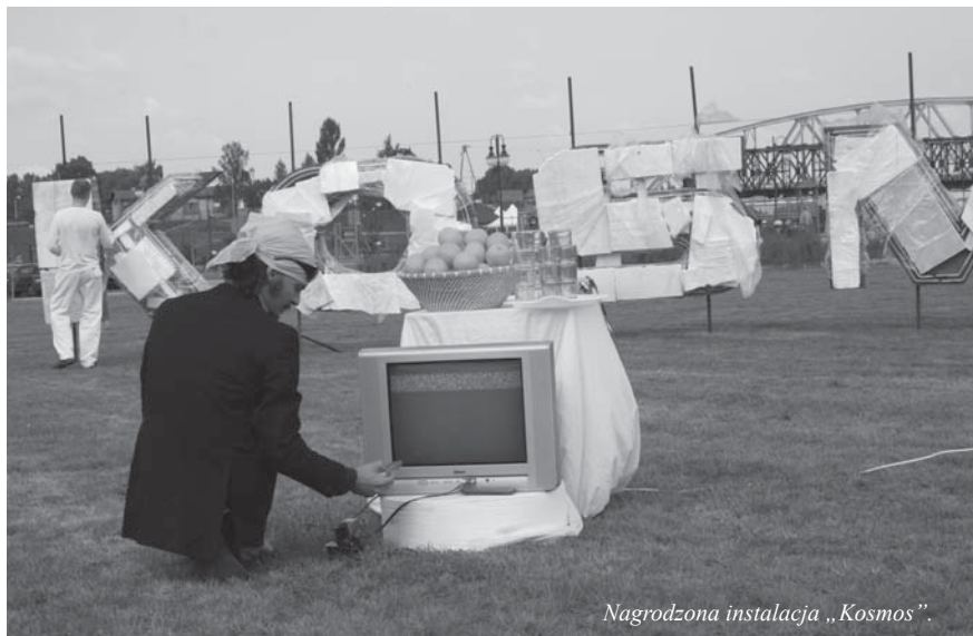
Nagrodzona instalacja „Kosmos”.

Wiele osób z niecierpliwością czekało na spektakle Teatru Nowego z Krakowa. Tym razem zobaczyliśmy dwie propozycje - „Historie Petera Zelenki” oraz „Griga”. Ten ostatni spektakl był już wystawiany podczas VI edycji „Zdarzeń” w 2005 r. Otrzymał wówczas nagrodę Fair Play. Wiąże się z nim ciekawa historia. - Gdy prof. Anna Polony kilka