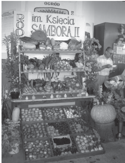
Wystawa plonów ROD im. Księcia Sambora II.

Podczas imprezy można było zwiedzać wystawę działkowych plonów, wystawę gołębi oraz obejrzeć występy podopiecznych Warsztatów Terapii Zajęciowej z ulicy Wigury. Dzieci miały szansę postrzelać do tarczy i wziąć udział w loterii fantowej. Dorośli strzelali z broni sportowej. Tytuł „Mistrza Tczewskich Ogrodów Działkowych” drużynowo (dwubój - strzelanie i rzut granatem) zdo-