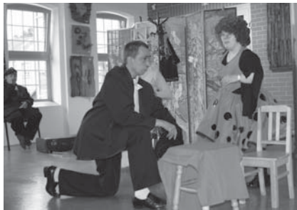
„Do biedronki przyszedł żuk...” w wykonaniu warsztatowców.