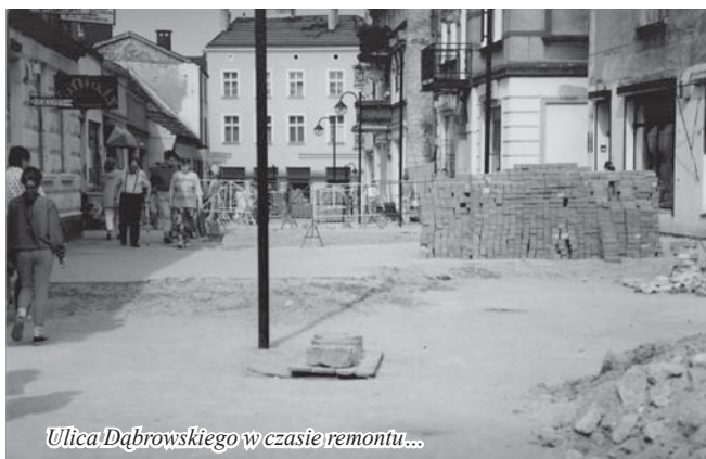
Ulica Dąbrowskiego w czasie remontu...

Realizacja zamierzeń jest bardzo kosztowna, a wobec braku wsparcia z budżetu