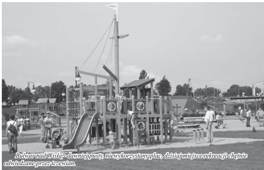
Bulwar nad Wisłą – dawniej pusty, niewykorzystany plac, dzisiaj miejsce rekreacji chętnie odwiedzane przez tczewian.

Ostatnie lata to przede wszystkim stworzenie miejsca rekreacji i rozrywki na bulwarze nadwiślańskim stanowiącym dolny taras Starego Miasta. Przedsięwzięcie to zostało wyróżnione w konkursie na „Najlepszą Przestrzeń Publiczną Województwa Pomorskiego”, ogłoszonym przez Marszałka Woj. Pomorskiego Jego celem była promocja dobrych wzorców zagospodarowania przestrzeni publicznej oraz uhonorowanie gmin, gdzie takie miejsca zostały stworzone.