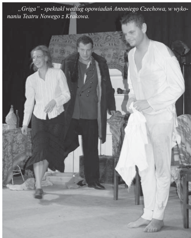
„Griga” - spektakl według opowiadań Antoniego Czechowa, w wykonaniu Teatru Nowego z Krakowa.