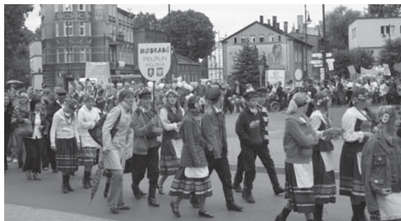
Barwny korowód przeszedł ulicami Tczewa.