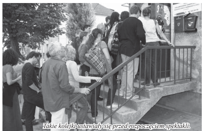
Takie kolejki ustawiały się przed rozpoczęciem spektakli.