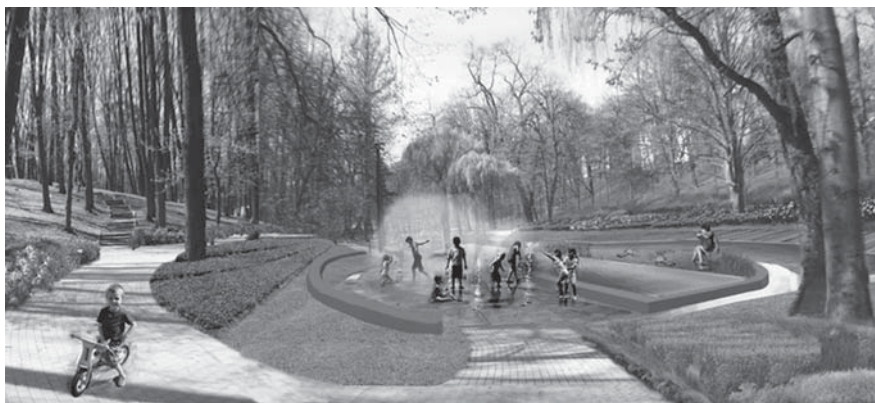
Tak ma wyglądać stawek po zmianach.

W bogatym drzewostanie parku są m.in. egzotyczne drzewa i krzewy, dwa spośród rosnących w pobliżu stawku buków pospolitych uznano za pomniki przyrody. Prawdopodobnie zostały posadzone, gdy zakładano park. W pobliżu wejścia do parku leży głaz, na którym umieszczono tablicę upamiętniającą kilkudziesięciu tczewskich harcerzy poległych i zamordowanych podczas II wojny światowej, a w pobliżu Zespołu Szkół Technicznych umieszczono tablicę poświęconą ofiarom stalinizmu.