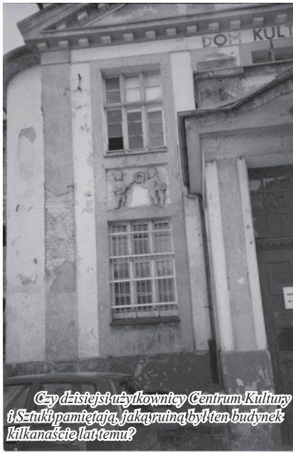
Czy dżiesiąt rzytkownicy Centrum Kultury i Sztuki pamiętają, jak wyglądał ten budynek kilkanaście lat temu?