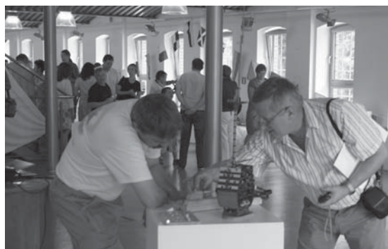
Modele statków wzbudzały ogromne zainteresowanie.

Podczas wystawy można było zobaczyć pokaz multimedialny o tym, jak powstają modele statków, a także zobaczyć mini-warsztat modelarski i przekonać się, jak skomplikowaną sprawą jest choćby skręca-