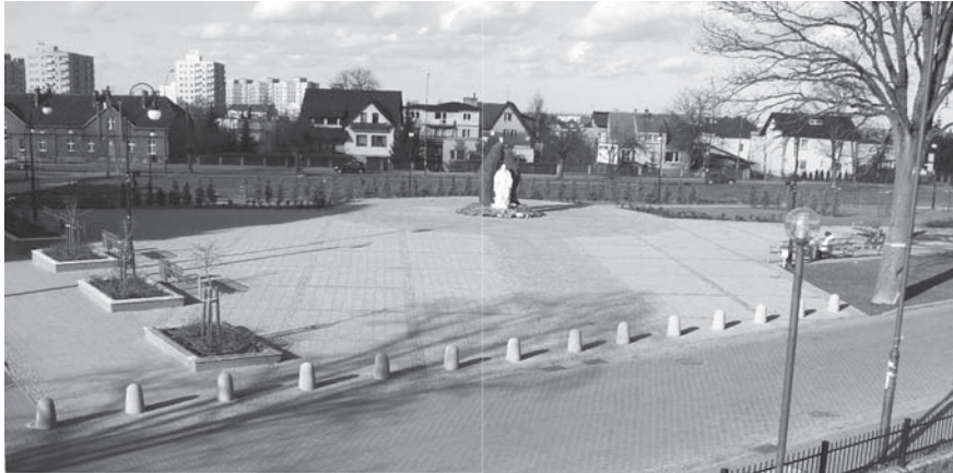
W miejscu dzikiego parkingu powstało miejsce spacerów i wypoczynku tczewian.

Plac Papieski w Tczewie znalazł się wśród 16 miejsc nominowanych do nagrody w „Konkursie na najlepiej zagospodarowaną przestrzeń publiczną 2008.” Ten ogólnopolski konkurs zorganizowało Towarzystwo Urbanistów Polskich. Jego celem jest propagowanie idei tworzenia i urządzania przestrzeni publicznej - miejsca integracji lokalnej społeczności.