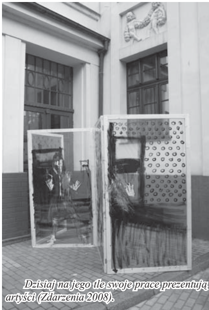
Dzisiaj na jego tle swoje prace prezentują artyści (Zdarzenia 2008).

centralnego, cała nadzieja w dotacji w ramach Regionalnego Programu Operacyjnego Województwa Pomorskiego. Niestety, rywalizacja o te ograniczone środki będzie duża. O wsparcie stara się 8 miast, a do dysponowania będzie 8 mln euro. Konkurs ma zostać rozstrzygnięty w drugiej połowie przyszłego roku.