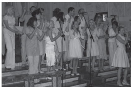
Koncert Opole Gospel Choir.

W sierpniu byliśmy świadkami dwóch dużych koncertów, których organizatorem był samorząd miasta Tczewa.