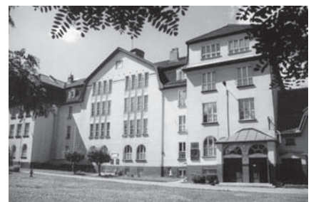
I LO ma już 60 lat.

Szczegółowy program imprezy można znaleźć na stronie: www.skłodowska.szkoła.tczew.pl . Tam również podano konto, na które należy przelać opłatę za udział w zjeździe. Informacji udziela także sekretariat szkoły: tel. 058 531-05-25.