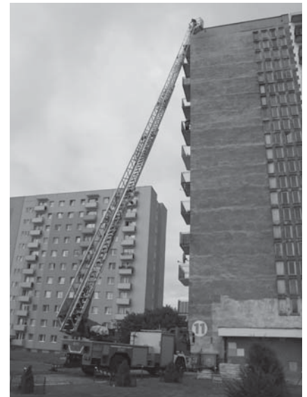
Próba generalna przy jednym z tczewskich wieżowców.

- Po tej próbie mogę stwierdzić, że drabina 37-metrowa wystarczy na potrzeby Tczewa - powiedział nam komendant Waldemar