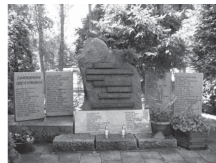
Pomnik koło koszar wojskowych, gdzie upamiętniono imię tczewskiego burmistrza.