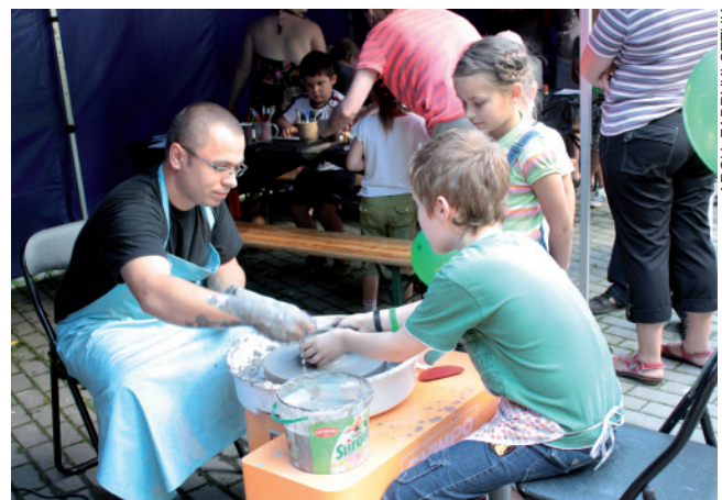
ARCH. FABRYKI SZTUK

Piknik zorganizowany przez bibliotekę zainteresował wielu tczewian