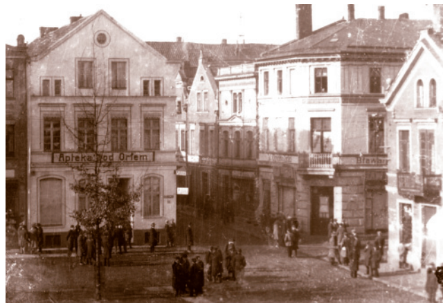
Apteka pod Orłem (lata międzywojenne)

Ta część szczególnie będzie nas interesowała. Na zakończeniu są jeszcze reklamy miejscowych sklepów i zakładów.