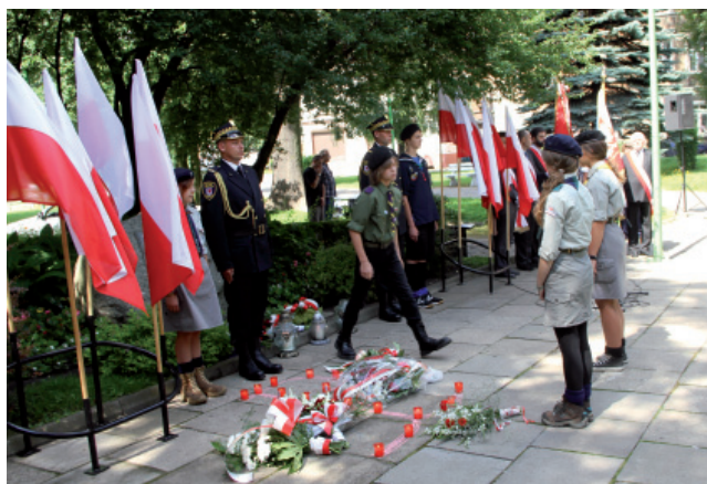
Kwiaty pod pomnikiem złożyli m.in. tczewscy harcerze