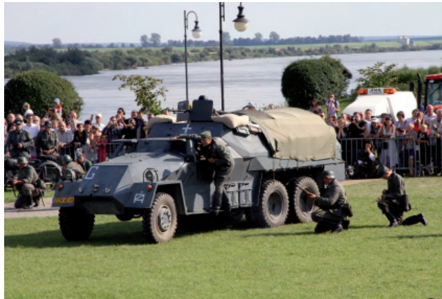
Inszenizacja historyczna będzie jednym z elementów obchodów rocznicy wybuchu wojny (zdjęcie z 2011 r.)

Oficjalne uroczystości rozpoczną się w samo południe przy obelisku na Bulwarze nad Wisłą (ul. Jana z Kolna). Poprzedzi je krótki rys historyczny na temat wydarzeń, które rozegrały się w Tczewie 1 września 1939 r. W programie uroczystości m.in. oddanie honorów sztandarowi Kompanii Honorowej Wojska Polskiego przez prezydenta RP, przegląd pododdziałów, przywitanie z żołnierzami, hymn państwowy, wystąpienie prezydenta Tczewa Mirosława Poblóczkiego , przemówienie prezydenta RP Bronisława Komorowskiego , modlitwy ekumeniczne, uroczysty Apel Pamięci, salwa